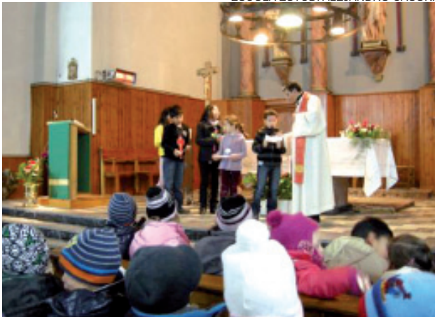
Los alumnos, durante la celebración religiosa.