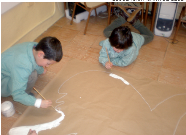
Todos participaron en el dibujo de la gran paloma de la paz.