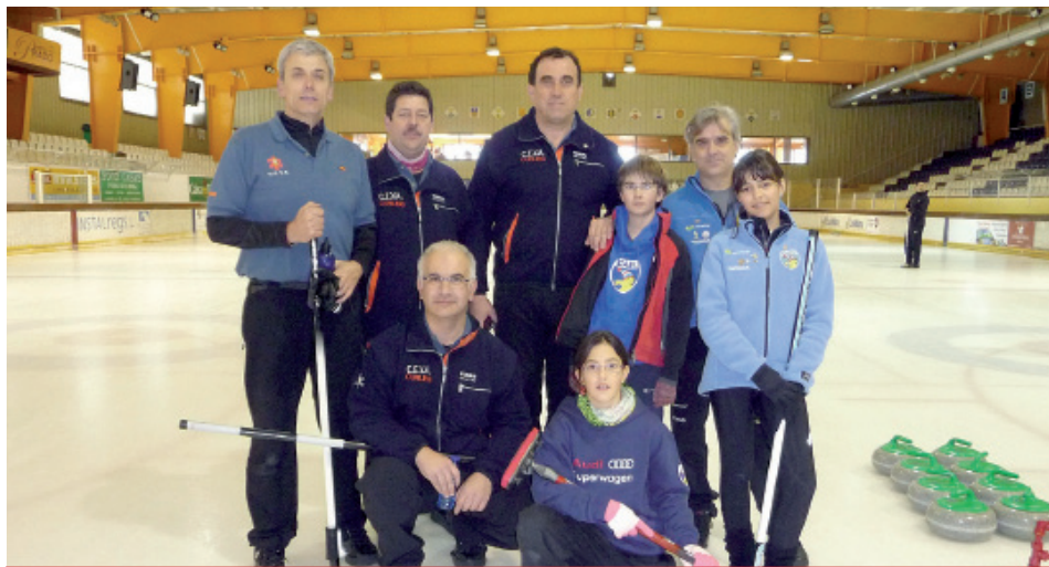
Integrantes de los equipos araneses que participan en la Lliga Catalana de Curling.

via, los cuatro primeros clasificados de los dos grupos -entre ellos los dos equipos del CEVA- disputaron los cuartos de final, en el que los dos araneses se clasificaron para jugar una de las semifi-