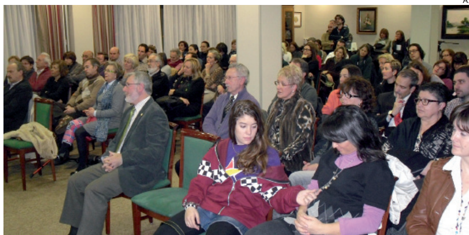
Los asistentes siguieron con atención la disertación de la novelista española.