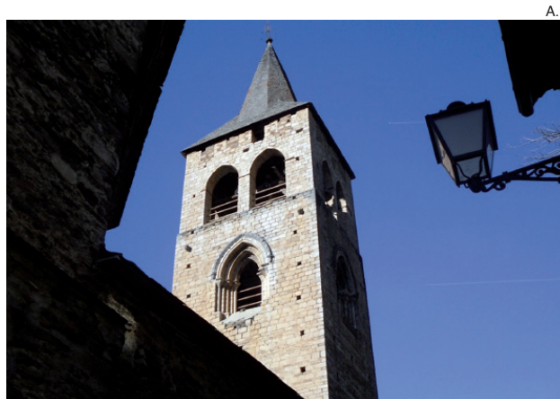
El campanario de Vilac luce ya en todo su esplendor.

Asimismo, desde lo alto del campanario se puede disfrutar de una vista 3nica del paisaje y las monta3as que