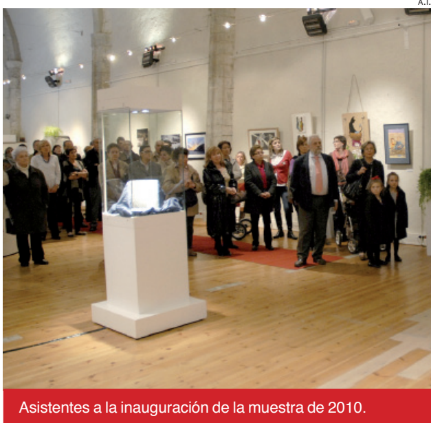
Asistentes a la inauguración de la muestra de 2010.

Por último, para Francés Boya la Lei del occitan, aranés en Aran "no puede significar una renuncia a nuestra lengua tal y como la conocemos". Por ello, el sindic apostó por "renovar el aranesismo con un nuevo compromiso social, con fuertes valores cívicos y con más capacidad para solucionar, desde la proximidad, los problemas de los ciudadanos".