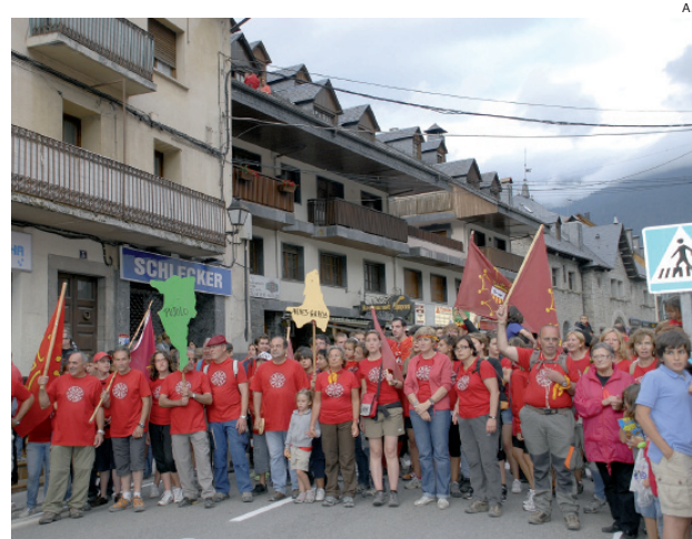
La Corsa Aran per sa Lengua cumple su mayoría de edad.

Lengua Viua quiere animar a los araneses a participar en la lectura pública que tradicionalmente tiene lugar cada 23 de abril, día de sant Jordi, en la plaça deth Conselh. En esta ocasión, la obra elegida es 'Hered' de Tòni Escala,