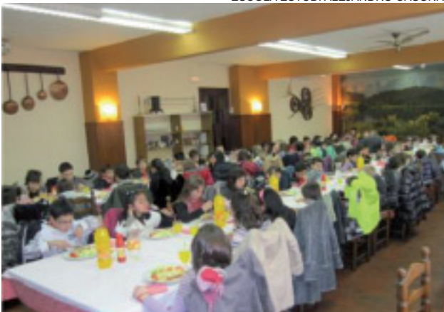
Todos los escolares compartieron la comida.