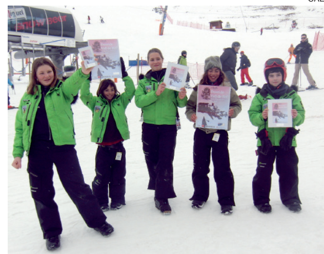
El grupo de deportistas del CAEI que participó en Boí Taüll.