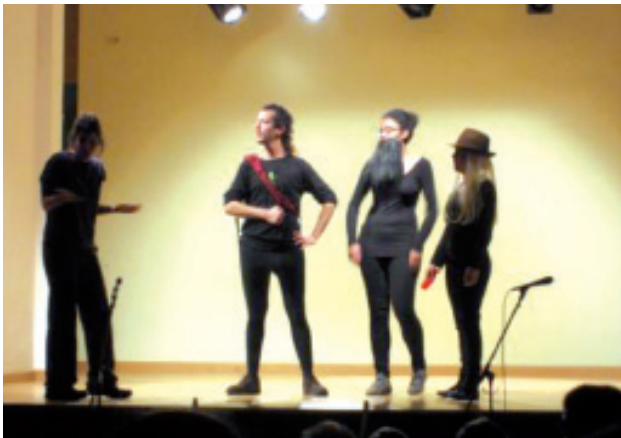
Por la tarde, disfrutaron con la obra "Quin embolic!"