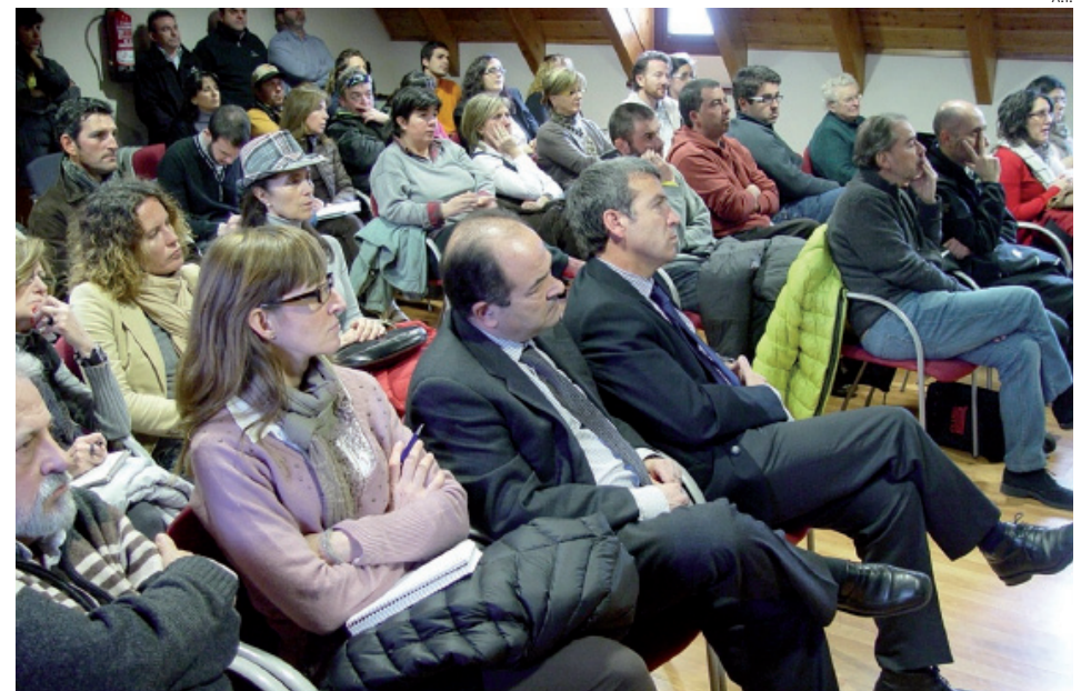
Asistentes a la presentación del proyecto del nuevo parque de aventura en Plan Batalhèr.

En Plan Batalhèr, además de reformar el refugio, se ha-