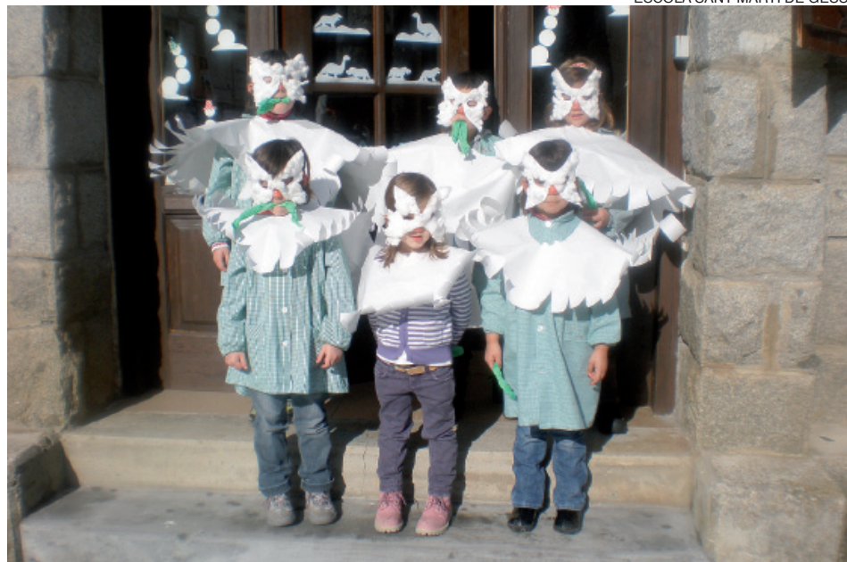
Los escolares, disfrazados de palomas de la paz, posan a la entrada de su colegio.