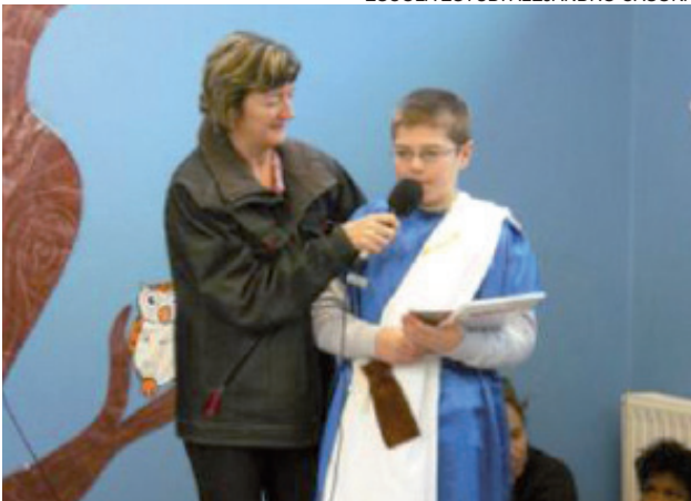
Los escolares conocieron la vida de Sant Vicenç.