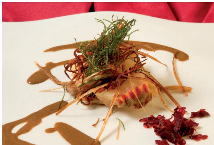
La gastronomía es uno de los atractivos

Además, durante el mes de marzo se ofrecerán visitas guiadas todas las tardes al