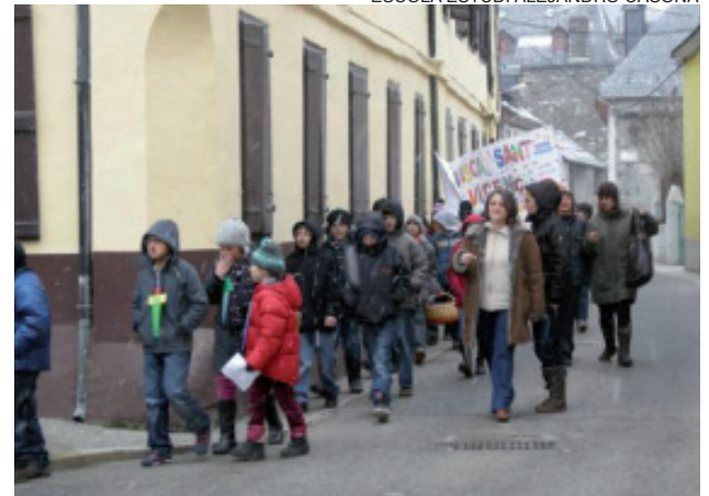
Los alumnos, durante el pasacalles por las calles de Les.