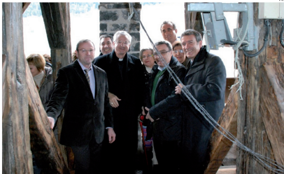
Las autoridades disfrutaron con la primera visita al restaurado monumento aran3s.

Boya record3 que "el Govern aran3s ha realizado mejoras en casi todas las iglesias con la voluntad de seguir preservando y recuperando el conjunto del patrimonio hist3rico art3stico de la Val d'Aran", a3adiendo que "esta pol3tica necesita tambi3n de