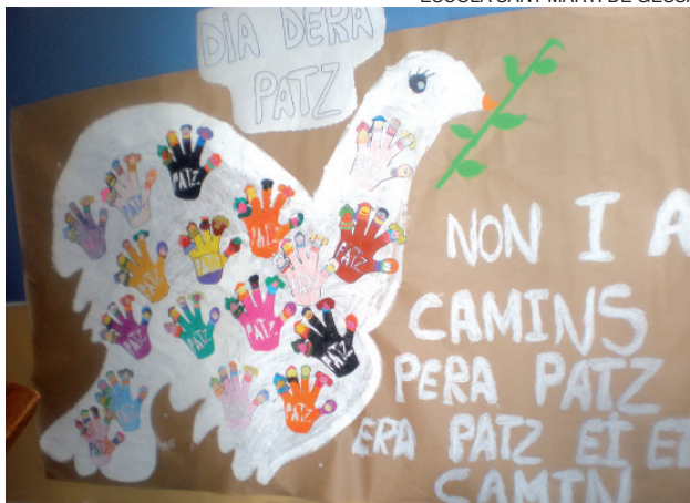
El resultado final, junto a la frase trabajada en clase.