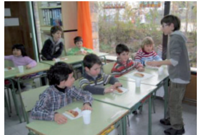
Y, el broche final, chocolate caliente con torta.