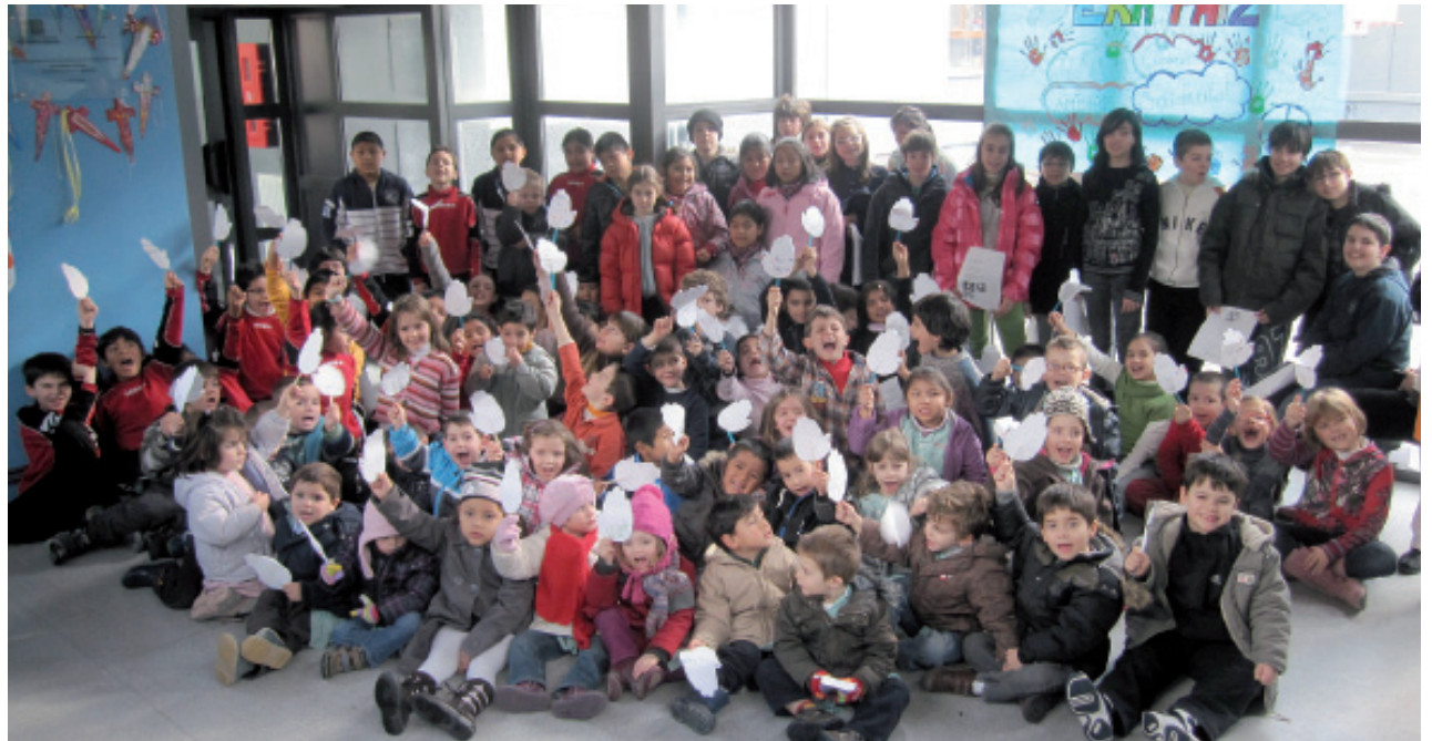
Todos los alumnos del Estudi Alejandro Casona de Les posaron para la foto colectiva del Día de la no violencia y la paz.

auem sajat de conscienciar sus eth besonh de bastir toti amassa una mon mielhor, mès solidari, mès parier, ... e ac auem hèt damb lectura de poèmes e cançons sus era patz e damb eth simbèu dera colomb en ua manuqueta. Des dera Escòla Estudi Alejandro Casona volem cridam ben fòrt "VOLEM ERA PATZ!!"