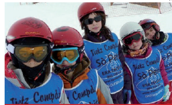
Muchos niños disfrutaron de la nieve estos meses.

dores de 11 y 12 años, cayó derrotado ante el experimentado CEVA senior en el último partido de la previa. Ahora, deberá jugar otra liguilla para decidir los puestos del noveno al duodécimo lugar.