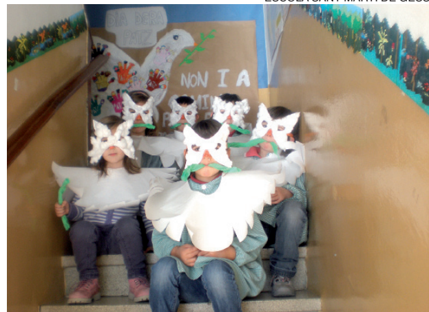
Con los disfraces, delante del gran mural de la paz.