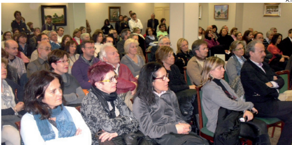
Numerosos araneses no quisieron perderse la charla de Almudena Grandes.