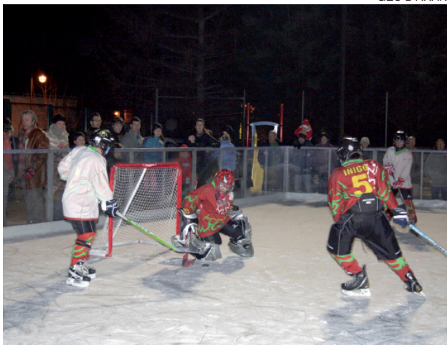
Los jugadores del Gèu d'Aran entrenan en Arties.