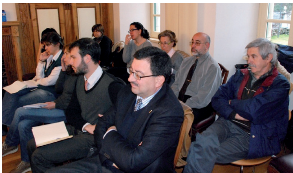
Algunos miembros del IEA siguieron 'in situ' el desarrollo del pleno del Conselh.