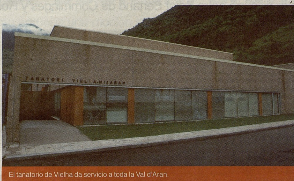
El tanatorio de Vielha da servicio a toda la Val d'Aran.

Esta actuación supondrá una inversión de 90.000 euros, de los que el Conselh aportará 65.000 y los 25.000 restantes correrán a cargo del Consistorio de Vielha. El objetivo es ampliar la capacidad del tanatorio que, de esta forma, pasará de contar con dos salas a tener tres, y se reformará la entrada al edificio para hacerla más espaciosa.