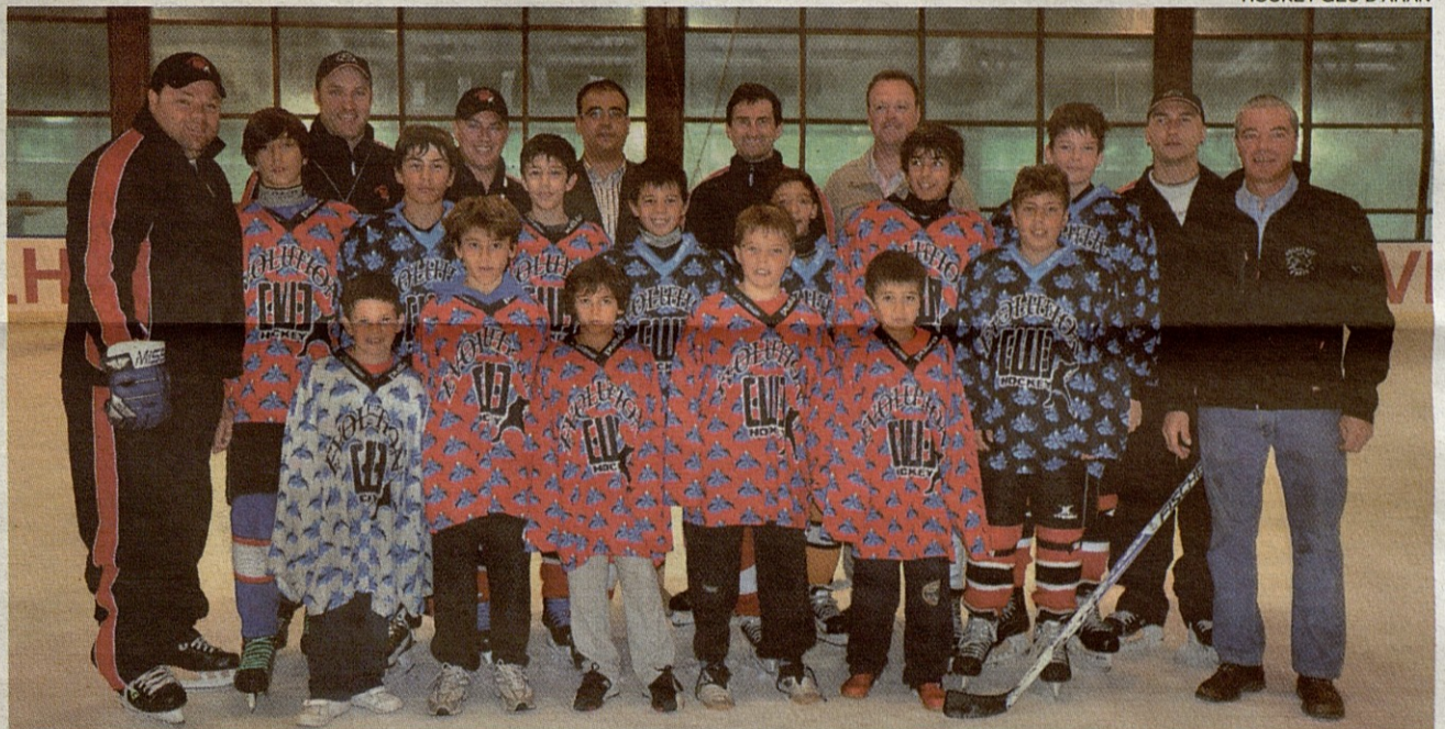
En el campus participaron quince deportistas araneses, integrantes del Hockey Gèu d'Aran.

Asimismo, los más mayores recibieron clases de aeróbic y de iniciación a la escalada en el rocódromo, dos