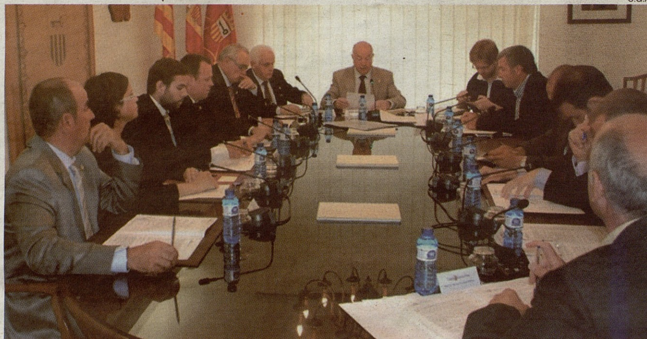
Los conselhèrs araneses aprobaron por unanimidad la moción institucional en defensa de la Lei der occitan, aranés en Aran.

Posteriormente, el pleno reunido en sesión extraordinaria aprobó por unanimidad la moción de rechazo al recurso de inconstitucionalidad contra la 'Lei der occitan, aranés en Aran' aprobada por el Consejo de Ministros del Gobierno español. En el documento se recuerda que "los ciudadanos de Catalunya y sus instituciones políticas reconocen Aran como una realidad