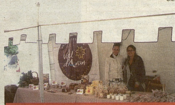
Stand de la Marca de Garantía en la feria de Vielha.

El Conselh insta a Fomento a reparar la N-230