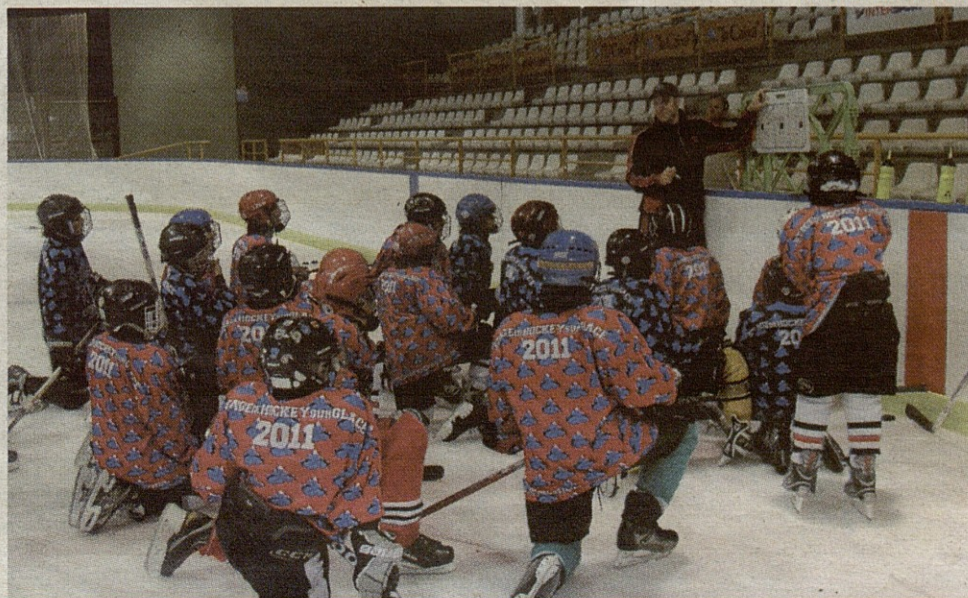
Las clases del stage tenían una parte teórica.