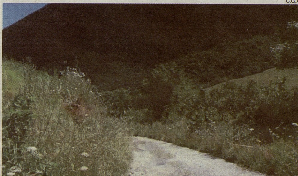
El camino de la ribera de Vielha se convertirá en una vía de emergencia de la N-230.