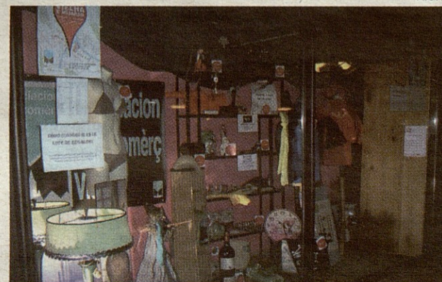
La ACV expone los regalos para el sorteo de 'De Tiendas'.

Con el fin de comprobar que se ha realizado la ruta, los participantes deben solicitar en los comercios un código secreto que deben incluir en el boleto que, una vez completado, se introducirá en la urna de la Oficina de Turismo. El sorteo, el 6 de septiembre.