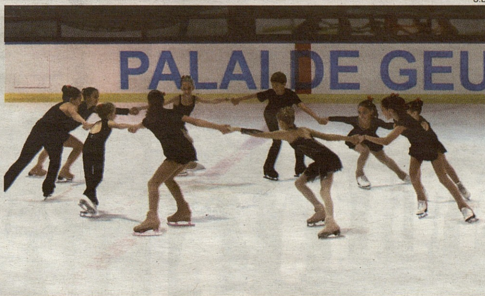
Otro momento de la Gala Internacional de patinaje artístico celebrada en Vielha.