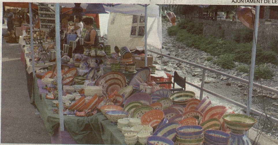
AJUNTAMENT DE LES

Durante los dos días, los artesanos ofrecieron una amplia gama de productos, con un gran protagonismo de los agroalimentarios, y realizaron demostraciones de oficios ya casi perdidos como herreros, alfareros, tejedoras, plateros.