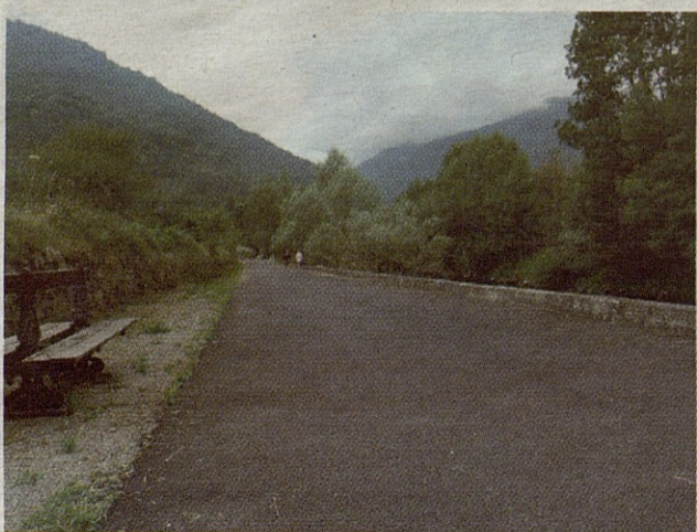
El Camin de Camon es utilizado por muchos vecinos.