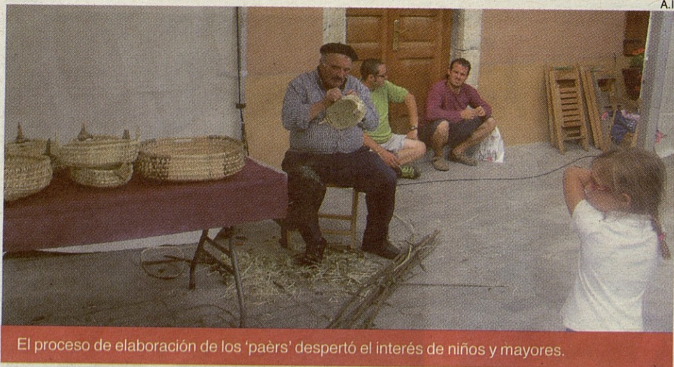
El proceso de elaboración de los 'paèrs' despertó el interés de niños y mayores.