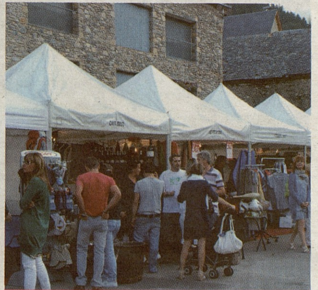
Imagen de la pasada edici3n de Aran Market.