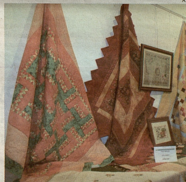
El patchwork cuenta cada vez con más adeptos.

Los interesados en participar en este I Patch Workshop pueden dirigirse a Val d'Aran Convention Bureau, en los teléfonos 973 644 457 o 671 541 545, o por correo electrónico en vacb@evalia.biz , donde les facilitarán información.