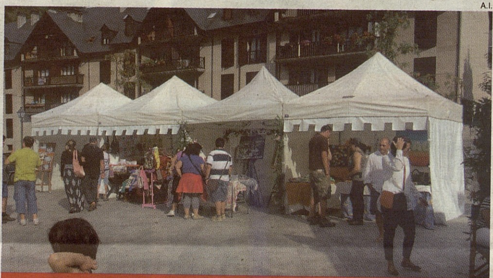
Vecinos y visitantes se interesaron por la oferta artesanal de Vielha.

Los más pequeños y también los mayores pudieron disfrutar de hasta siete talleres en los que conocer cómo se elabora el patchwork, macramé, maquillaje de fantasía o fieltro. Sin embargo, una de las técnicas que más interesó a todos fue la demostración del proceso de elaboración de los 'paèrs', un tipo de cesta característico de la Val d'Aran que todavía sigue realizando algún artesano.