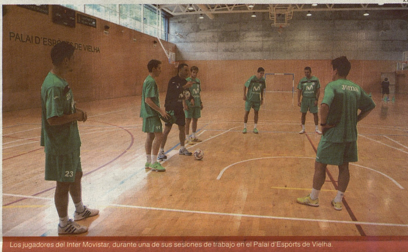
Los jugadores del Inter Movistar, durante una de sus sesiones de trabajo en el Palau d'Esports de Vielha.

En caso de decantarse por la opción aranesa, la selección española de fútbol-sala se desplazaría hasta la Val