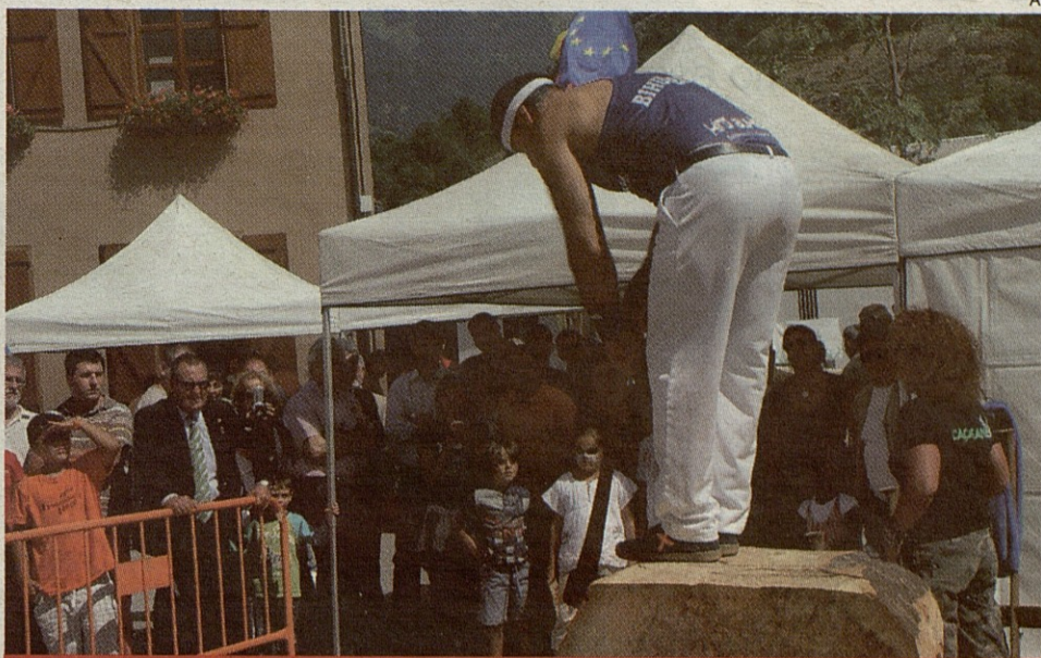
La exhibición de aizkolaris volverá a ser uno de los actos programados en Caçaran.

El domingo 4, Vielha volverá a ser escenario de la parte expositiva de Caçaran, con exhibiciones de aves rapaces y perros, y pesca infantil de