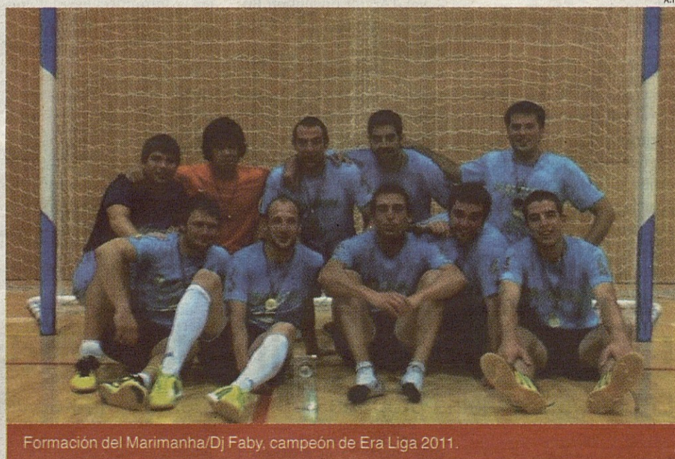
Formación del Marimanha/Dj Faby, campeón de Era Liga 2011.

La prórroga resultó muy emocionante. Marimanha/Dj Faby marcó dos nuevos goles y se colocó con un 3-1 en el electrónico, si bien Rejas/Anpema no dio nada por perdido, consiguió acortar diferencias hasta colocarse con 3-2, pero le faltó tiempo y fuerzas para culminar la re-