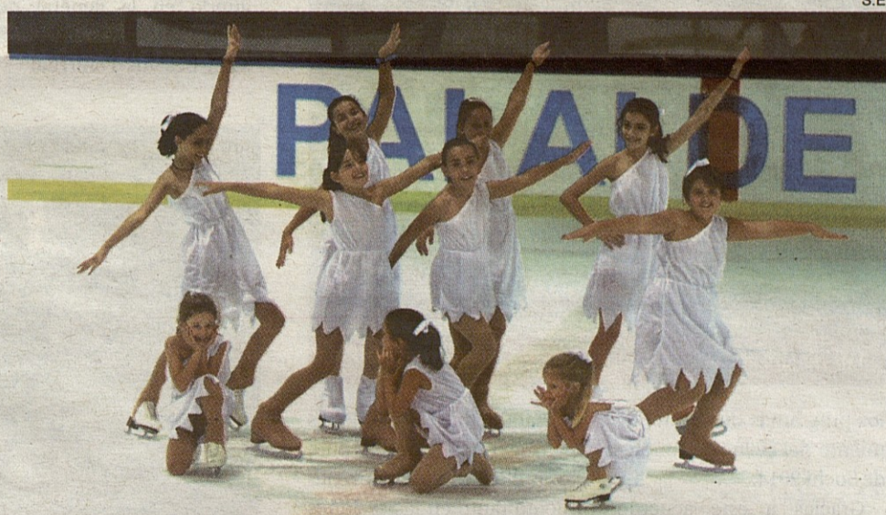
Uno de los montajes grupales realizados por los jóvenes patinadores.

Ante un público entregado, que abarrotó las gradas, los patinadores realizaron cuatro montajes grupales, además de los programas con los que tendrán que competir la próxima temporada 2011-12.