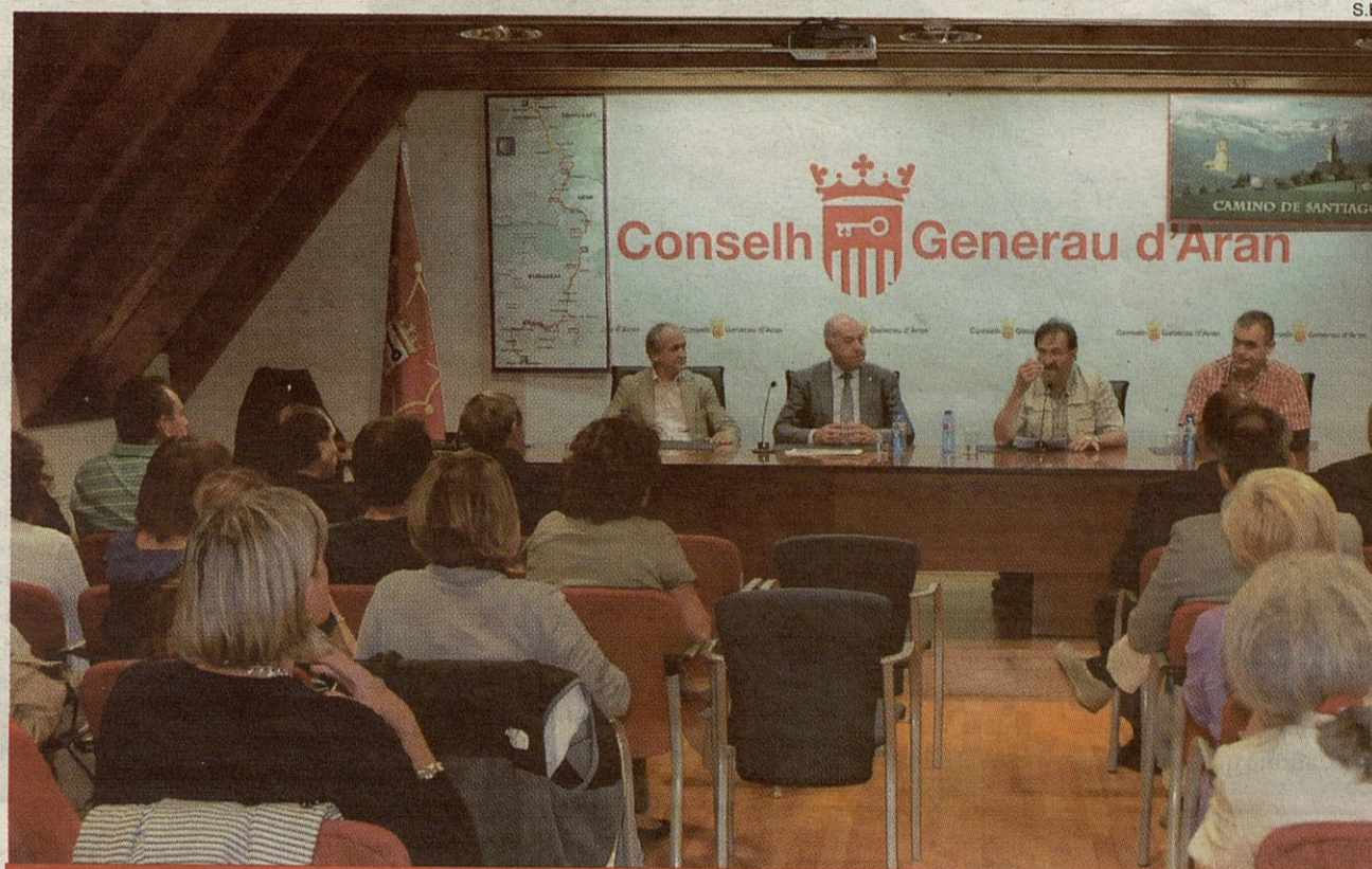
Numerosos araneses y visitantes asistieron a la presentación del estudio de la Asociación de Amigos del Camino de Santiago.

De este trazado, seguido por los peregrinos en época medieval, se conserva una bula del Papa Urbano VIII -siglos XVI y XVII- para los caminantes que pasaran por la localidad aranesa de Escunhau. No obstante, es muy posible que el camino aranés fuera utilizado siglos antes por los peregrinos que completaban la ruta hasta Santiago porque en caso contrario no tiene demasiado sentido el hospital construido en la cara sur del puerto de Vielha