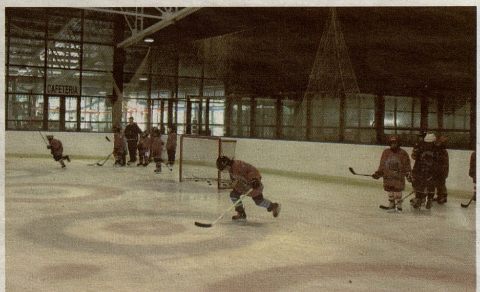
Y también otra práctica en la que realizar sobre el hielo los conceptos trabajados.