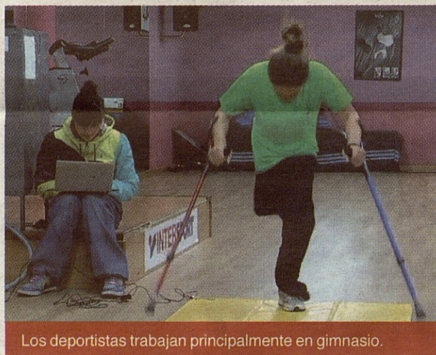
Los deportistas trabajan principalmente en gimnasio.

Por otra parte, Toshiba ha renovado su patrocinio con el Centro de Deportes de Invierno Adaptados, CDIA, para el desarrollo de los equipos nacionales de esquí alpino y esquí de fondo en