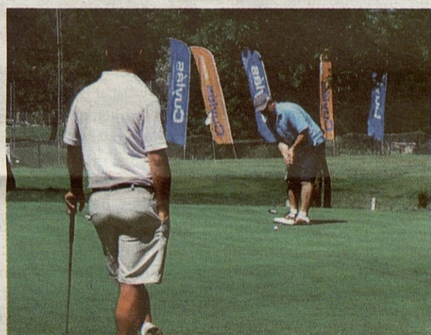
Jugadores en las instalaciones de Salardú.

Más información de la prueba en la página web www.aranbike.com .