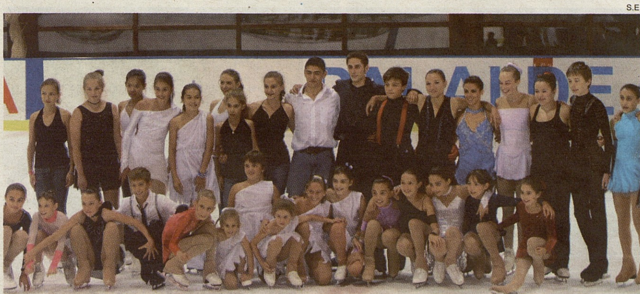
Foto de familia de los patinadores que participaron en la II Gala Internacional de Vielha.