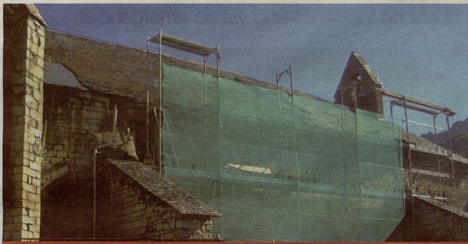
La iglesia de Sant Andreu de Salardú ya no tendrá problemas de humedades y goteras.

cución de las obras de restauración asciende a 140.885,083 euros y el Conselh Generau