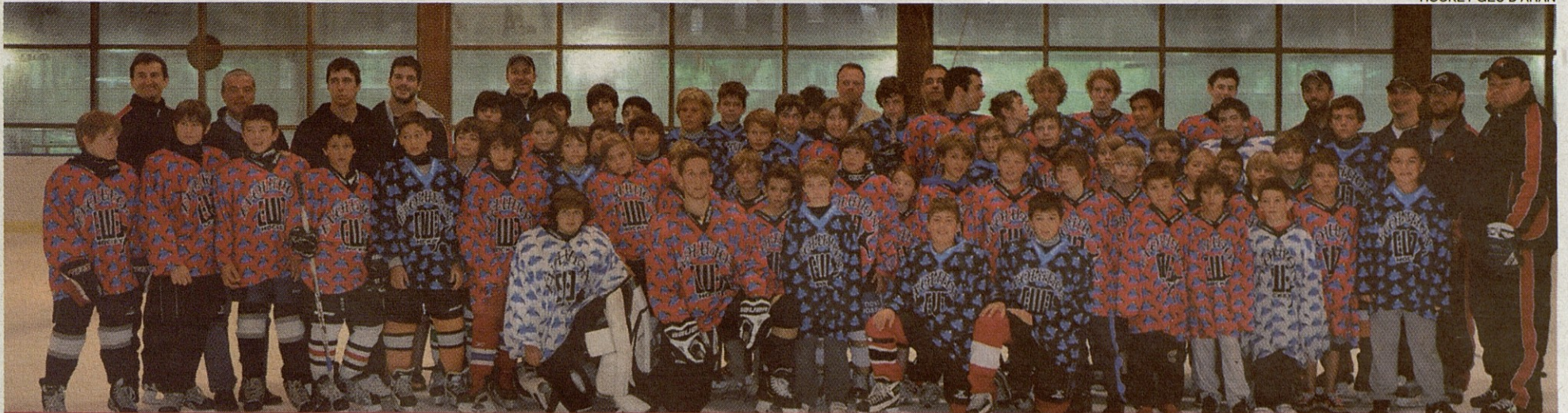
Foto de familia de los jóvenes jugadores participantes en el stage de 'Hockey sur glace', junto a los entrenadores y monitores encargados de la actividad.