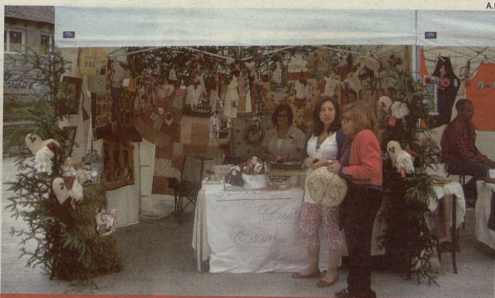
Desde Escunhau, la Asociación Cultural expuso las labores realizadas en patchwork.