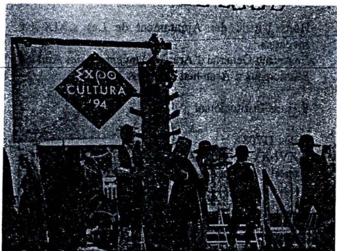
activitats Dançaires ath torn der Haro en "Moll de la Fusta de Barcelona"

Expocultura'94 non a estat sonqu'ua exhibicion senon qu'a volut aufrir un gran nombre d'espectacles e