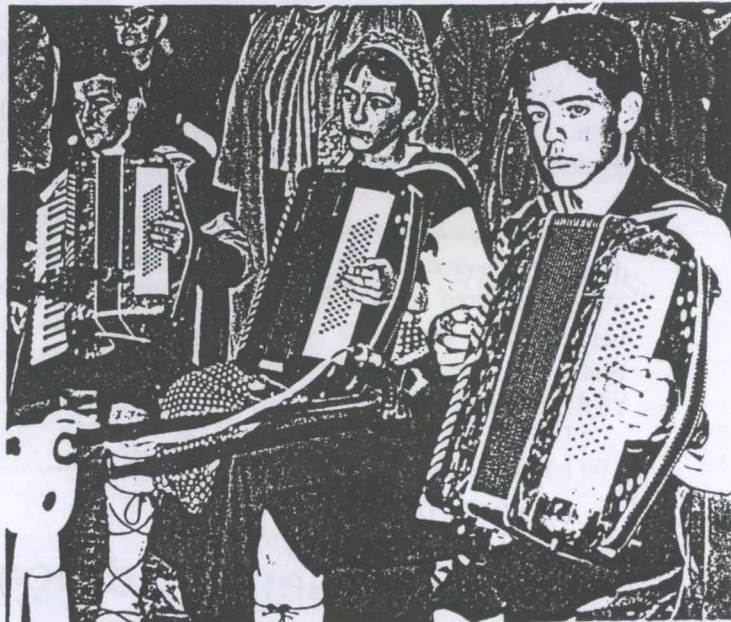
Grop d'acordeonistes d'Aran Estiu Culturau/93