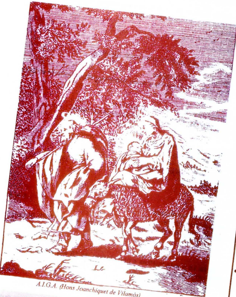
A.I.G.A. (Hons Joanchiquet de Vilamòs)