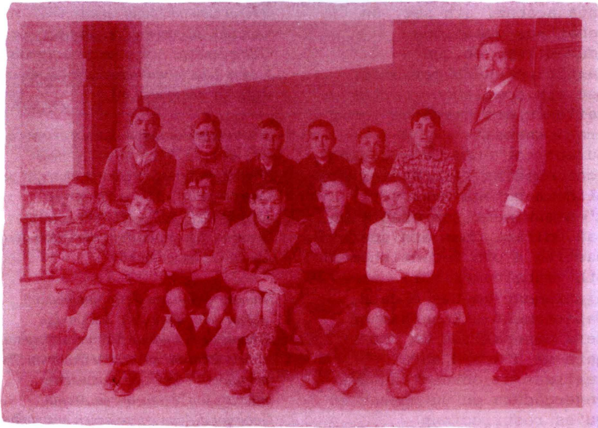
Escòla de Les 60 ans en darrèr