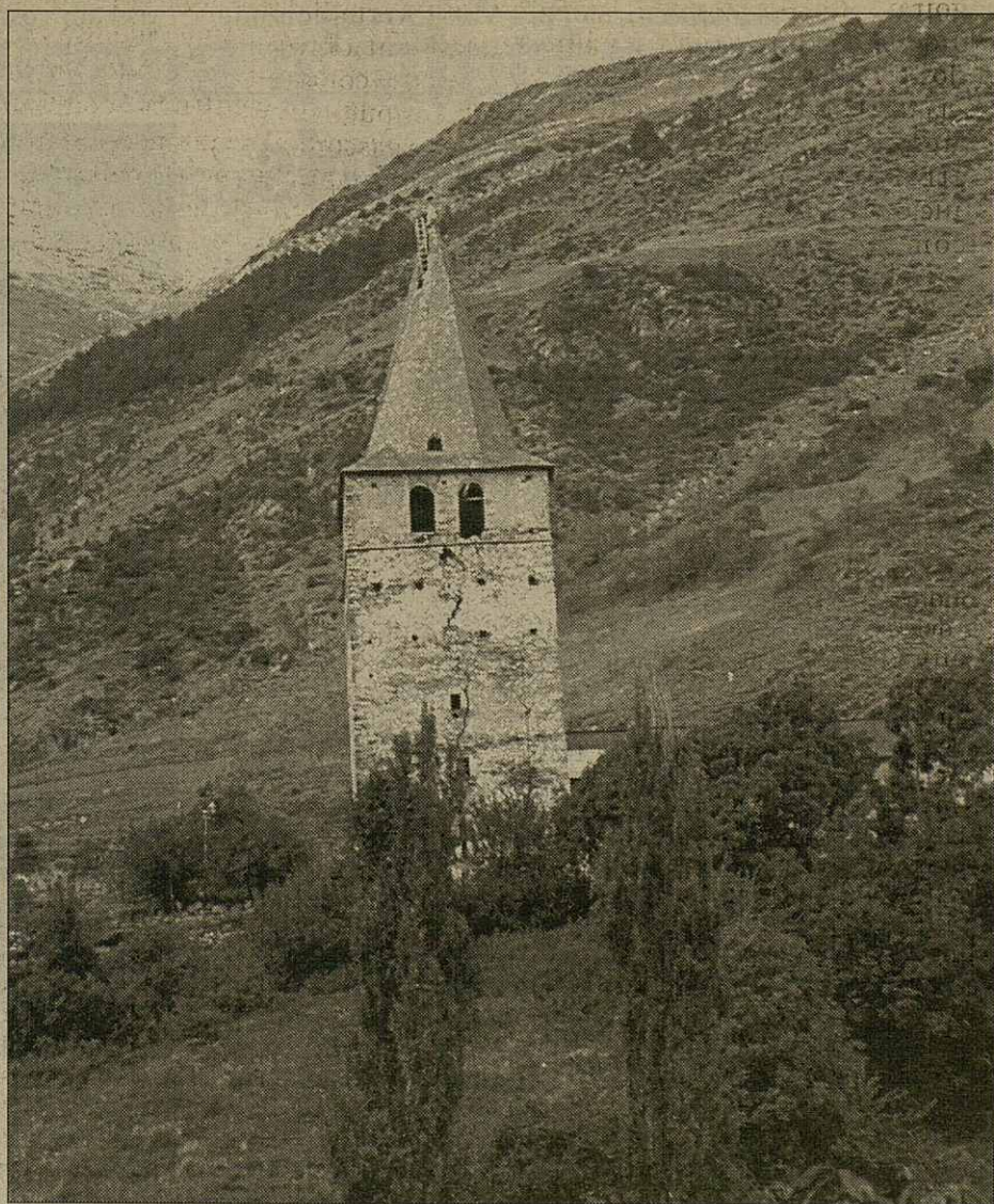
Es òbres an acabat aguesta passada setmana

En aguesta part superiora s'a profitat entà hèr mès solida era base que la ten. Era viroleta s'a plaçat en tot èster enlairada damb un elicotèr enquia hicà-la en horat.