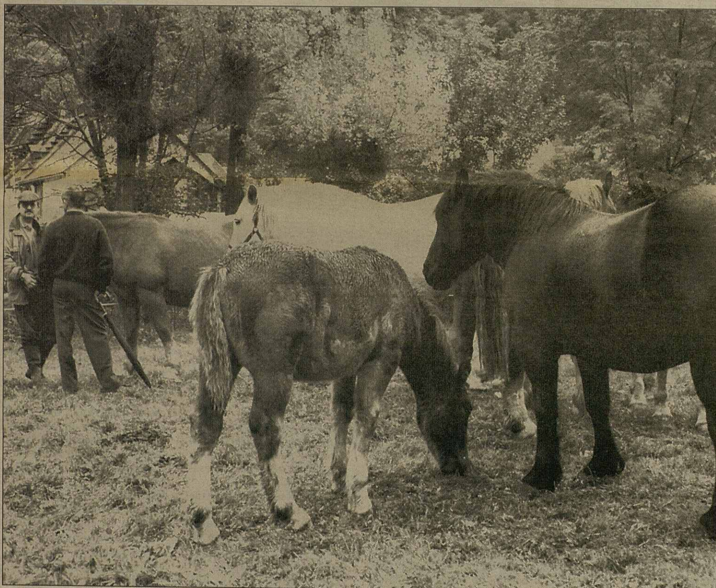
Era prumèra des tres hèires siguec dimars en Les

sòrta de productes. Un visitaire d'excepcion siguec eth Conselhèr de Trabalh, Ignaci Farreres, que estèc dijaus en Vielha.