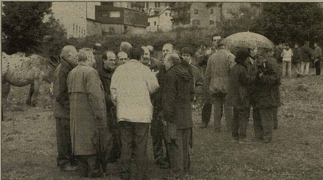
Eth Conselhèr Farreres visitèc eth recinte firau de Vielha

Totun, er Ajuntament de Les destine ua ajuda economica entara fira que per decision de toti es pagesi, se