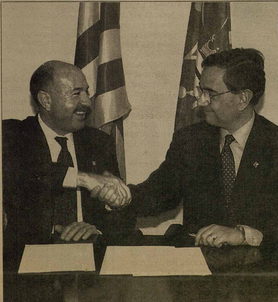
Signatura dera propòsta d'acòrd