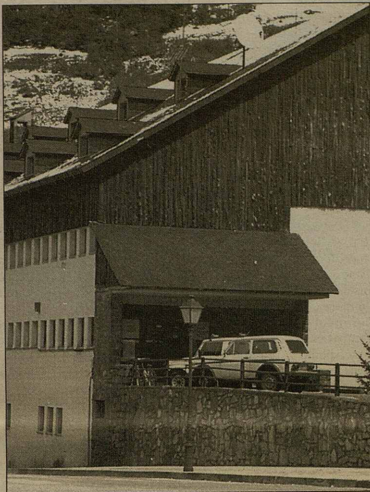
Er I.E.S de Vielha acuelherà es corsis de gascon aranés

Cau d'èder qu'abantes der inici des classes se signarà un convèni entre es institucions participaires des dus costats e se harà era inauguracion oficiau d'aguest prumèr cors 98-99. Aguest acte serà dubèrt entà totes aqueres persones que i volguen prèner part eth pròplèu 15 de seteme entàs