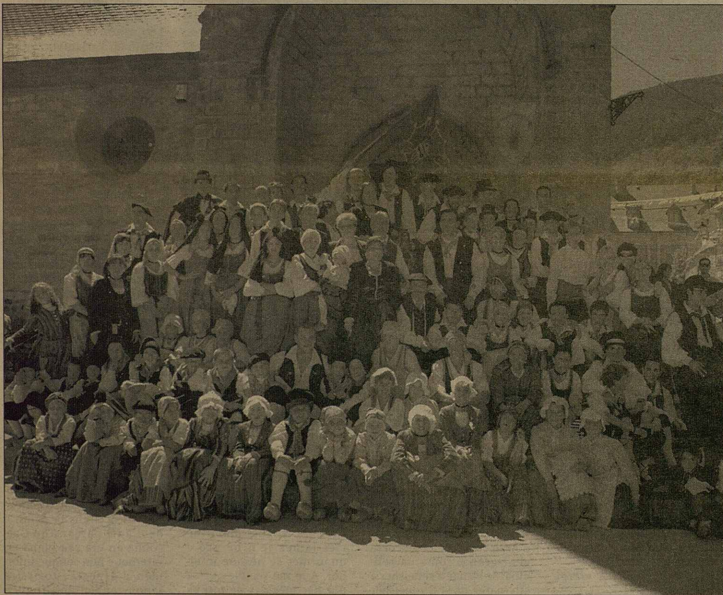
Un centenar de components formen actuaument era Còlha de Santa Maria de Mijaran

era sua trajectòria. Tanpòc an mancat era barada de balhs ena plaça dera Glèisa o era venta de samarretes e objèctes commemoratius.