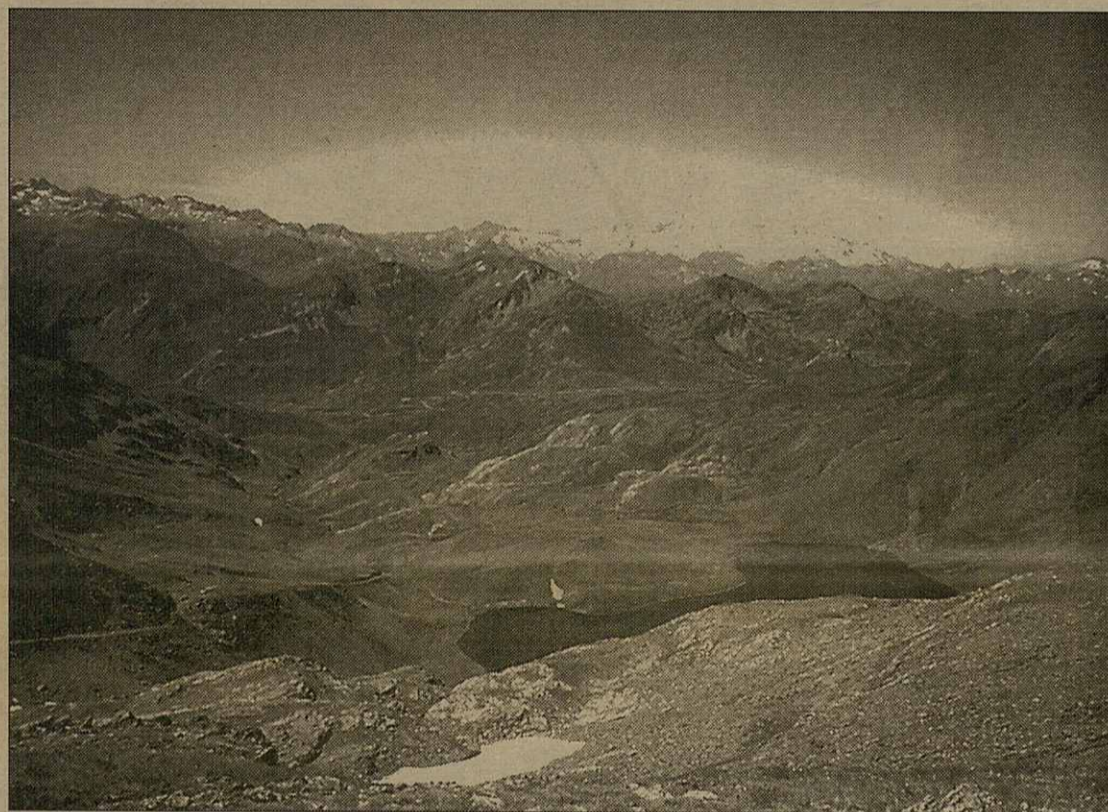
Era guida de sendèrs ei ua des publicacions nauedoses d'enguan

Ath delà d'aguestes accions enguan tanben se'n haràn ues autes coneishudes coma de suport ath plan. Aguest ei eth cas dera presència de Torisme Val d'Aran en Rally de Catalunya d'Alta Muntanya damb era finalitat de promocionar es sendèrs dera Val d'Aran. Torisme Val d'Aran tanben s'encuejarà dera organizacion des tardes de gresca e ua naua edicion deth romanicomuscau, ath delà de colaborar en activitats coma era Volta Ciclista a Espanha.