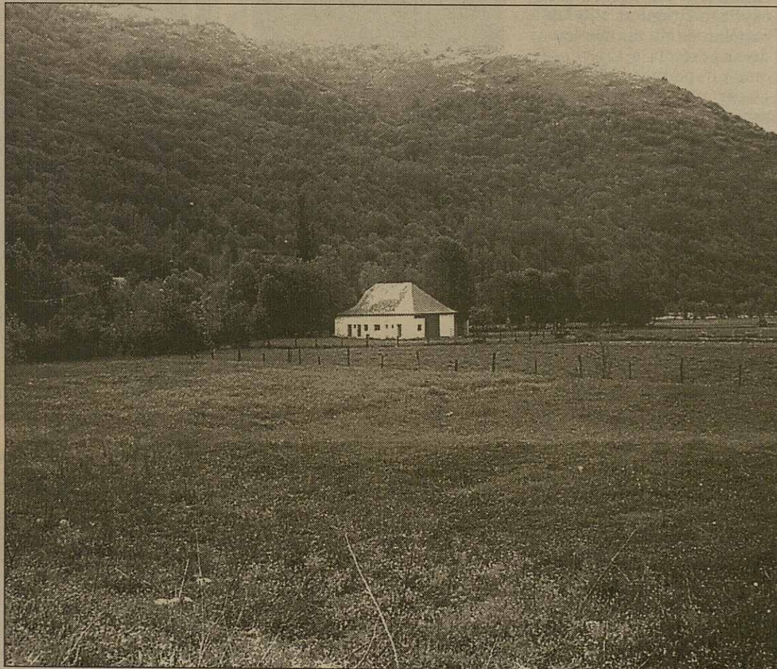
Es tèrmes se plaçaràn en uns terrenes entre er aucider e eth cementèri

Per çò que tanh ara promocion deth centre termau, segontes explicaue er empresari, es naues installacions se sajaràn de promocionar per miei d'uns paquets a on s'includisquen es otèls, sustot deth Baish Aran, amassa damb aguesti servicis parallèls. Er empresari higeç: "Atau se pòiran promocionar es installacions e ara ora captar mèns torisme".