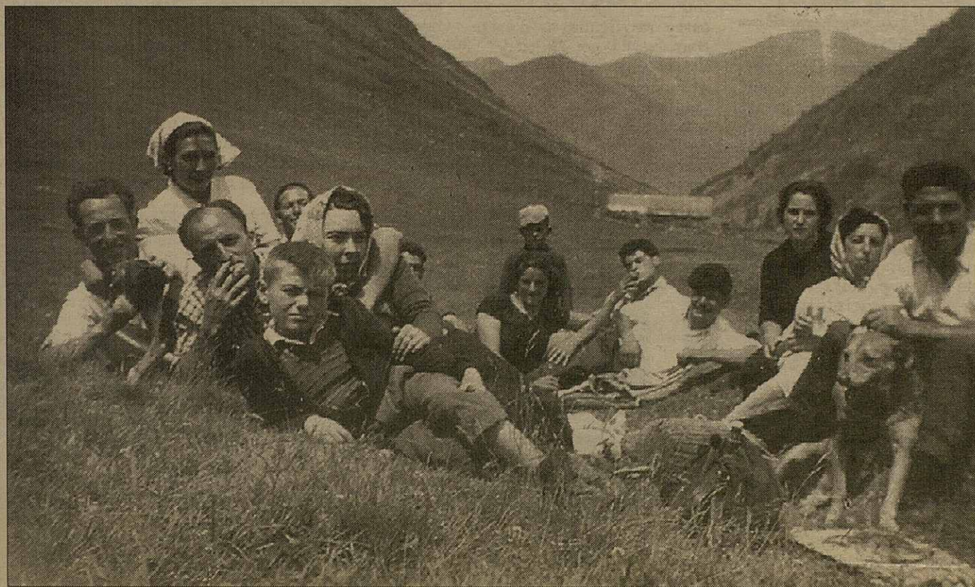
Es joeni d'Escunhau e Casarilh ena hèsta deth Santet er an 1955

enquia quaranta oelhes, cinc crabes e dètz crabòts. Tanben auien arribat as sèt vaques e boni shivaus. En pòble d'Escunhau entà auer shivaus e oelhes depenie dera granor dera bòrda. As de Tomalet madeish, as de Blasi, as de Pejoan, e as de Janson, i auie fòrça cauales e shivaus. “Totun, lèu toti en Escunhau deuïem d'auer ua vintia de oelhes. Es crabòts, quan n'auciem un, lo partiem en quate tròci e mo'lo deishàuem d'ua casa damb era auta. Atau, aué l'auciem nosati, deman l'aucien eri. Mos metiem d'acòrd e, auïem tostemp era carn fresca. Per aquerò te pòden díder qu'en Escunhau gana non se n'auie passat jamès”.