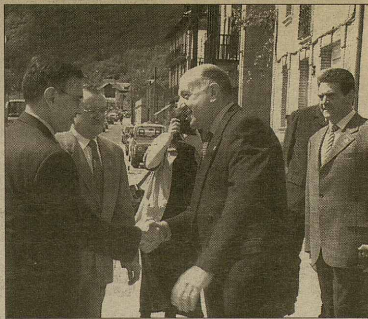
Eth sindic e autoritats de Bossòst en tot saludar eth conselher

poirie veir incrementada entath pròplèu mes de junh, segontes auançaue eth cap deth parc de pompièrs de