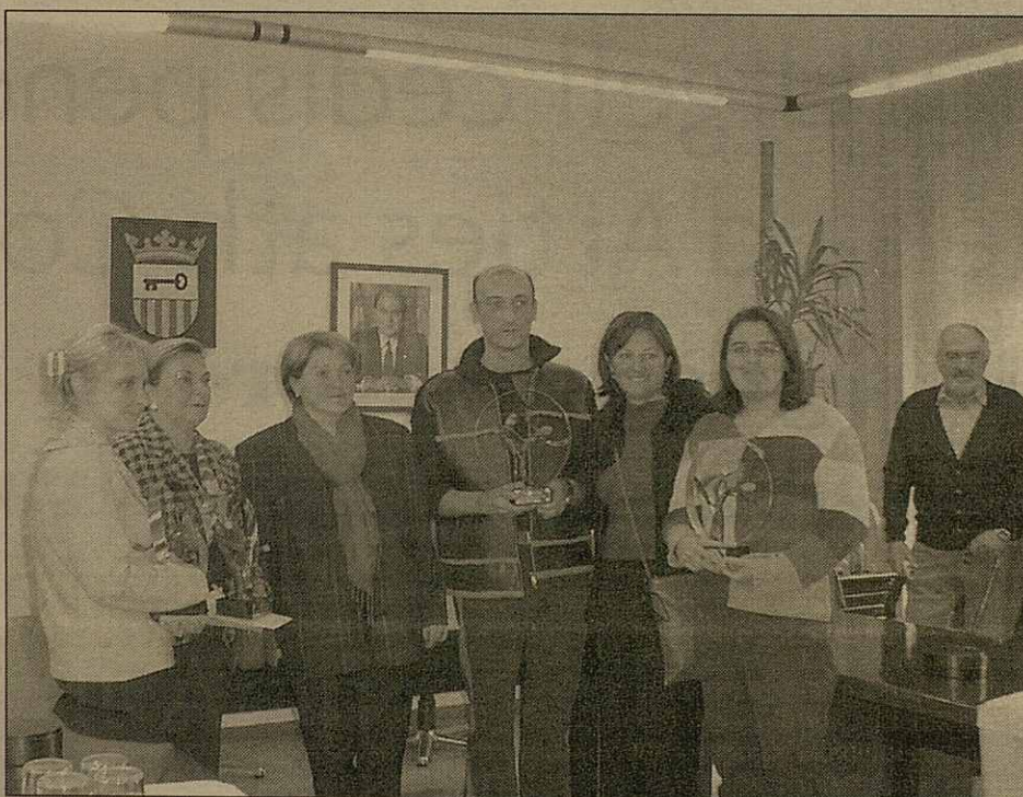
Toti es grops de dances receberen un prèmi coma mòstra der esfòrç realizat

desparièrs musèus d'Aran e d'ues autes activitats programades entar ostiu. Segontes Delaurens un des objectius entath pròplèu an ei trabalhar ena melhora dera senhalizacion des glèises. "Volem plaçar pannèus informatius ath laguens des pòbles", higeç era Conselhèra Delaurens.