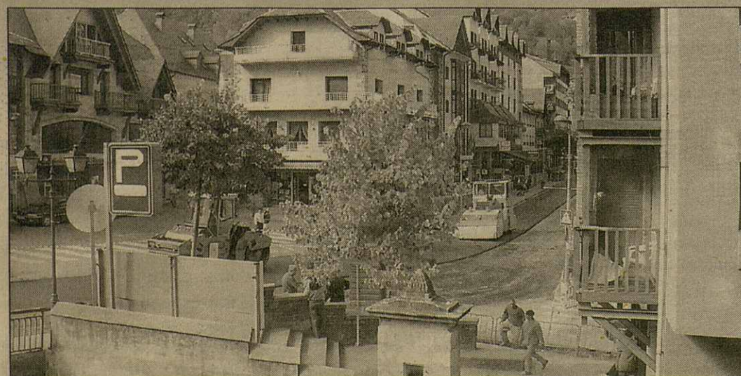
Era C-28, ath sòn pas peth nuclèu urban de Vielha, siguec talhada ara circolacion de veiculs de deluns enquià dimèrcles pr'amor que la engodronèren. Aguesta actuacion seguís as òbres d'installacion de toti es servicis que comencèren eth passat 16 de seteme.

procedic ara confiscacion des pèces de caça e des armes e se hec era denúncia dera infraccion per caçar sense permís d'espècies de caça major entar aprofitament pròpri. Talamet coma mèrque era legislacion, era carn se balhèc ar Espitau de Vielha, es armes ara Intervencion d'Armes e es caps se depausèren en Servicis d'Agricultura Ramaderia e Mieï Ambient entara sua avaloracion.