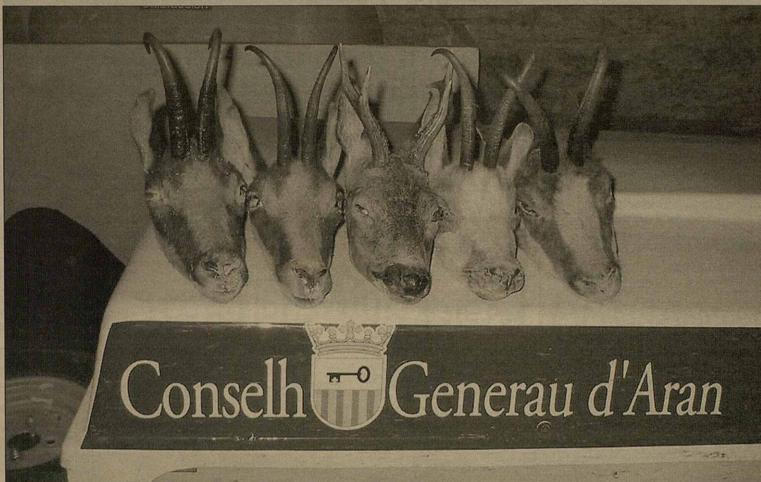
Es exemplars comisats se depositèren enes Servicis d'Agricultura Ramaderia e Mieï Ambient entara sua avaloracion