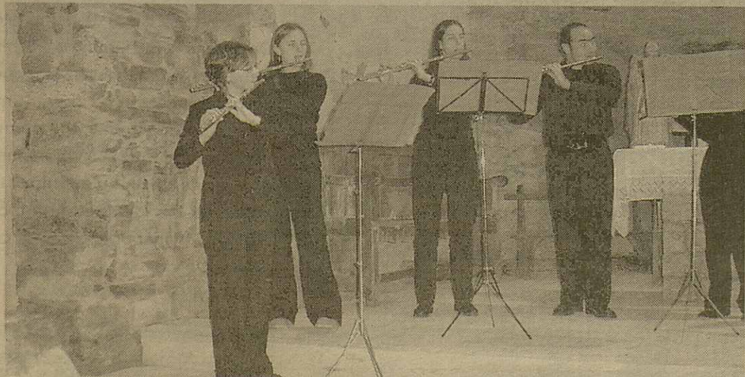
Eth grop Flaustaff amenissèc a toti es assistents ar acte d'acondicionament dera glèisa de Sant Martí d'Aubèrt damb un concèrt de flaüta traussèra. Aguest grop barceloní format per 10 components aufric musica de desparières compositors

territoriala organizada en tres representacions, era centrau, orientau e occidentau. En aguesta darrèra demoraue representada era Val d'Aran. Ena prepausa apareishie un punt que ditz qu'Aran poirà dispausar d'ua Delegacion Territorial d'encastre comarcau que depene dera occidentau e er art. 46 ditz qu'entà poder èster Delegacion Aran aurie de dispausar d'un minim de 5 clubs.