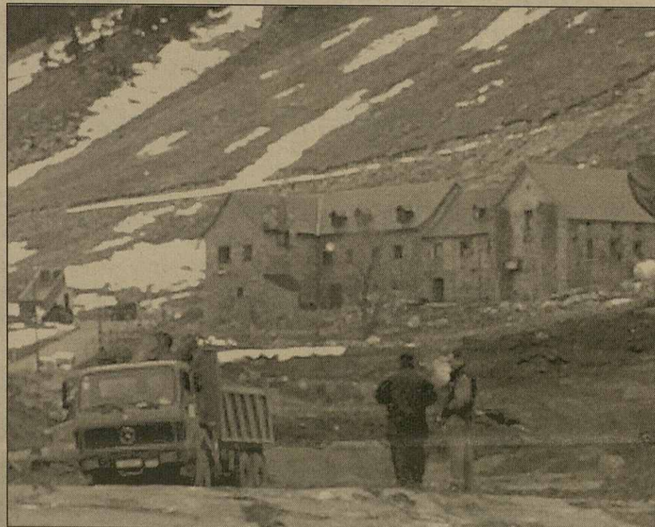
Se vò recuperar er entorn der Espitau entà parcatge de veïculs

torns, de manèra qu'es òbres se pòrten a tèrme es 24 ores deth dia. Per çò que hè as perforacions, se començaràn enes dus costat ara ora, e a despiet que non suposaràn cap de perill entàs veïculs qu'atrauessen er actua tunèl, es prumèrs mesi se talharà eth transit en sòn interior entà comprovà'c.