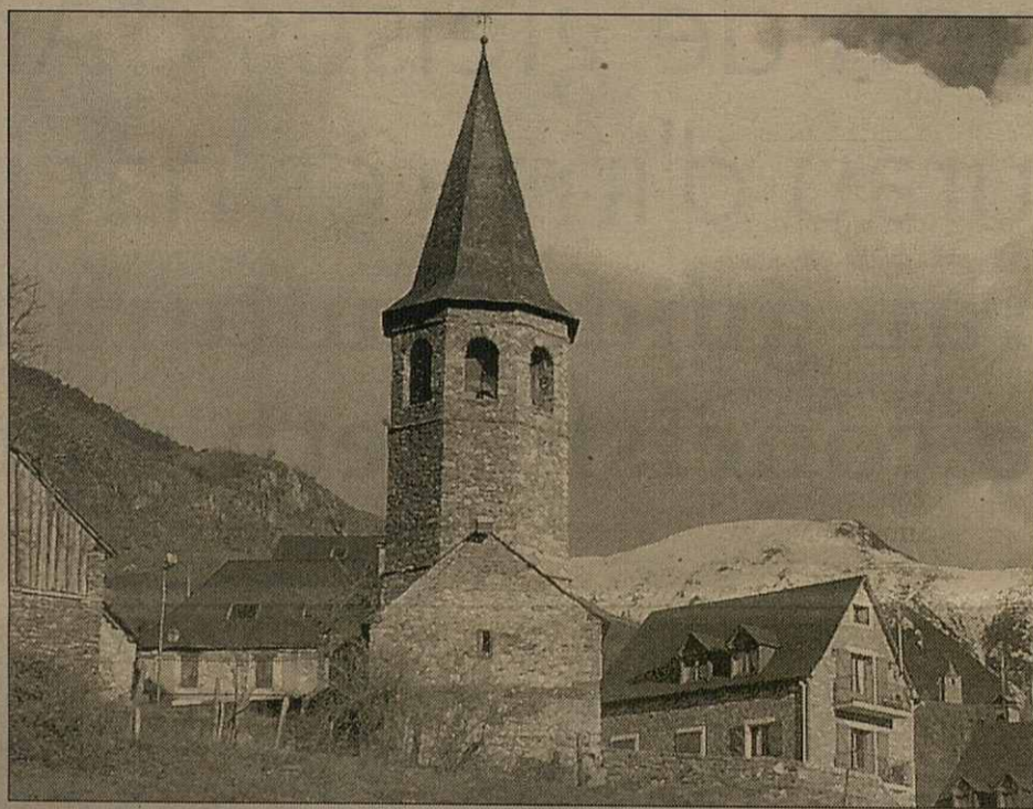
Es glèises romaniques araneses formen part d'un itinerari culturau

D'aguesta manèra, des de dijaus enquia deluns de Pasca, era ocupacion ei sus eth 95 per cent, en tot arribar ath plen totau en quauques zònes e establiments, coma es cases de pagés o es otèls des nuclis mès petiti. Per çò que hè as pistes d'esquí, es pogui mesi qu'a agut aguesta temporada d'iuèrn, amassa damb er imminent tancament de totes es estacions un viatge passada era Setmana Santa, hè qu'es responsables des empreses agen plan bones perspectives