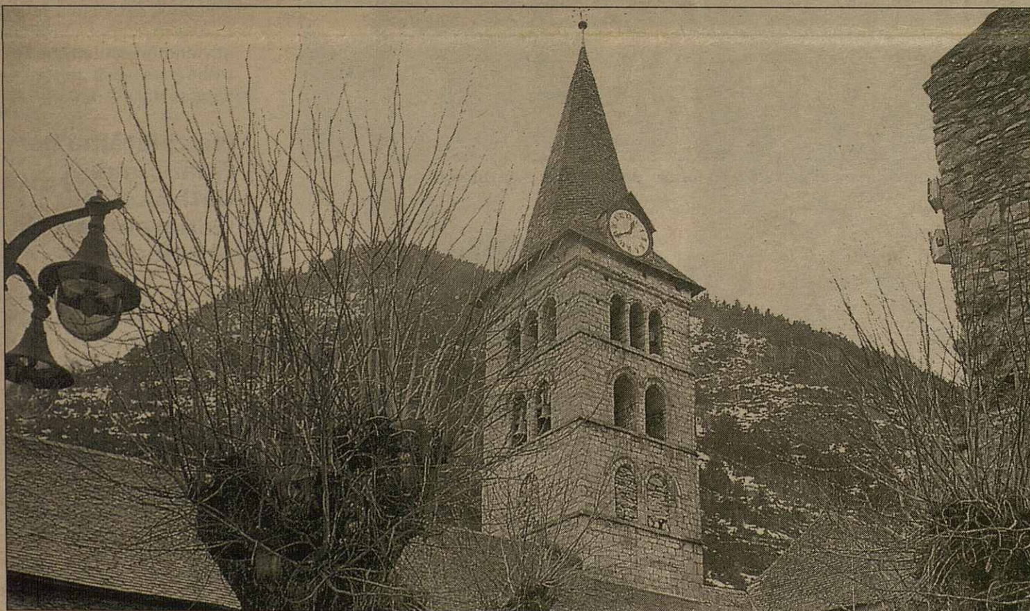
Santa Maria d'Arties ja a era declaracion de Ben culturau d'interès nacionau

plan redusit. Entath sindic "eth patrimòni culturau aranés a esdevengut un recors potenciáu que cau desvolopar, autan des dera vessant culturau coma des dera vessant toristica, ja qu'ua bona gestion deth patrimòni culturau a ua clara incidéncia ena sua dinamizacion social e