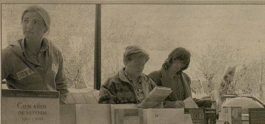
Ja ei tradicionau qu'era hèsta de Sant Jòrdi tanben se celèbre en Aran, per tant, tanben ei un bon dia entà qu'es joeni remassen sòs damb quauque objectiu. Mès es protagonistes, segontes mane era tradicion, son era ròsa e eth libre. Çò més remarcable, com tostemp, ei era pujada des prètzi d'aguesti articles.

arribat ath 2% urbanizable, e a més se mantien es nuclis istorics com tostemp a reivindicat era oposicion". Er alcalde deth municipi de Naut Aran, assegure que jamès se poderà construir enes parçans de Beret e Òrri per que s'an declarat de regim especiau. Per çò que hè ara Val de Ruda, en prumèr lòc se construirà eth telesèra e eth parcatge, eth quau s'ampliarà enquias 2000 places.