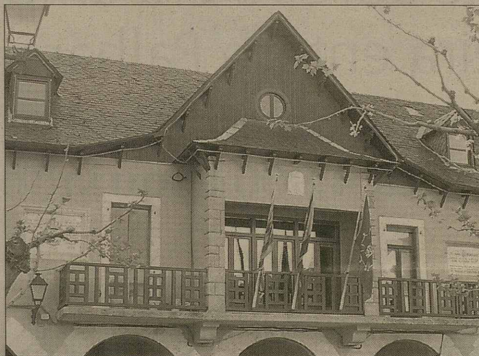
Er equip governant s'a retirat dera acusacion particulara

per mauversacion de hòns publics, e qu'auie presentat, enes sòns començaments, eth qu'ara ei er equip governant, e que ja s'a retirat en sòn paper d'acusacion particulara. Ditz Calbetó: "podia pagar e se non ac hi, ei perqué ac vedia un abús. De hèt era junta electorau non s'a prononciat jamès sus aquest ahèr".