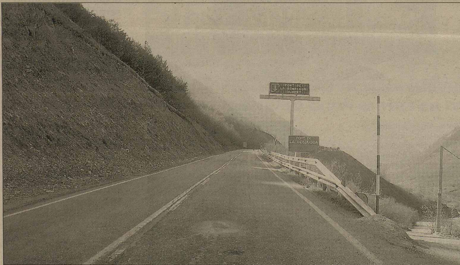
Eth Pòrt dera Bonaigua darà accés aht nau airau d'esquí

arturar era reünion dera Comission d'Urbanisme, e assegurèn que contunharien organitzant protèstes. Cau remarcar qu'era Conselheria de Mieï Ambient dera Generalitat ja auie redusit era afectacion ena zòna dera Val d'Àneu.