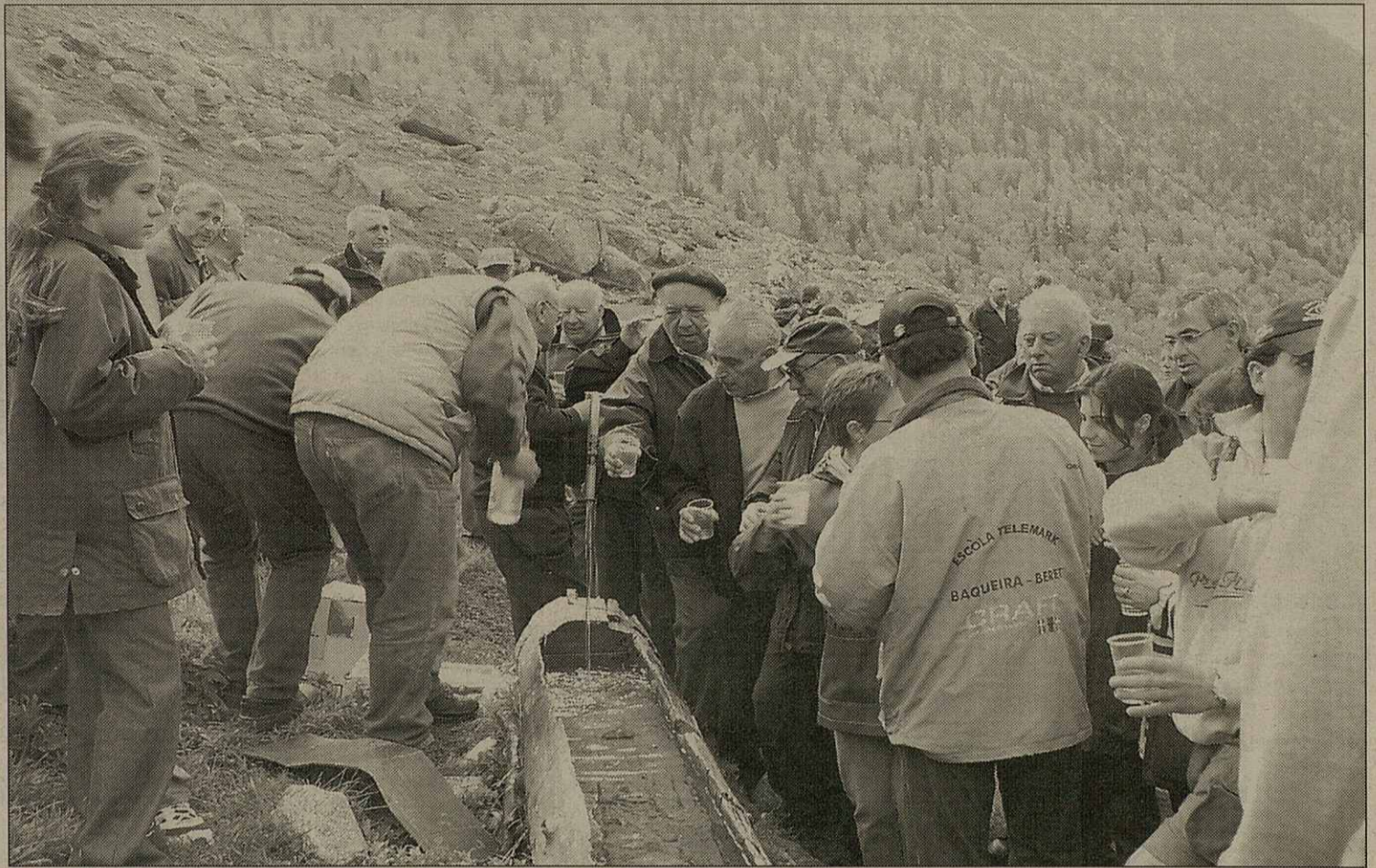
Eth repartiment deth pan tamb hormatge e d'anís tamb aigua ei tipic de fòrça romeires