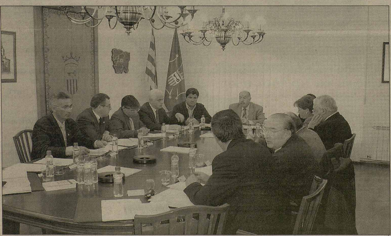
Eth Conselh Generau en Session Plenaria

Redaccion ARRÒS(MARCATOSA) Eth Plen deth Conselh Generau d'Aran, celebrèc ua session extraordinaria ena que s'aprovèc per unanimitat era adjudicacion dera primèra fassa des òbres d'ampliacion dera sedença deth Conselh Generau en Vielha. Era adjudicacion sigüec entara empresa Construcciones Balmosedo, de Madrid, per 582.134 èuros. Era construccion dera estructura e cubèrta deth nau edifici, se