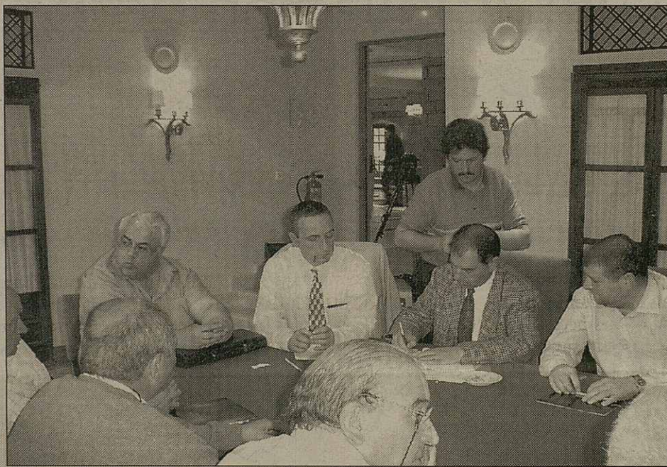
Toti es participants signèren eth document, excèpte CDA