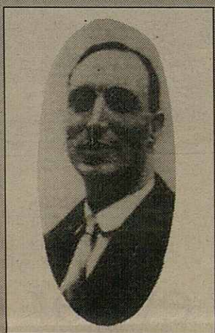
HISTÒRIA GRÀFICA DE LLEIDA