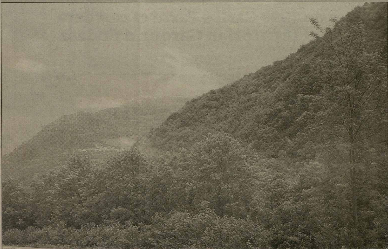
Eth pòble de Canejan vò gestionar eth sòn bòsc