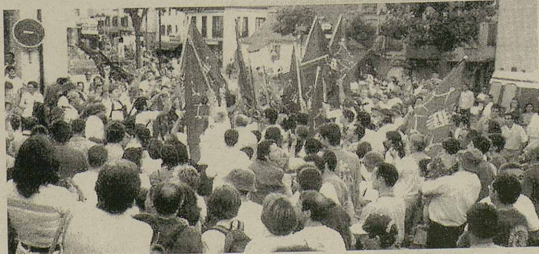
Era Corsa "Aran per sa lengua" arribe ara sua IX edicion. Era participacion ei cada an mès grana, e dempús de recórrer tot eth parçan en tot gèsser de Montgarri, Pònt de Rei e eth Pòrt de Vielha, s'amassen toti en Vielha, a on an lòc es parlaments, er autrejament deth prèmi "Lengua Viua" e era actuacion musicau.

Era iniciatiua vò que pendent tot er an, qui volgue conèisher es nòsti monuments, age era possibilitat de hec enes mielhors condicions possibles.