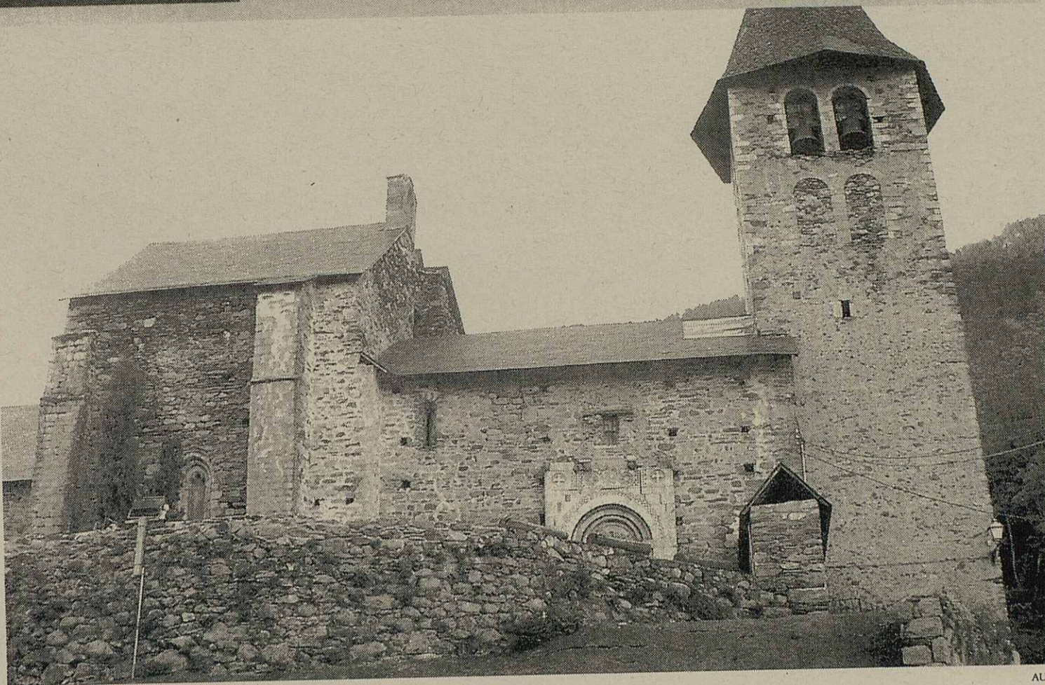
Detalh d'un capitèu dera portalada de Sant Pèir d'Escunhau