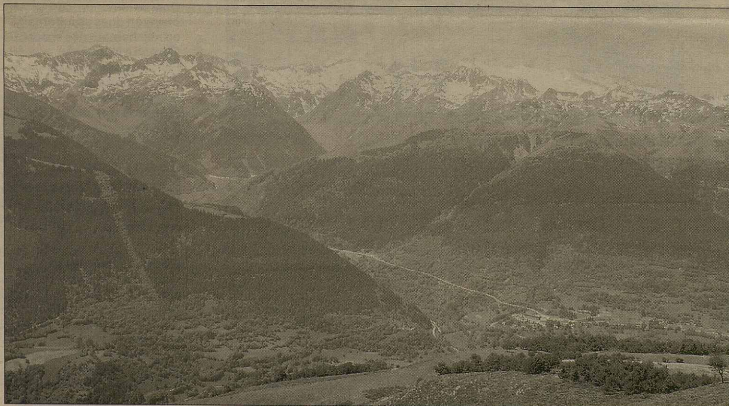
Es pistes de tota era Val d'Aran, demanen un mantenement contunhat

trams de pistes forestaus. Eth mantenement des conetes e meliores en varadatge, s'efectuarà en totes es actuacions. Ath delà se remplirà eth cauçadat tamb materiau graüt, e se meteràn proteccions