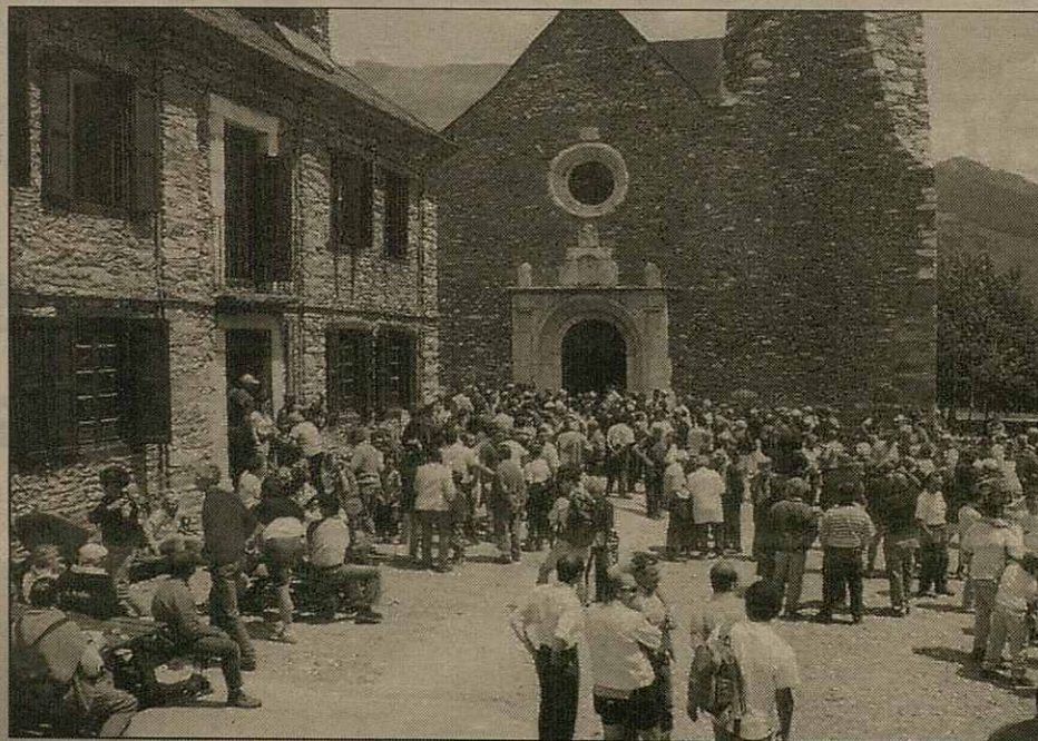
Es amics de Montgarri dèren vida, un an mès, ar antic pòble.

participacion de palharesi, ribagorçans e francesi ath delà des aranesi, ei tradicionau pera costum de portar es arramades de bestiar a pèisher enes montanes de Montgarri e de Beret. Tanben en despartiment deth pan damb hormatge e deth vin i collabòren es parçans vesins, ja qu'es francesi pòrten eth hormatge, e es d'aci, eth pan e eth vin. Açò ac hègen, dejà, temps tà darrèr, es pastors en arregraiment pera utilizacion