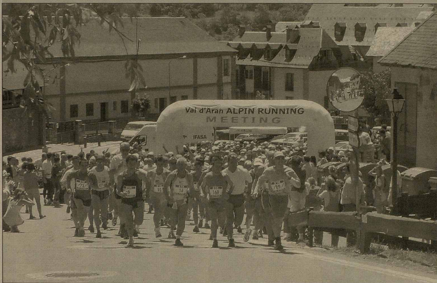
Es atletes dera Alpin Running Meeting, anaràn de Salardú enquia Vielha en tot passar peth Maubèrme