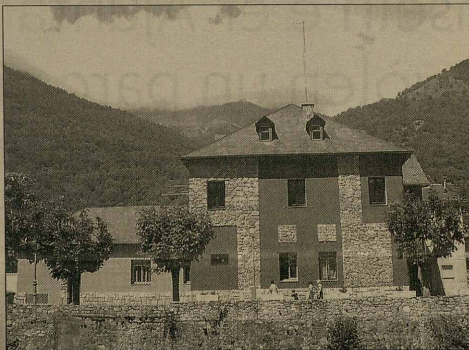
Er Ajuntament de Les a estat remodelat en prigondor

S'an abilitat burèus que permeten diferenciar departaments com es servicis socials, eth jutjat e es pròpris der Ajuntament. Era sala dera planta baisha s'a premanit entà poder-i celebrar actes coma exposicions, nòces civils o amassades. Era sala d'actes s'a daurit ath carrèr e s'a ampliat. Eth humarau s'abilite coma archiu foncionau des documents enquiath sòn traspàs ar Archiu Istoric d'Arròs.