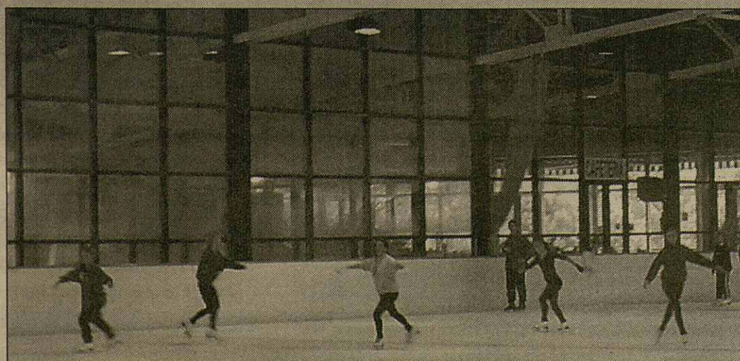
Es equipas de competicion que se concentren ena Val d'Aran avaloren es installacions esportives que pòden emplegar, ath delà dera pista de gèu. Equipas de Paris, Madrid, Toulouse e es competidors internacionaus dera equipa catalana premanissen era sason luenh der entorn abitau

placen es quilhes en tres rengs de tres, e tamb eth tacon (bòla irregulara de husta) se hèn a quèir eth maxim nombre de quilhes possible. Ena segona, se placen es ueit quilhes en tot entornejar era quilha de cap redon o quilha "nau" e se pòt tirar era deth miei o es ueit deth torn en tot deishar dret eth "nau". Es quilhes les a hètes Gabriel Vidal, de husta e en tot seguir eth modèl des que se tiegen abantes.