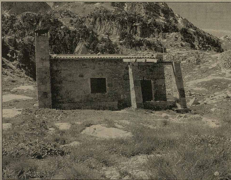
Eth plaçament deth vielh refugi de Colomèrs ei a on se bastirà eth nau equipament

Conselh Generau vò completar es melhores substanciaus dera qualitat des servicis des refugis de nauta montanha. A començament der ostiu, eth Conselh negocièc tamb era empresa Fecsa, propietària des refugis de Restanca, Saboredo e Colomèrs, era titularitat des madeishi entà poder actuar enes installacions e atau dotar-les de totes es mancances existents. Per aute costat, era comission provincial d'Urbanisme aprovarà, eth 25 de seteme, eth projecte deth nau refugi de Colomèrs.