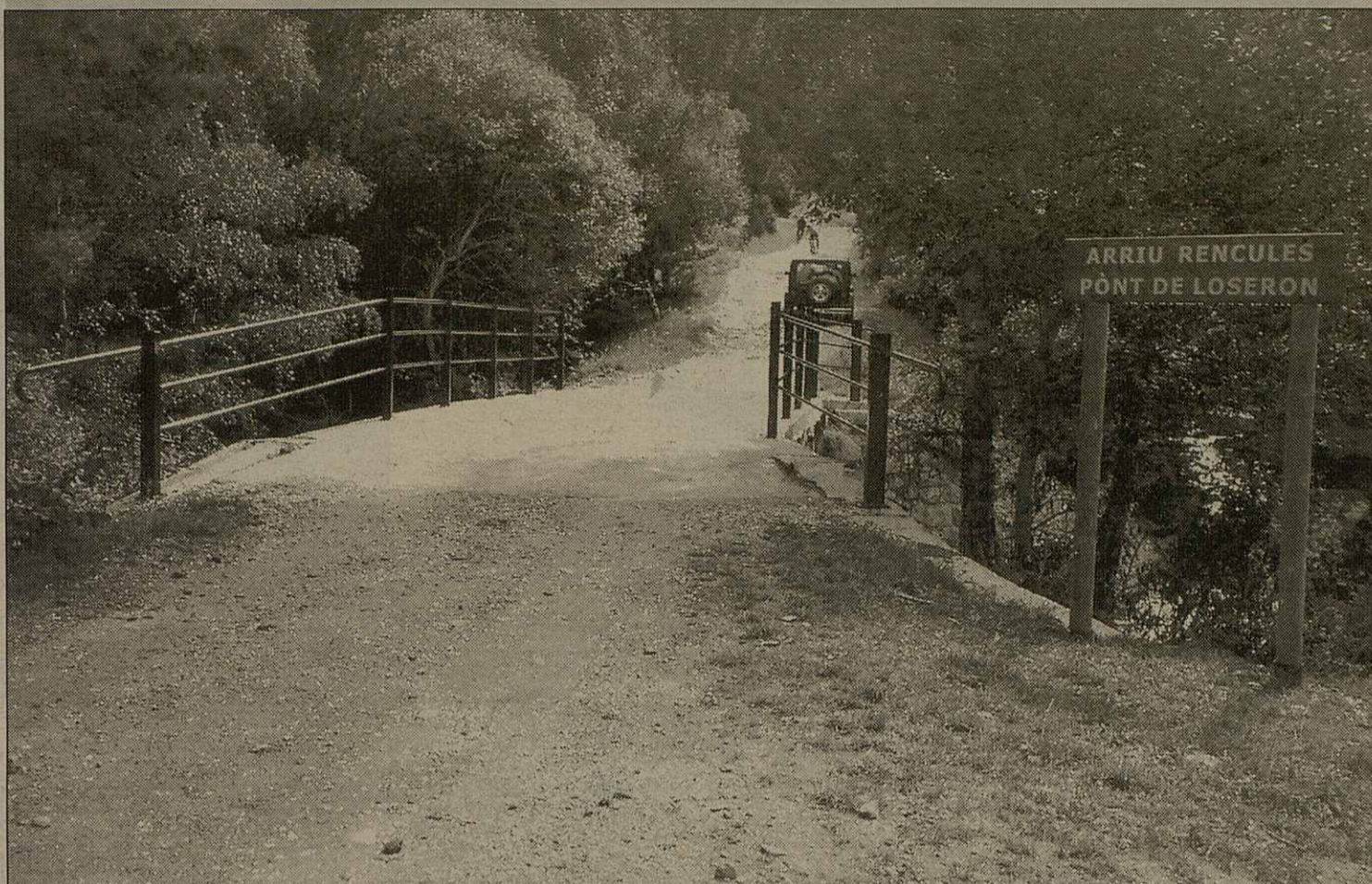
Eth pònt de Loseron permetís trauessar er arriu Rencules