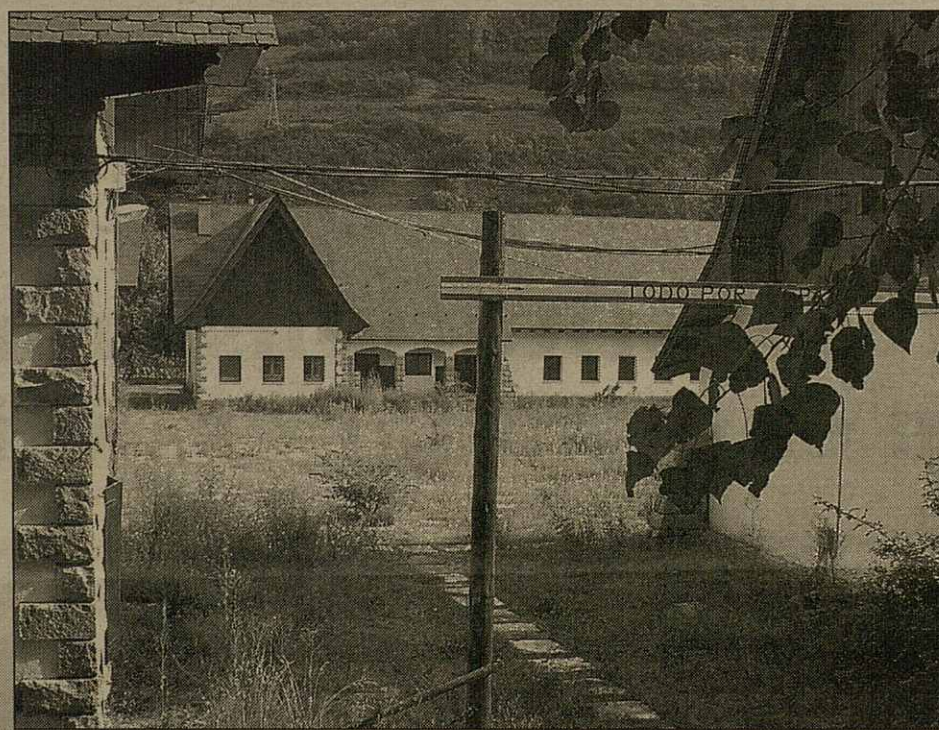
Vista parciau dera antiga casèrna militar de Vielha

compause d'un totau de 26.000 mètres quarrats des quaus sonque 3.025 seràn urbanizables, en tot qu'es auti seràn de domeni public. Segontes eth plan parciau presentat per Ajuntament de Vielha, en aguesti 23.000 mètres quarrats se i bastirà ua zòna verda d'uns 15.550 mètres quarrats, ua plaça publica de 302, ua auta d'equipaments, tanben de 3.025 mètres quarrats, e un passeg fluviau d'uns 1.600 mètres quarrats. Er autrejament dera zòna dera casèrna militar de Vielha siguec concedit eth passat mes de junh ar Ajuntament de Vielha-Mijaran, dempús qu'aguest presentèsse eth plan parciau ara