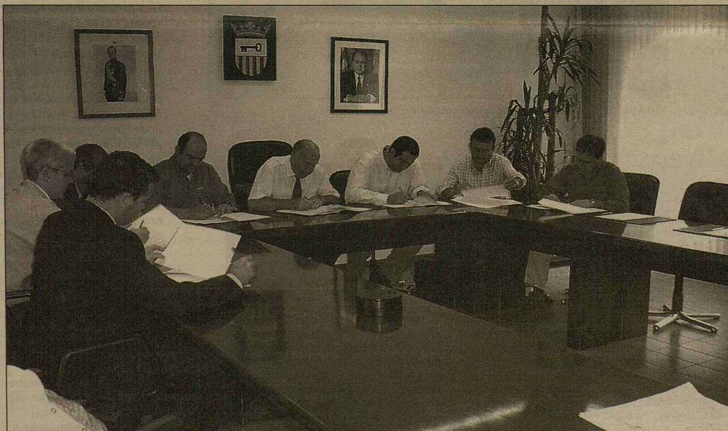
Er acòrd se signèc ena sedença deth Conselh Generau d'Aran entre es disparières institucions araneses.