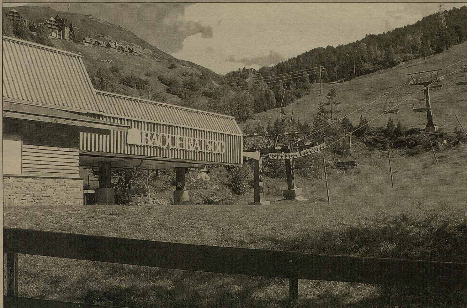
Era estacion d'esquí de Baquèira Beret a previst méter en foncionament pendent aguesta sason es nau remontadors deth Pallars.