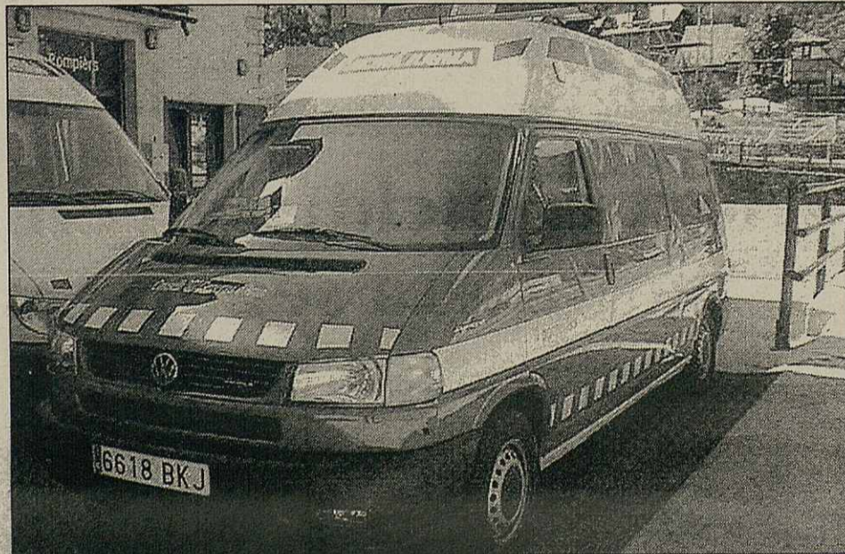
TESVA gestione eth transpòrt sanitari e d'emergéncias

contracte “non se prorogarà entad 2004 per'mor qu'era volentat deth Conselh Generau ei auançar en un modèu sanitari integrau damb eish vertebrador ena prestacion sanitària de magèr qualitat entàs ciutadans”. Barrera higeç qu'era unenca manèra legau d'amia'c a tèrme ei en tot iniciat era rescission deth contracte damb era Aliança tà dempús poder crear ua empresa publica de gestion sanitària, que se regisque peth dret mercantil, aperada Aran