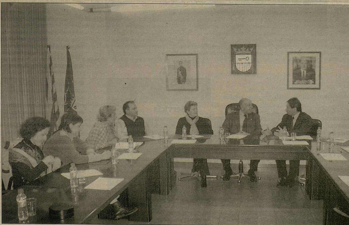
Eth Sindic d'Aran presidic era amassada damb eth Delegat d'Ensenhament