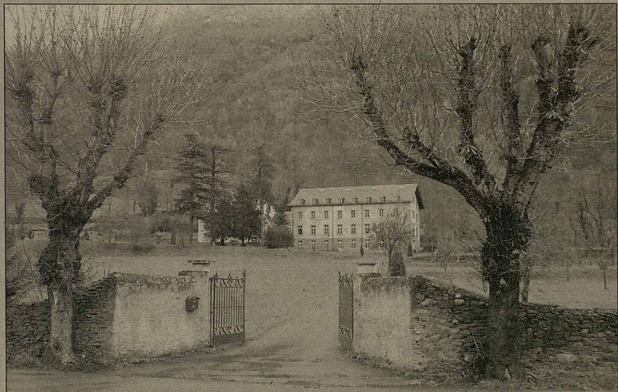
Imatge dera Baronia de Les