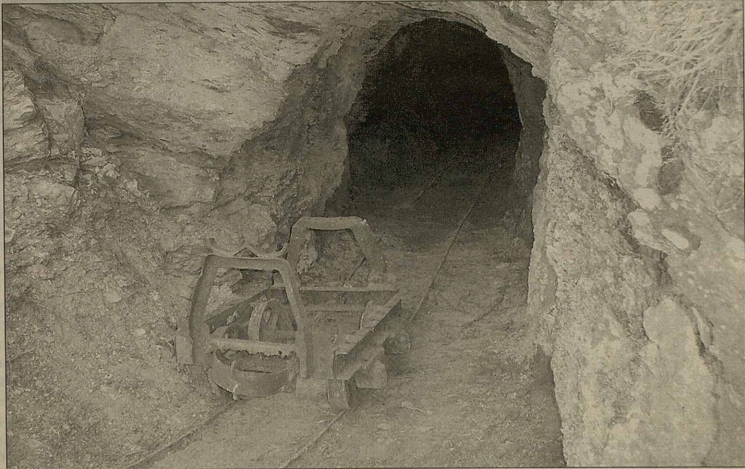
Es mines Victòria s'includiren laguens des inversions deth Plan d'Excellècia Toristica