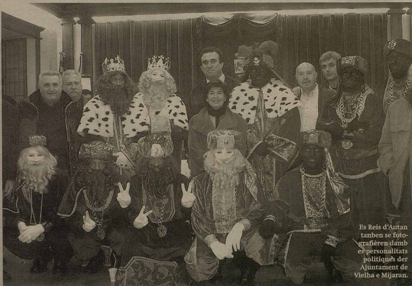
Es Reis d'Autan tanben se fotografièren damb es personalitats politiquès der Ajuntament de Vielha e Mijaran.