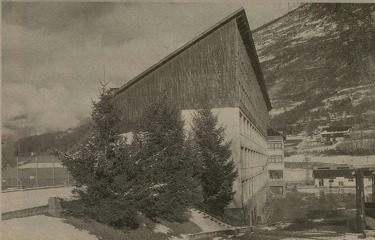
Es escolans de 6au d'EP deth CRIP Garona de Vielha receberàn classes d'esquí toti es dimèrcles enquiath mes d'abriu