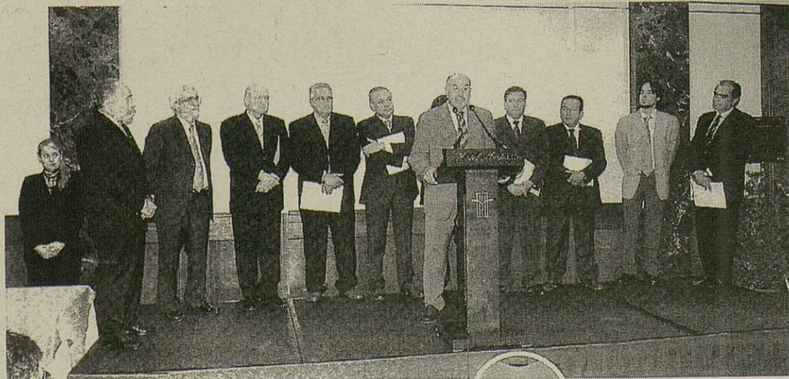
Era darrèra setmana en Barcelona, er Institut Catalan d'Energia (ICAEN) deth Departament de Trabalh, Indústria, Comèrc e Torisme autregèc ath Conselh Generau, damb motiu dera XIIIau edicion des prèmis ICAEN, eth prumèr prèmi as institucions per estauvi e eficiència energetica.

damb es madeishi punts qu'eth CF Magraners, mès damb eth gòl average a favor, çò que hè qu'eth darrèr partit sigue plan important per'mor qu'ua victòria supausarie er ascens tara categoria de 2au regionau. Tant es jogadors coma era Junta Directiua conviden a toti es sòcis, collaborators e simpatizants a animar e, damb un shinhu de sòrt, a celebrar era victòria e er ascens.