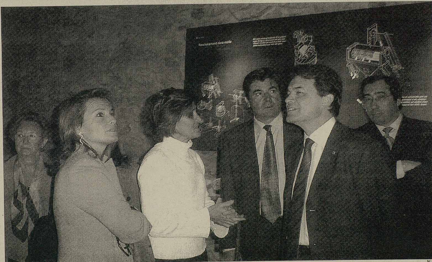
Eth Conselhèr dera Generalitat Artur Mas visitèc era Val d'Aran era passada dimenjada

Eth cas ei qu'es vesins son preocupadi per augment de trànsit que provocarà eth nau tunèl de Vielha.