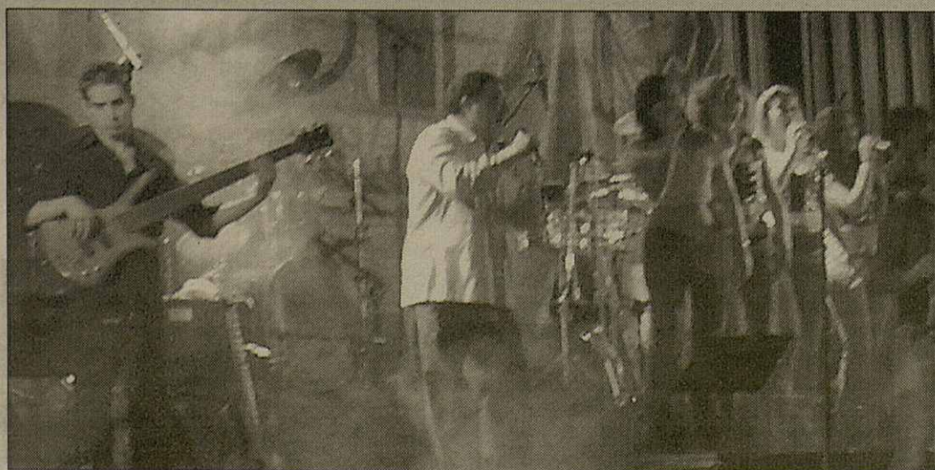
Dijaus passat, era orquèstra "Era Tribu e Santi Arisa" presentèc en Salardú eth CD "Aran un país" compausat per 13 cançons tradicionaus araneses. Aguest trabalh, qu'a compdat damb eth supòrt deth Conselh, amasse pèces dera tradicion musicau aranesa armonizada damb ritmes modèrns.

installacion d'aguest tipe ei fòrça important per'mor qu'ajude a promocionar eth Baish Aran". Eth Conselh, pera sua part, harà avient ar orari des termes un servici de transport public entà qu'aguestes personas de mès de 60 ans poguen gaudir d'aguest convèni. Atau madeish, eth Conselh facilitarà eth transport as joeni e se meterà en contacte damb er Institut entera organizacion des grups.