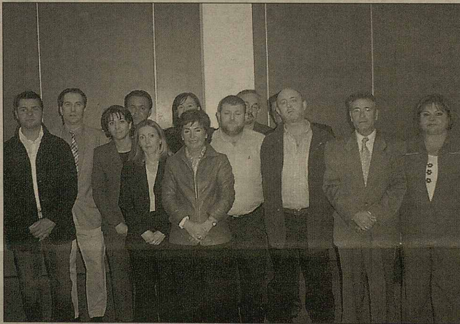
Amassadi per Aran presente listes tàs ajuntaments e tath Conselh