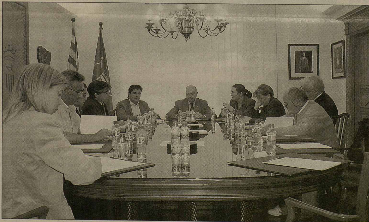
Darrèr plen dera legislatura celebrat ena Casa deth senhor d'Arròs

eth Departament de PTOPE e eth govèrn aranés entà actuacions especificas de montanha pendent eth periòde 2002/2003. Agust ahèr consistís en mèter en foncionament era dusau fasa de melhora des accèssi as nuclis