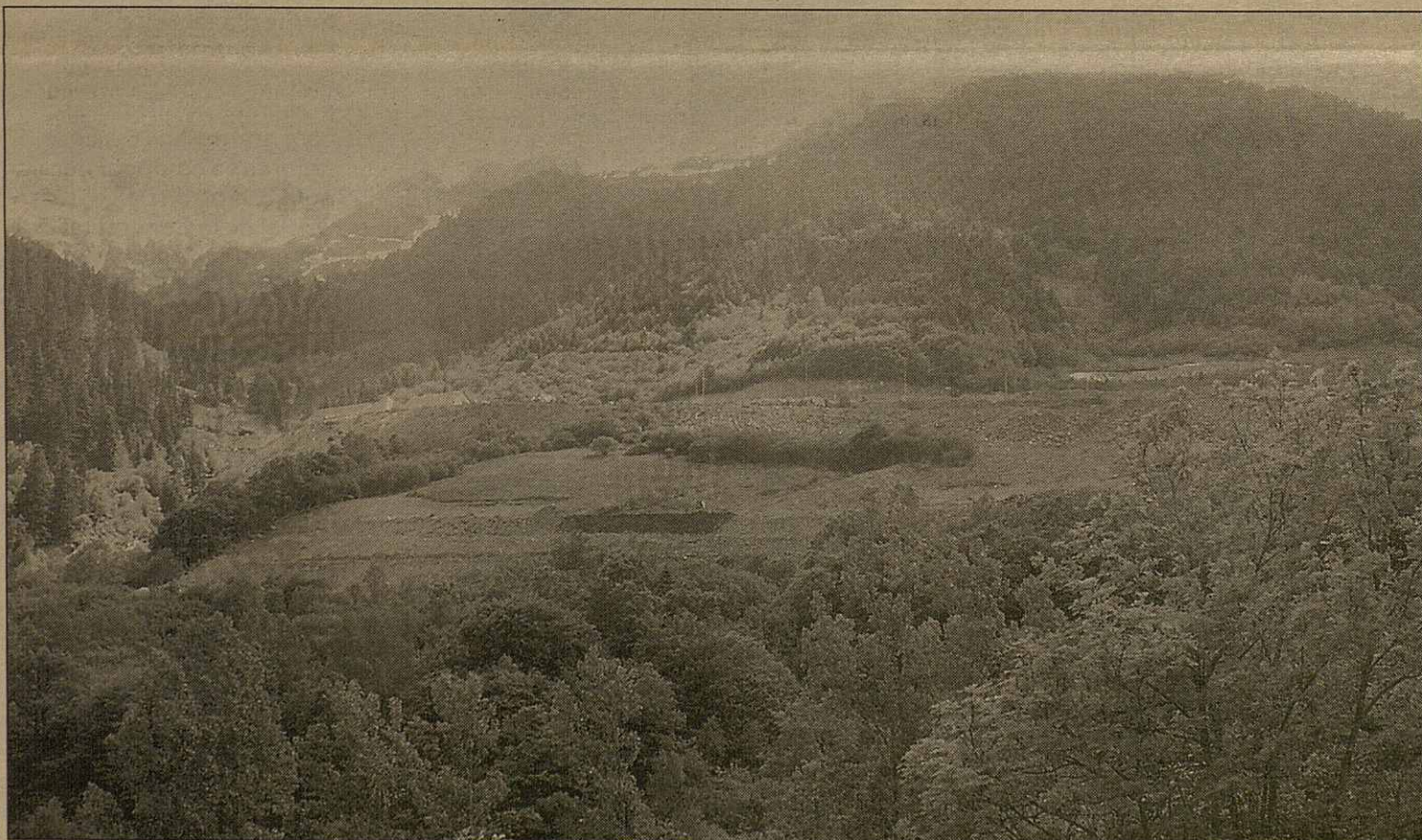
Estat actua des òbres dera boca nòrd deth tunèl de Vielha

naut tonatge qu'actuaument circulen per aguest tram e qu'un còp bastit eth nau tunèl de Vielha se veirie agranir considerablament. Cau dider, qu'era darrèra setmana eth Ministre de Foment, Francisco Alvarez Cascos, contactèc