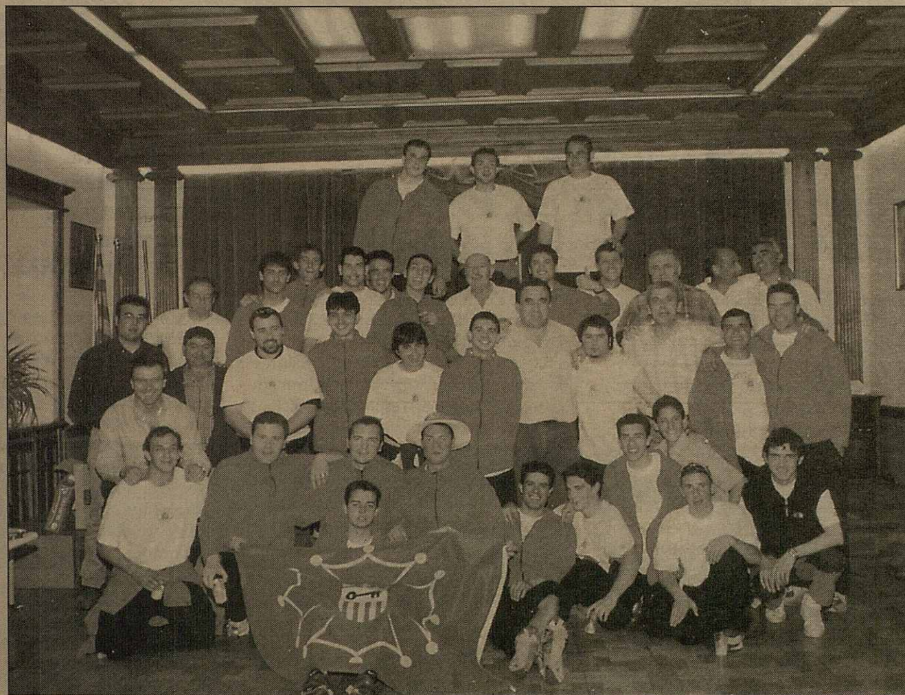
Toti es jogadors deth C.F.Vielha anèren entar Ajuntament de Vielha e Mijaran tà celebrà'c