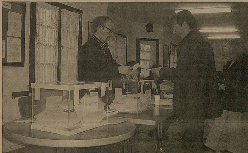
Eth Casau deth Jubilat de Vielha enguan tanben siguec mesa electorau

■ Era participacion des ciutadans aranesi en aquestes eleccions a acreishut respècte ara der an 1999 en tot situar-se ath torn deth 75%. Era jornada de dimenge passat siguec dominada peth mau temps, cau díder que pendent tot eth dia ploiguet e era nhèu siguec presenta enes còtes mès nautas. Ua des anedòtes deth dia susyenguet en Vilamòs quan un des vesins tot e auer votat per corrèu ac tornèc a hèr ena mesa electorau. Atau madeish, es vesins de Vielha acostumats a votar tostemp en Collègi Garona, enguan se trapèren damb qu'er arriu Nere partie eth pòble en dues zònes, es uns aueren de votar en Casau deth Jubilat e es auti en Collègi coma tostemp.