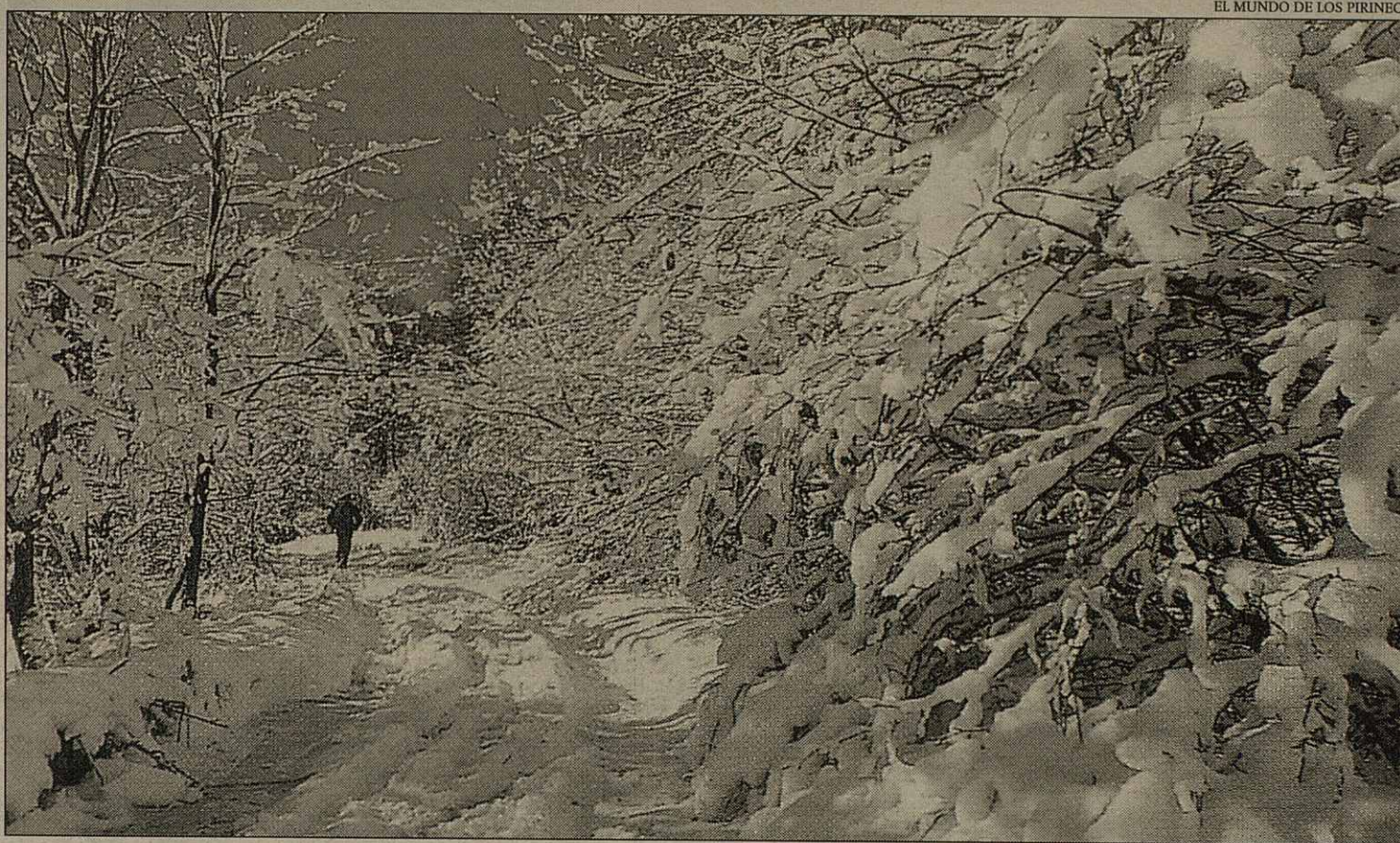
EL MUNDO DE LOS PIRINEOS