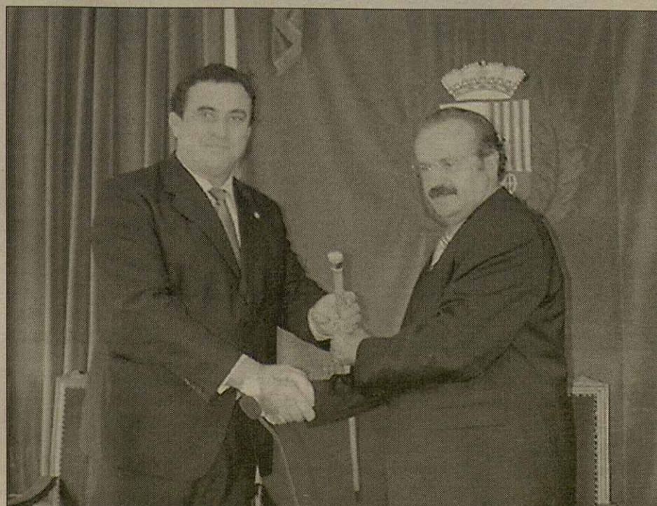
Era sala de plens der Ajuntament acuelhec era constitucion dera naua corporacion

Per un aute costat, eth nau alcalde reiterèc, ena sua prenuda de possession, era aufèrta de collaboracion ara rèsta de grops politics trigats pes ciutadans de Vielha e Mijaran entà trabalhar amassa en un projecte tà