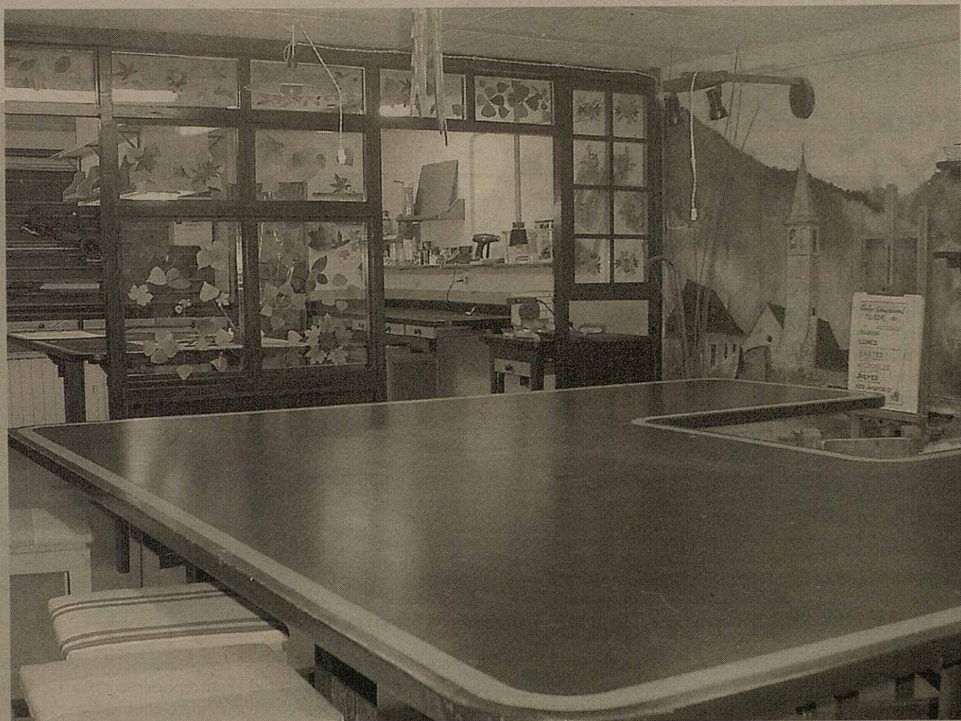
Es intallacions d'aguest centre son placades en oligon Industriau de Vielha e Mijaran