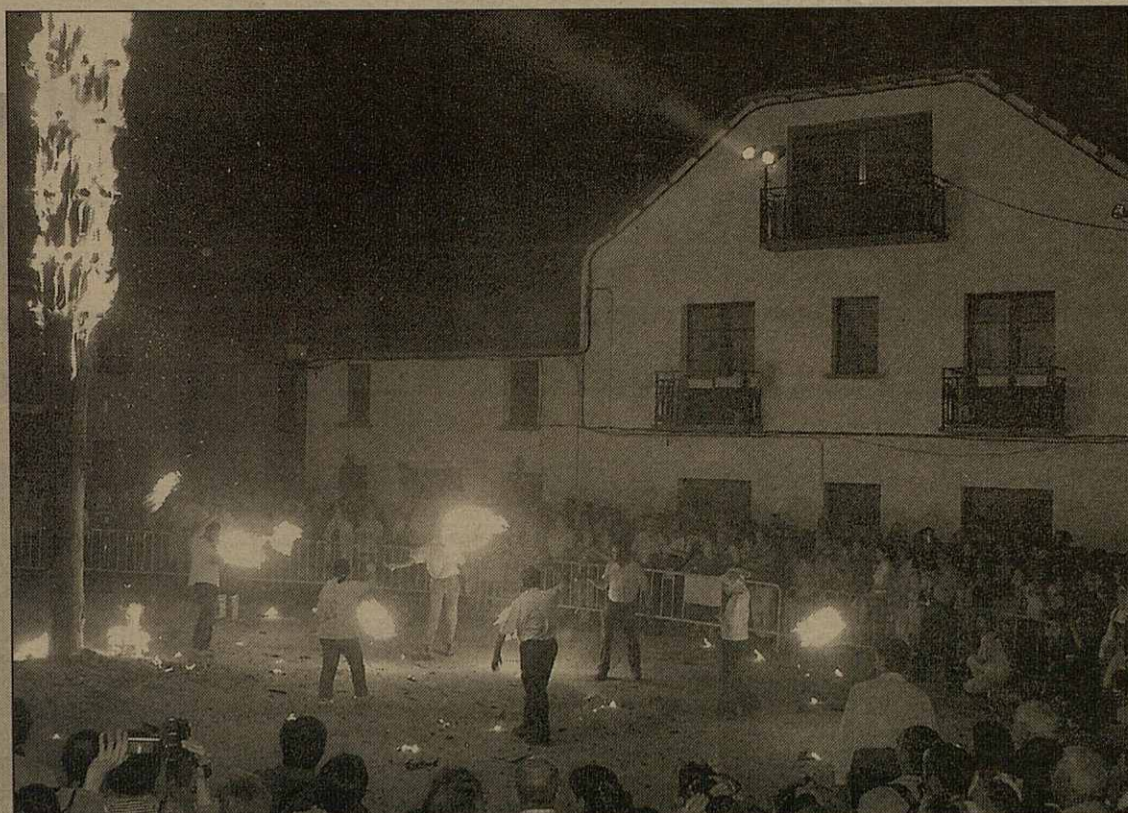
Eth grop, es Corbilhuèrs de Les, amenizèc era Hèsta de Sant Joan damb dances tradicionaus araneses