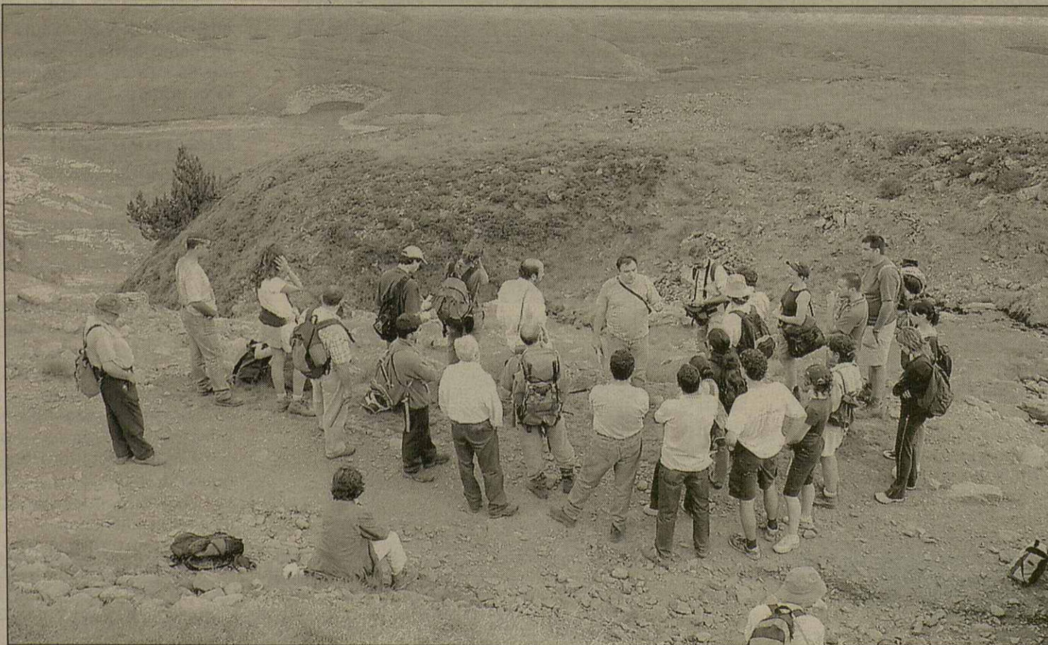
Aguesta amassada acorropaue un seguit d'excursions entà poder estudiar eth patrimòni minaire e geologic dera Val d'Aran

d'investigadors que trabalhen en aguest ahèr, atau coma ua taula redona sus eth patrimòni minaire e geologic laguens d'un desenvolupament sostenible e ua Assemblada dera Comission de Patrimòni Geologic dera Societat Geologica d'Espanha.