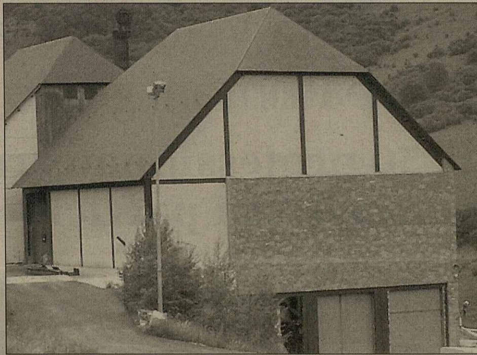
Era planta incineradora ei plaçada en boca nòrd deth tunèl de Vielha

ei solvent a nivèu tecnicoeconomic e se n'ei lo prepausará e lo portará tath plen deth Conselh Generau. Fin finau aguest èster decidirà se l'adjudique o non. Cau d'ider qu'es empreses participaires entàs trabalhs de reforma dera planta incineradora son FCC, Isolux, UTE COMSA-EMTE e UTE SUFI-OMICRON.