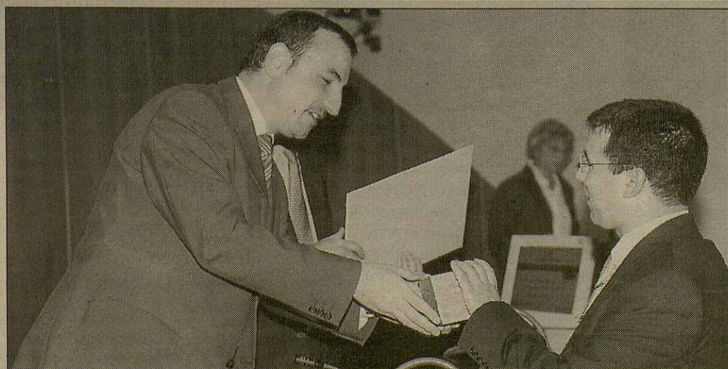
Eth tecnic de Gestion de Residus recuelhec eth prèmi ena Auditoria dera Generalitat de mans deth Conselhèr Espadaler. Atau madeish, eth govèrn aranés vòu arregrair aguest prèmi ara importanta participacion ciutadana, atau coma tanben ara de toti es professionaus dera ostalaria

Cau remarcar qu'eth Departament de Patrimòni Culturau deth govèrn aranés recomanèc ath propietari dera bastissa respèctar toti es componets artistics e culturaus atau coma emplegar es materiaus tradicionaus damb es quaus se bastic era casa, degut ara sua condicion de Ben Culturau d'Interès Locau.