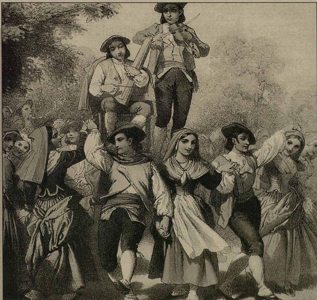
Vestits tradicionaus deth sègle XIX a on se pòden observar totes es pèces que les constituïssen