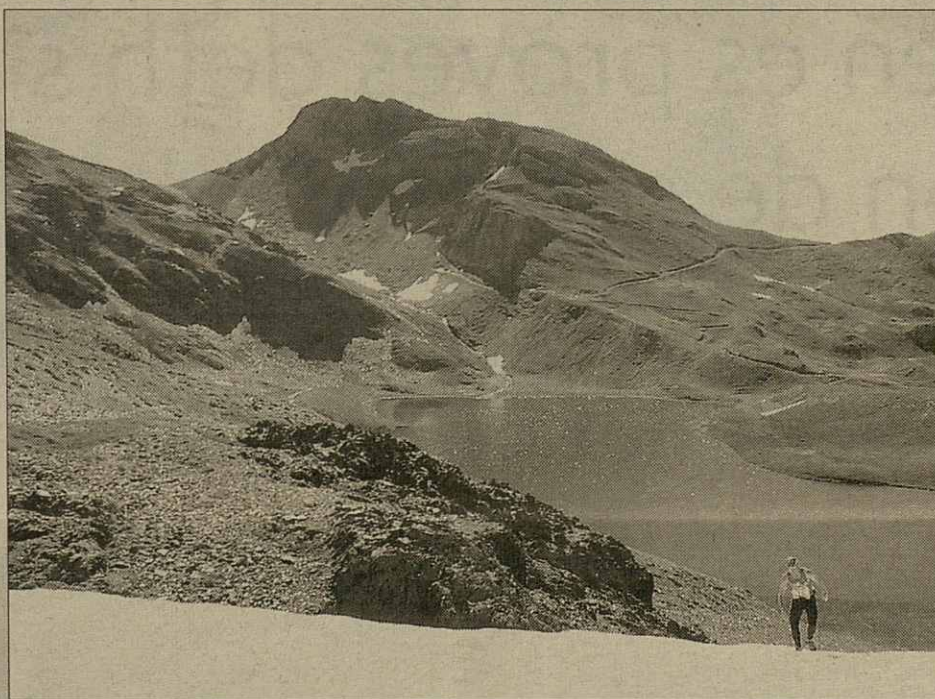
Era Alping Runnig Meeting passèc est'an passat peth lac Montoliu

marathons de 21 quilomètres e ua X-Marathon de 42 quilomètres. Era Alping Runnig Meeting gesserà de Salardú e arribarà en Vielha en tot auer en compde qu'es participaires auràn d'esvitar totes es dificultats que trobaràn ath long des recoruts a traüers de bòsqui e montahes deth parçan. Aguesti itineraris son desparièrs, eth dera mieja marathons ei mès accessible pr'amor d'auer mens dificultat e eth dera marathons ei mès tecnic. Eth desnivèu qu'an de superar es participaires pendent eth recorrut ei de mès de 2.100 mètres, e era mitat dera pròva trascor peth dessús des 2.000 mètres, çò que la