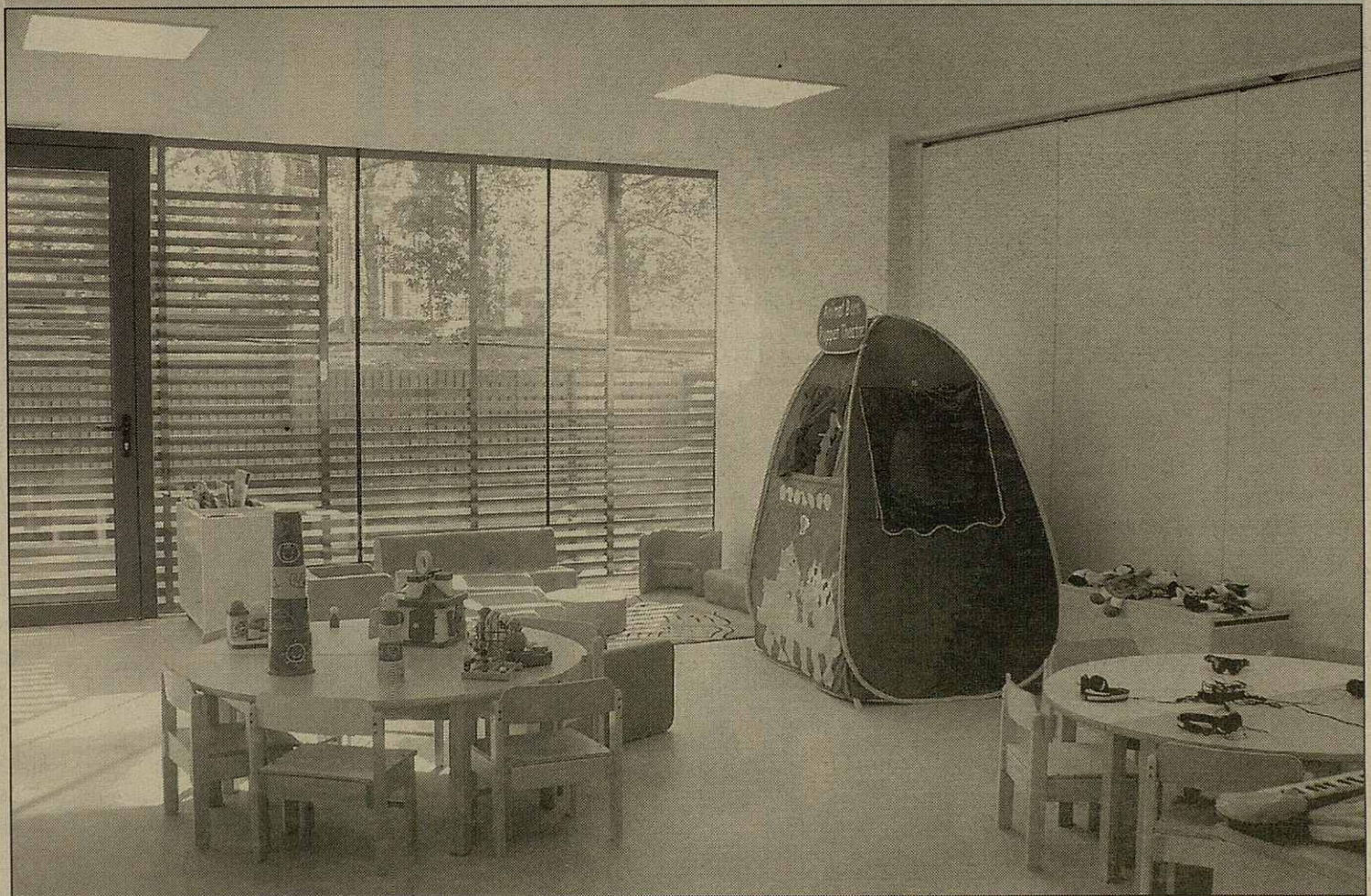
Aula dera naua Escòla Mairau plaçada ena Avenguda Garona d'Eth Solan de Vielha