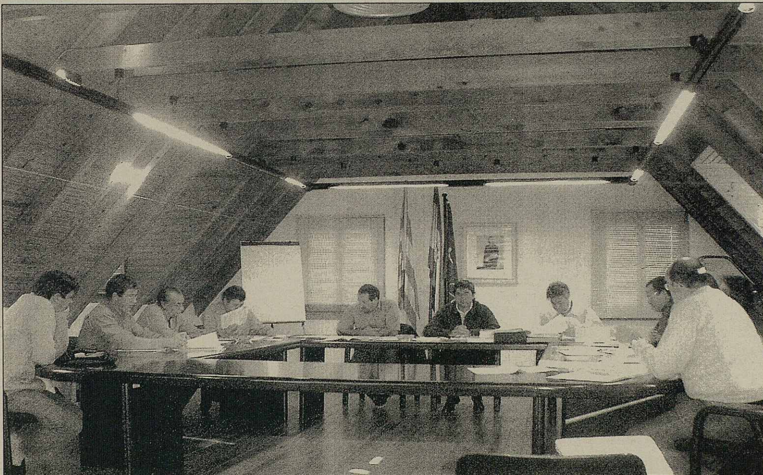
Era sala de plens der Ajuntament deth Naut Aran damb era equipa de govèrn