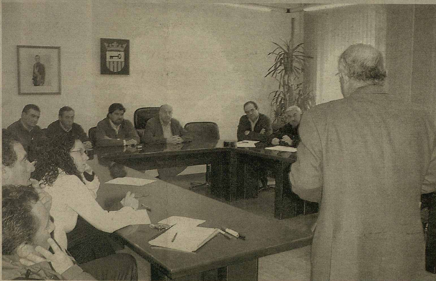
Dempús dera pana deth dia 29 de deseme representants politics e afectats s'amassèren damb era companhia Endesa