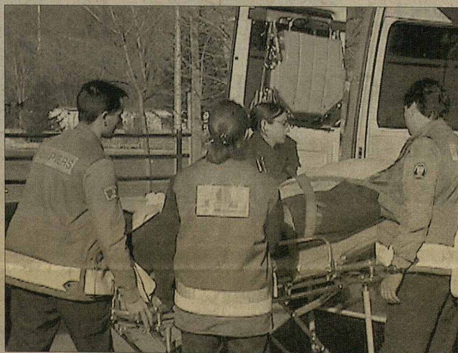
Eth Servici Primari amie era equipa medicau enquias lotjaments o accidents

se compden es gessudes tà dehòra deth parçan. "Era donada mès subergessenta ei qu'auem medicalizat eth 40% des servicis damb gessuda dera USVA (Unitat de Supòrt Vitau Auançat). Abantes aguest servici non existie, medicalizar-lo supause ua assisténcia dehòra der Espitau damb personau medic (un mètge e un infermièr)", hígec Cardènes. TESVA ena actualitat dispause d'ua Unitat de Supòrt Vitau Basic formada per tecnicos