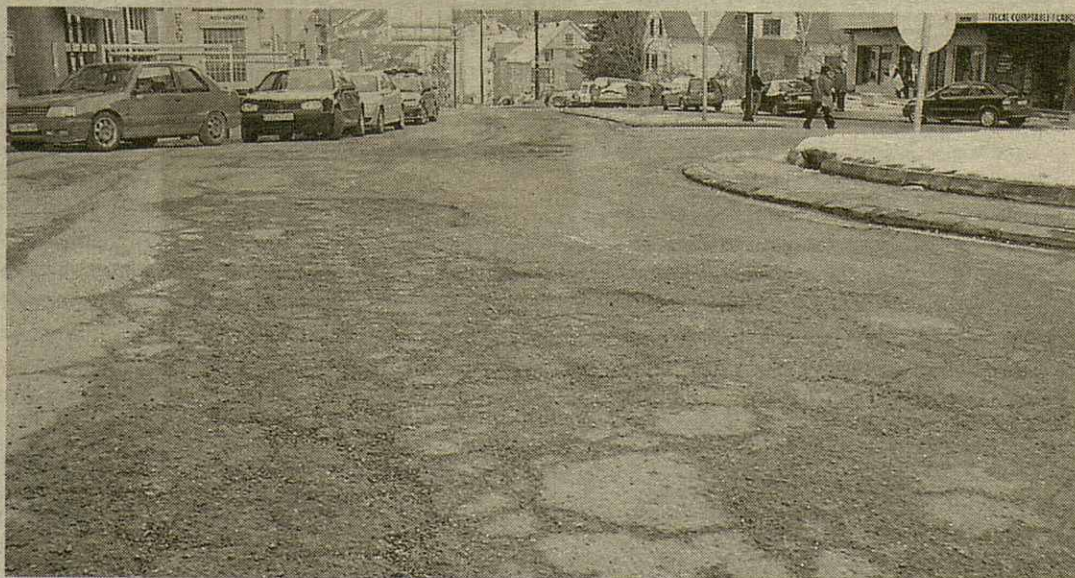
Era carretèra N-230, ath sòn pas per Vielha, presentaue horats d'enquia 20 centimètres de hons en quauqui punts que dejà an estat apraiats.

existents enes carretères araneses. En cas dera C-28, cau híger era arturada des trabalhs pr'amor deth mau temps, qu'an deishat era via entre Vielha e Vaquèira en un estat penible, qu'a ajudat a agranir era fatidica situacion viscuda en aguestes hèstes. Eth Conselh Generau a demanat ath Ministèri de Foment qu'er adobament dera N-230 sigue imminent.