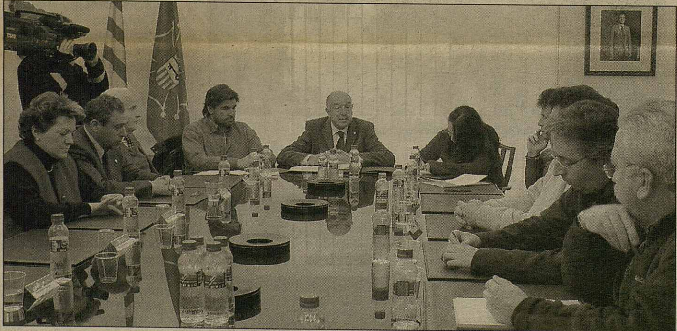
Eth plen se celebrèc dimars ena sedença deth Conselh Generau en Arròs

Era ampliacion dera estacion iuernau peth Salient e Varradòs possible solucion entà descongestionar es accèssi actuaus tà 1500