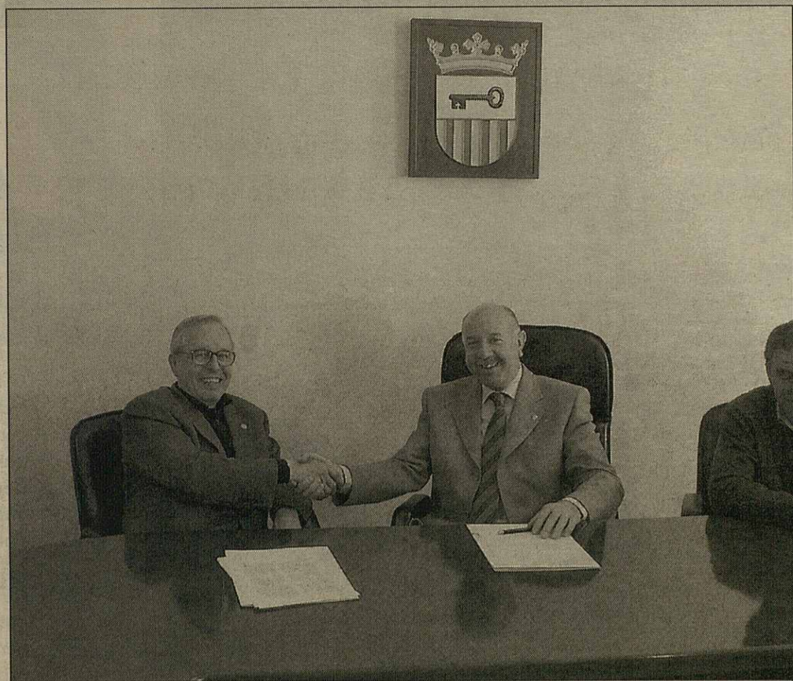
Era signatura se hec ena sedença deth Conselh en Vielha