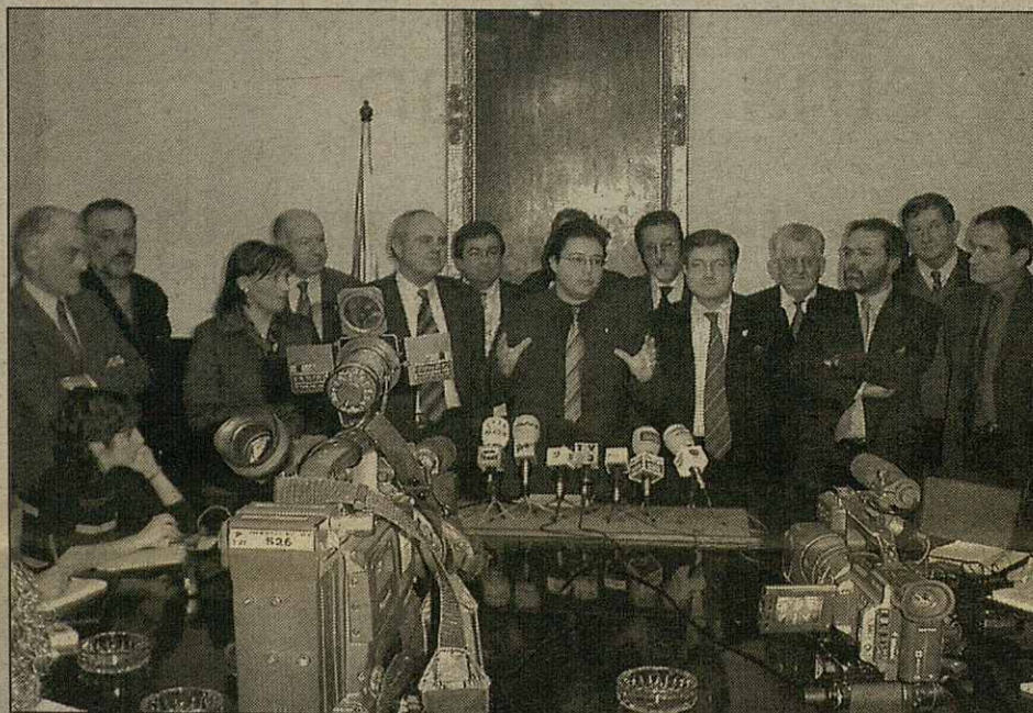
Es presidents des Conselhs de Lhèida s'amassèren ena Deputacion