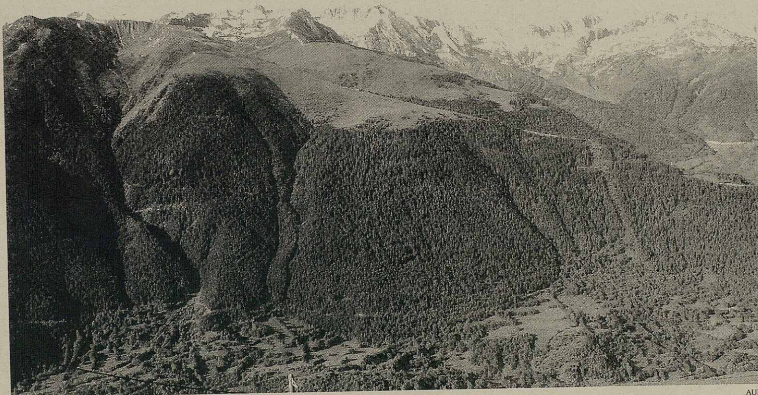
Era Tuca vòu èster era solucion entara massificacion d'esquiaires en Aran