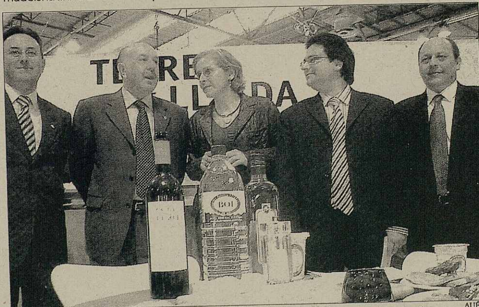
Torisme Val d'Aran se trapaue laguens deth stand de Torisme de Catalonha

promocion toristica tanben hec a conèisher era Val d'Aran coma destinacion toristica esportiu de Catalonha atau com era Q de qualitat que ben lèu receberà era Oficina de Torisme de Vielha.