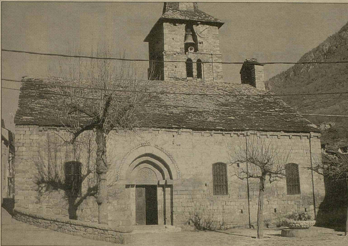
Glèisa dera Mair de Diu dera Purificacion de Bossòst

Era Generalitat de Catalonha estúdie era possibilitat de crear ua naua via entà accedir tara localitat de Canejan entà esvitar eth pas per zònes der ombrèr e perméter atau ua establa accessibilitat ath nuclèu. Eth Departament de Política Territorial e Òbres Publiques analise ena actualitat melhorar er accés tath municipi en tot auer coma prumèra opcion eth profitament deth traçat existent en tot hèr diuèrses meliores ena amplada e enes marrècs dera carretèra. Era auta opcion contemple un nau traçat que comportarie un impacte