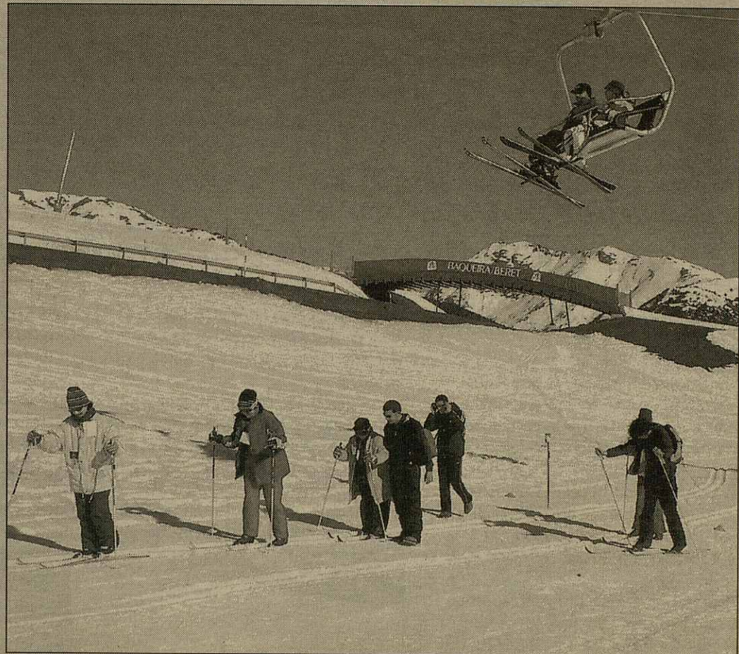
Era estacion d'iuèrn de Baquèira Beret a estat eth scenari de diüerses activitats fisicoesportives organizades, per dusau an consecutiu, pes Cicles Formatius d'Espòrts promoiguts per IES d'Aran e er ASPROS de Lhèida. Damb aquestes activitats se vòu sensibilizar as alumnes sus era problematica que presenten es persones damb ua discapacitat psiquica e conscientizar-les que, maugrat tot, pòden hèr quina activitat que sigue. Atau donques, poderen realizar desparières activitats ena nhèu, coma esquí de hons, corses damb raquetes de nhèu, gymkhanes e jòcs tradicionaus de tota era Val d'Aran

administratiu o ben se resòlv er ahèr pera via penau. Eth Conselh Generau, responsable des competéncias de Medi Ambient en parçan, estudiarà un còp coneishudi es resultats se presente denóncia.