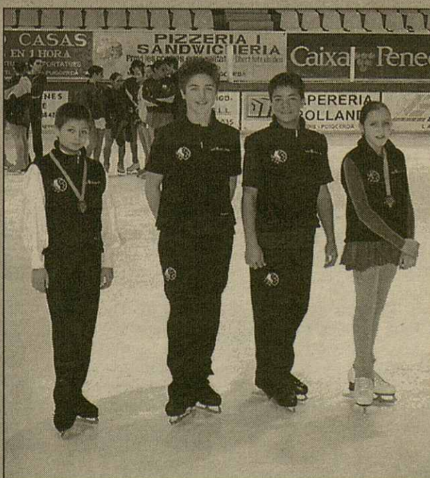
Eth CEGVA participèc ena 3au. pròva dera XIIIau Liga