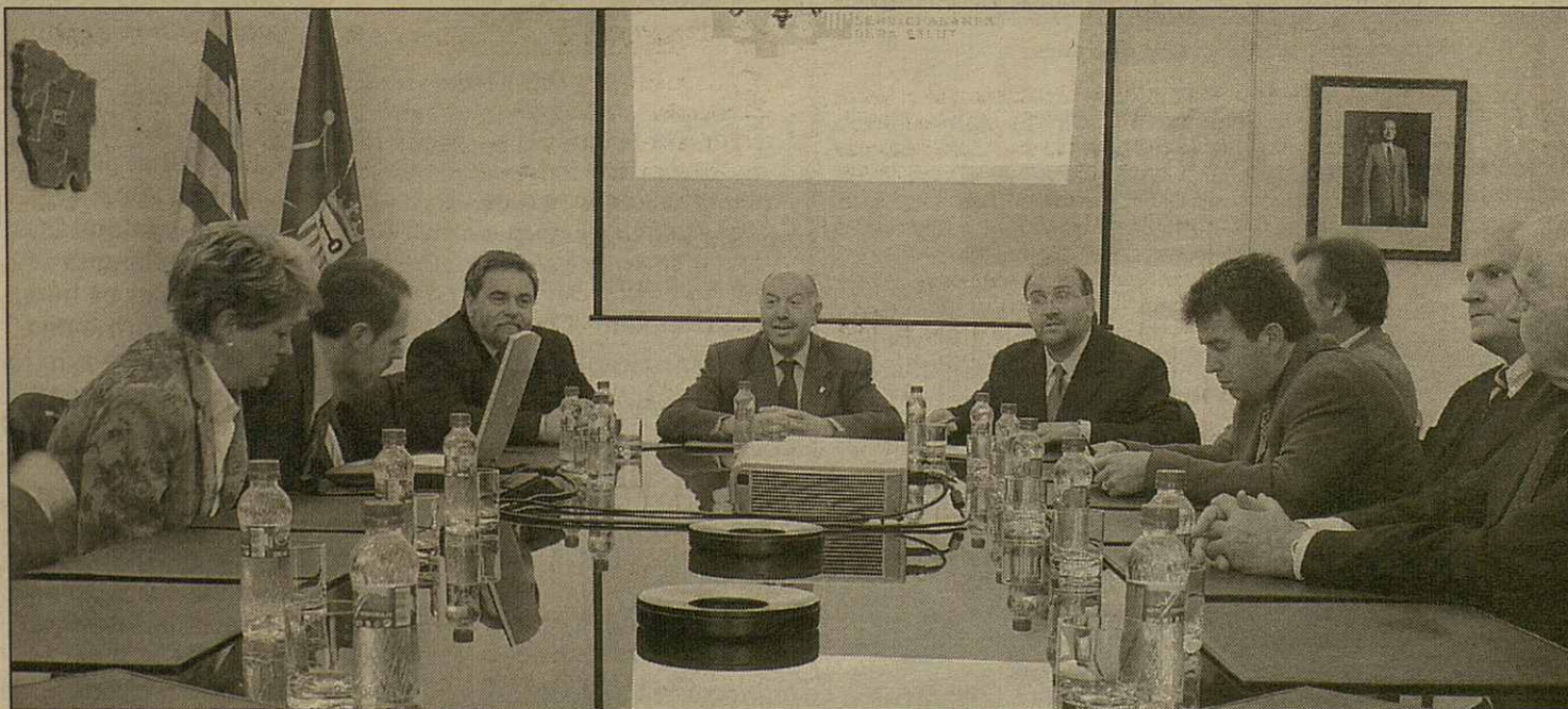
Era naua empresa sanitària Aran Salut siguec presentada deluns ena Casa deth Senhor d'Arròs

membres de L'Aliança peth trabalh amiat a tèrme ena Val d'Aran des der an 1966 e remerquèc que tamb aguest nau traspàs s' auance ena autogestion e ath madeish temps en autogovern dera Val d'Aran.