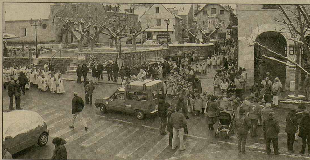
Desfilada pes carrèrs de Vielha

Es mainatges e mainades d'Educacion Infantil e Primària deth CEIP Garona celebrèren era tradicionau hèsta de Magràs damb ua desfilada pes carrèrs de Vielha. En tot qu'es mès petiti anèren acompanyats per sies personatges dera revista Era Garbèra, es mès grani desfilèren a ritme d'ua fanfara escolara improvisada entara ocasion en tot anar guidadi pes barbecassi, titàs tradicionau d'Aran. Mès de 500 escolans, tamb era ajuda des sòns mèstres, an confeccionat, pendent aquesti dies, es sòns titassi entà non mancar ad aquest eveniment qu'enguan viraue ath torn dera tematica des jòcs de taula. Dominòs, escacs, cartes,