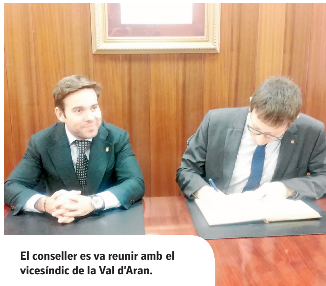
El conseller es va reunir amb el vicesíndic de la Val d'Aran.