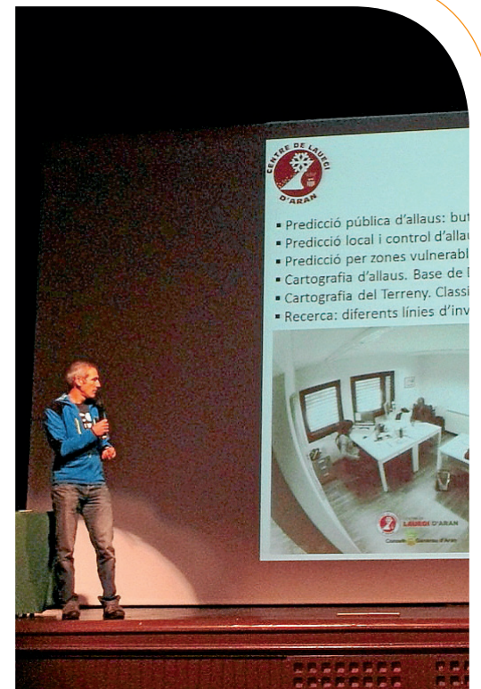
CONSELH GENERAU D'ARAN

Els agents de Medi Natural del Conselh Generau d'Aran han alliberat 780 truites al riu Jueu arran dels treballs de millora d'aquest tram del riu. Aquesta espècie està en perill d'extinció i per això, els treballs s'han dut a terme amb mesures de seguretat per evitar danys a les truites durant el trasllat al seu hàbitat.