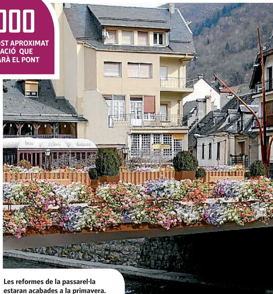
Les reformes de la passarel·la estaran acabades a la primavera.

EUROS ÉS EL COST APROXIMAT DE L'ACTUACIÓ QUE REFORMARÀ EL PONT