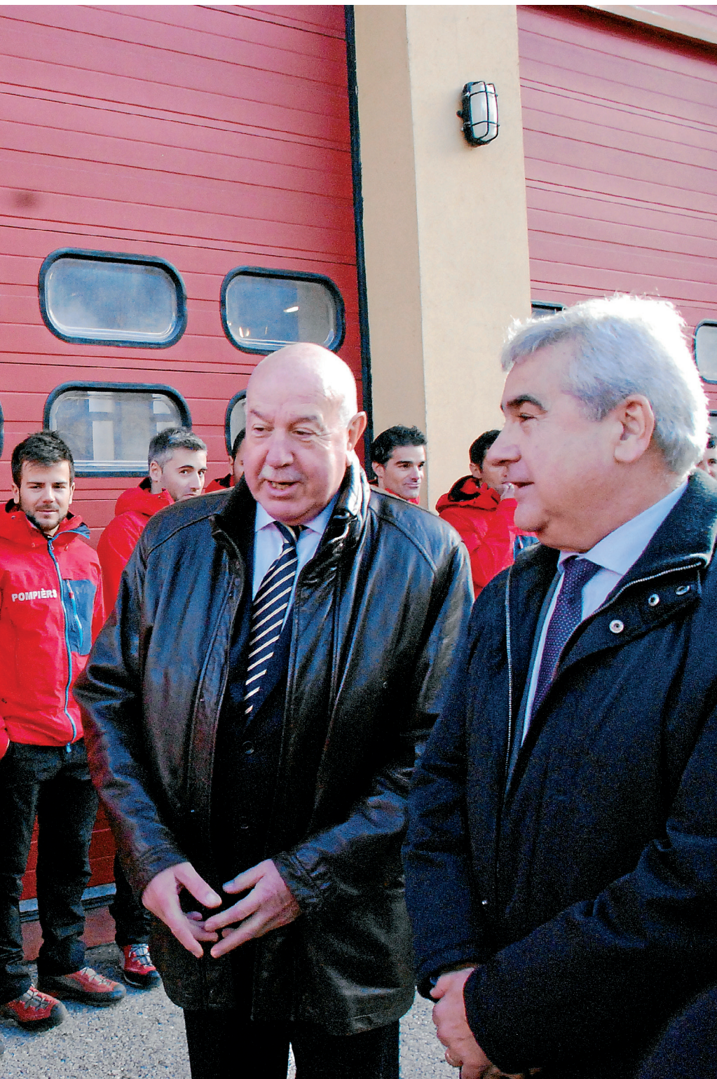
El síndic d'Aran i el secretari general d'Interior van presidir els actes.