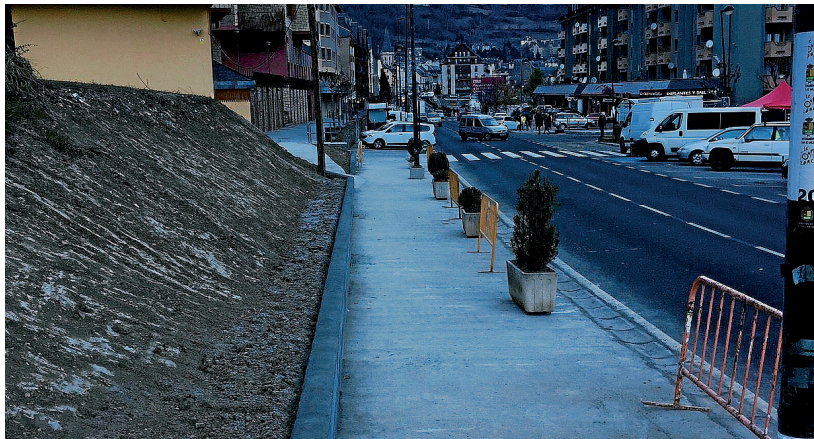
AJUNTAMENT DE VIELHA