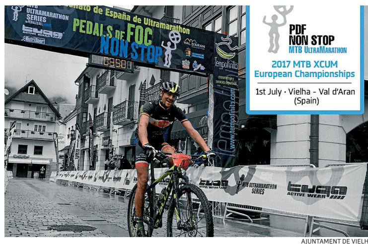
AJUNTAMENT DE VIELHA

La XI Pedals de Foc Non Stop albergarà els Campionats d'Europa MTB en la distància Ultramarathon el proper 1 juliol de 2017. El Club Ciclista Pedals del Món aconsegueix donar un gran pas endavant amb l'organització d'aquests campionats, per primera vegada en la història del ciclisme europeu, que suposa també el reconeixement oficial per part de la UEC i l'UCI de la distància MTB Ultramarathon. Aquest reconeixement se suma al del 2015 amb l'organització del I Campionat d'Espanya de la distància i el reconeixement de la Federació Espanyola de Ciclisme, i que es va consolidar el 2016 amb la segona edició dels estatals. La ciutat de Vielha, al costat del Parc Nacional