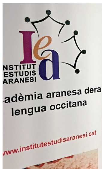
Participaires dera elaboracion deth diccionari der aranés.

Er Institut d'Estudis Aranesi-Acadèmia aranesa dera lengua occitana a iniciat era elaboracion d'un nau diccionari der aranés, que demore èster prèst en an 2017. Aguesta iniciatiua respon ara demanda des collectius educatius deth país e deth Conselh Generau. Des dera Acadèmia s'a hèt ua invitacion formau a mès de 200 personas, e se demore qu'aumens i age 1.000 mots entà qu'er an que ven se pogue dessenhlar era prumèra edicion. Era elaboracion deth nau diccionari, ei dubèrt a toti es que volguen colaborar damb er IEA, donques qu'atau se poderàn obtier es paraules a traùs dera transmission orau e arténher ua lengua modèrna e reau, era basa que se tròbe en còrpus dera Wikipedia en lengua occitana e en diccionari Joan Coromines. Eth president dera Acadèmia, Jusèp Loís Sans, comentau que "un diccionari dera lengua ei er element basic d'ua acadèmia. Un diccionari non s'acabe jamès, per açò qu'afrontam un prètzhet bric facil" assegurèc Sans, "prumèr mos cau explicar qu'era nòsta lengua existís e dempús decidir com ei e com serà en un futur, çò que provòque longues discussions sus era normalizacion."