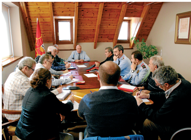
CONSELH GENERAU D'ARAN

El Govern d'Aran i el Consèil departamental de l'Haute Garonne han signat un acord per a la construcció del projecte de la pista per a bicicletes "TransGarona". El finançament serà comú dins del Programa Operacional de Cooperació Territorial Espanya França Andorra 2014-2020 (INTERREG-POCTEFA), per a la realització de 28 km que connecten els dos territoris (Val d'Aran i Fronsac), i que permeten continuïtat al circuit fins a Tolosa.