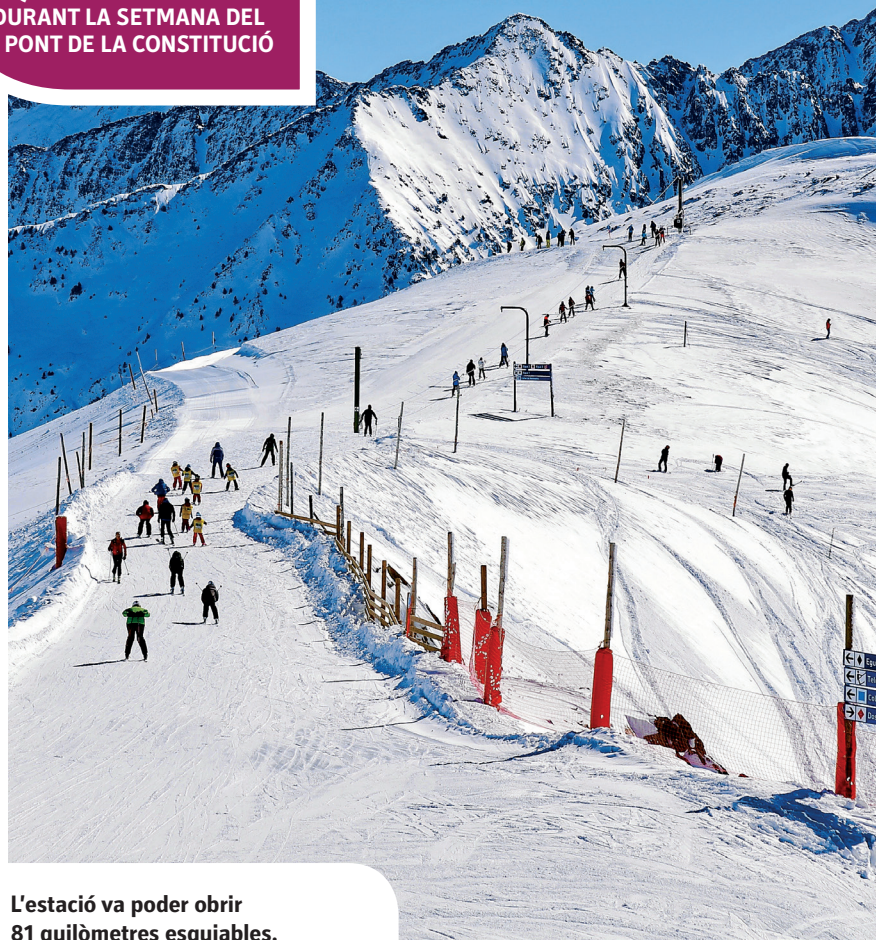
L'estació va poder obrir 81 quilòmetres esquiables.

ESQUIADORS VAN PASSAR DURANT LA SETMANA DEL PONT DE LA CONSTITUCIÓ