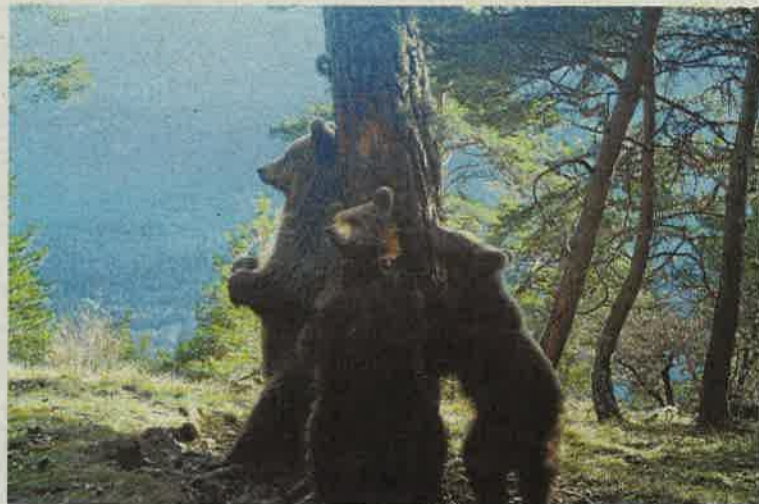
CONSELH GENERAU D'ARAN

Les càmeres automàtiques de Vielha van captar imatges de l'óssa Hvala amb els seus cadells, nascuts el 2015. El Govern d'Aran n'ha batejat un, Tai (germà en aranès) si és mascle o Tata (germana en aranès) si és femella, i França posarà el nom de l'altre cadell. També es va deixar veure el mascle Pyros en el moment que va sortir de la hibernació. Està previst portar un nou mascle d'Eslovènia, amb el projecte Piroslife, per tal de diversificar genèticament la població, atès que el més urgent és que trenqui el monopoli reproductor de Pyros i que porti nous al·lells a la població.