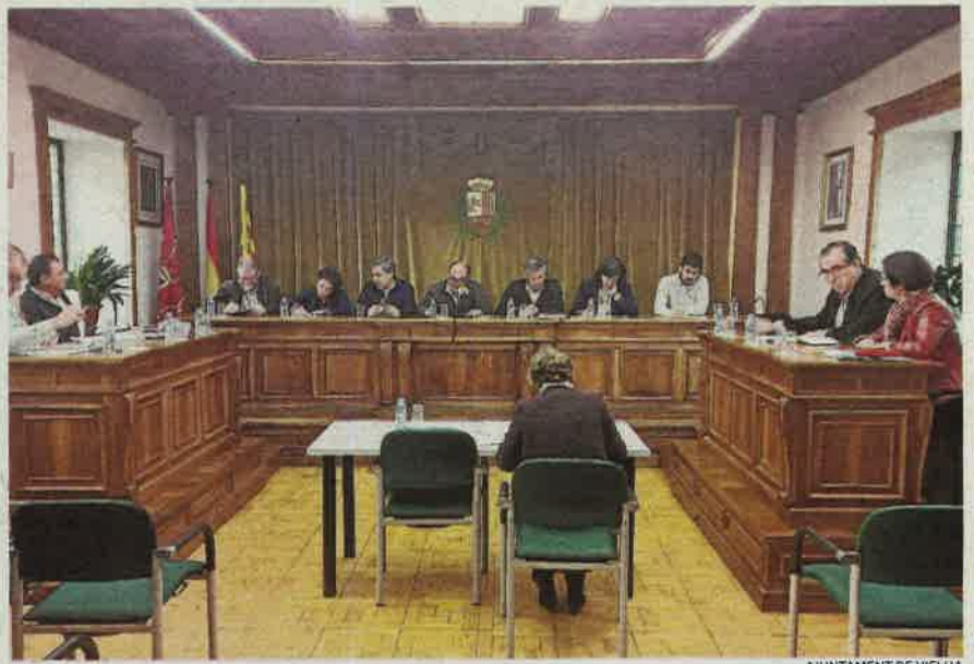
AJUNTAMENT DE VIELHA

CONVERGÈNCIA DEMOCRÀTICA ARANESA VOL QUE L'ACORD NO ES PUGUI TRENCAR UNILATERALMENT