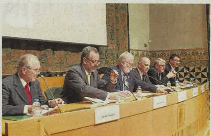
CONSELH GENERAU D'ARAN

Pendent eth 13 e 14 d'abriu, es alumnes a compdar de 3au dera ESO enquia Bachilierat se manifestèren e èren ua grèva entà protestar contra desparières mesures qu'eth govèrn centrau espanhòu aplique en airau der ensenhament.