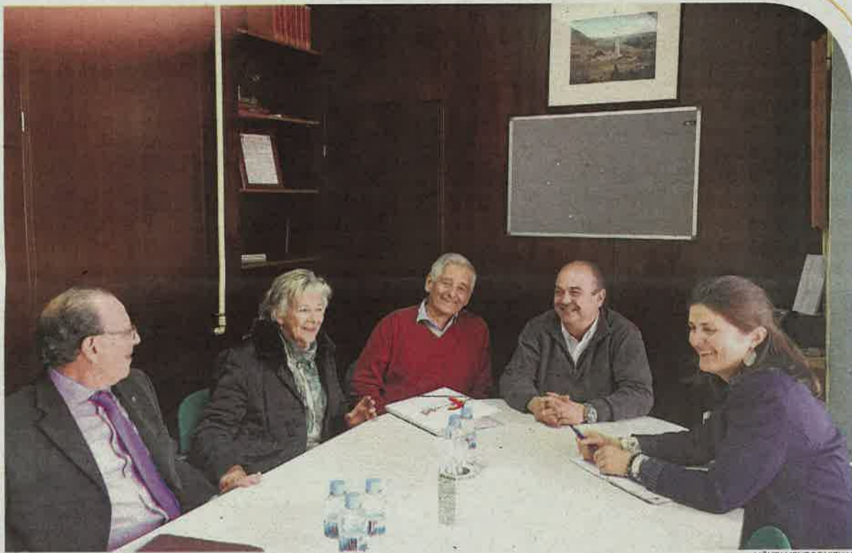
AJUNTAMENT DE VIELHA