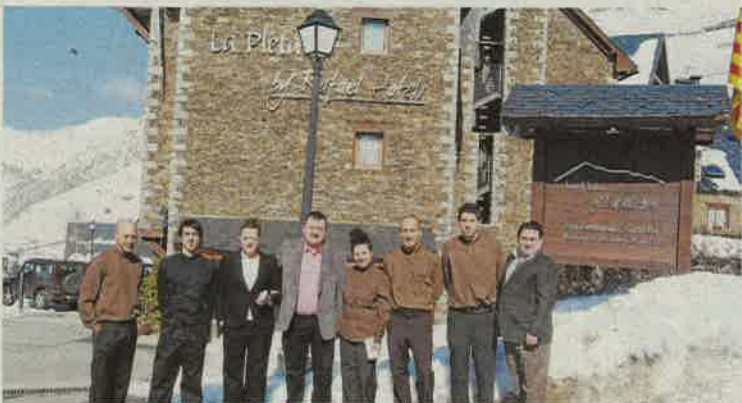
CONSELH GENERAU D'ARAN