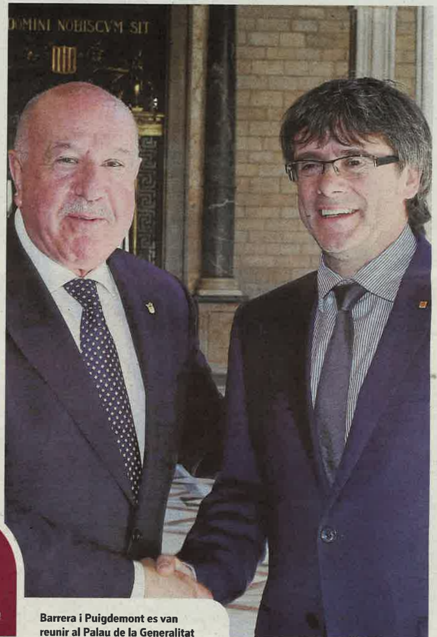
Barrera i Puigdemont es van reunir al Palau de la Generalitat

MILIONS D'EUROS DEU LA GENERALITAT AL CONSELH