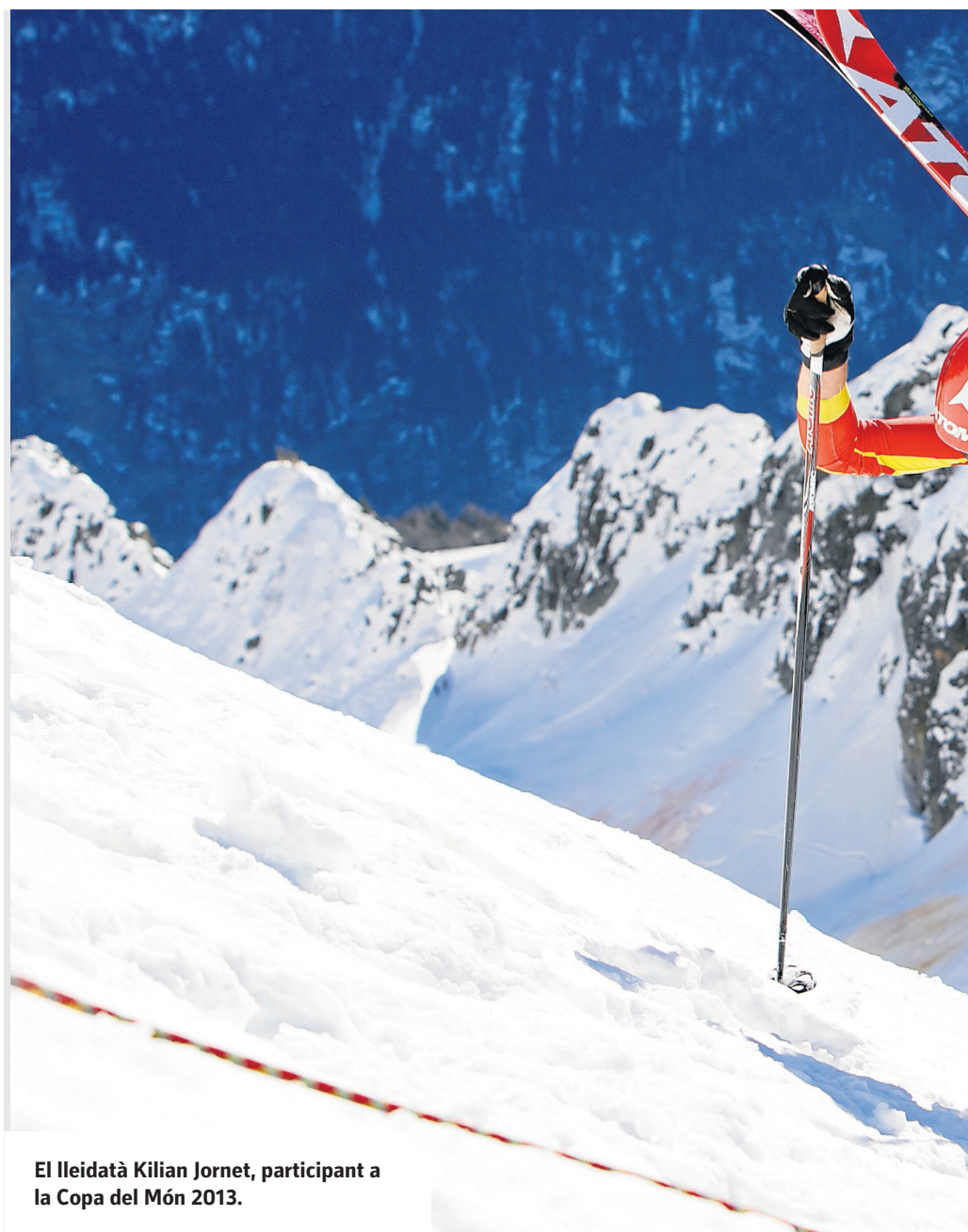
El lleidatà Kilian Jornet, participant a la Copa del Món 2013.

La Val d'Aran va acollir el passat 5 de juny la pedalada popular "La Fête du Tour" organitzada pel Conselh i amb la col·laboració de l'Ajuntament de Vielha, una iniciativa prèvia a la 9a etapa del Tour. Més de 200 esportistes van participar en aquesta competició que constava de dos recorreguts. Per una banda, el que passava per Vielha, Portillon i tornava a la capital, i per l'altra, el que feia un recorregut en bicicleta per Vielha.