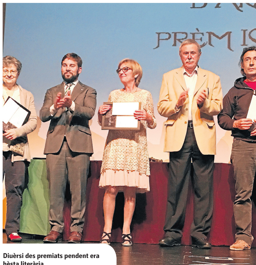
Diuèrsi des premiats pendent era hèsta literària.