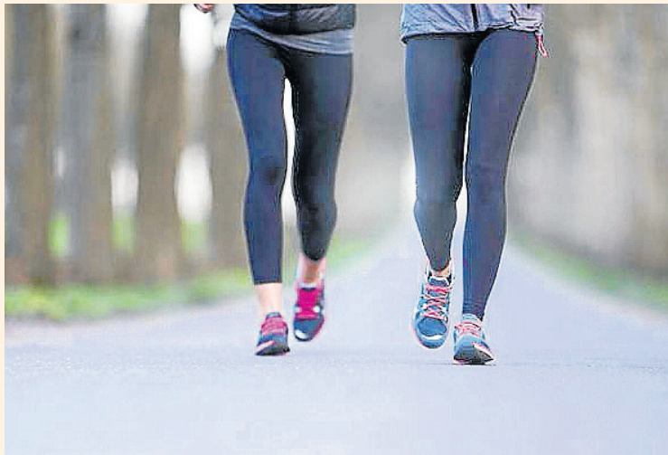
AJUNTAMENT DE VIELHA

Vielha serà la seu de la final de la setena etapa i de la travessa de la mítica cursa pels pirineus catalans. És una competició d'alta muntanya amb un total de 248 quilòmetres i 15.000 metres de desnivell, que comença a Ribes de Freser i finalitza a Vielha. L'última etapa tindrà sortida a Espot, amb una distància de 44 quilòmetres i una durada d'onze hores aproximadament.