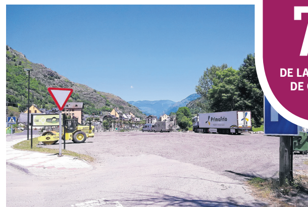
AJUNTAMENT DE BOSSÒST