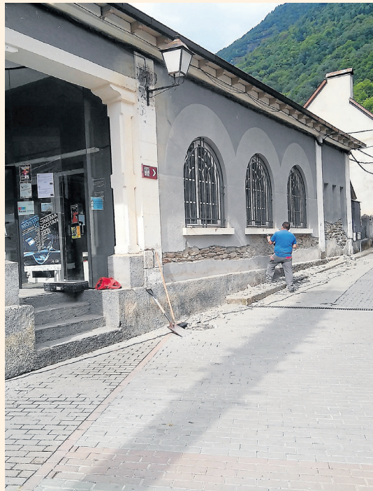
AJUNTAMENT DE LES

LES REPARACIONS DE L'EDIFICI MILLOREN LES CONDICIONS DELS USUARIS QUE UTILITZEN LA BIBLIOTECA MUNICIPAL DE LES