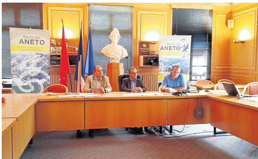
AJUNTAMENT DE VIELHA

VIELHA, LUCHON I BENASC ESTARAN CONNECTATS A TRAVÉS D'ACCIONS CULTURALS, TURÍSTIQUES I SOCIALS PER PROMOURE EL TURISME D'ARAN