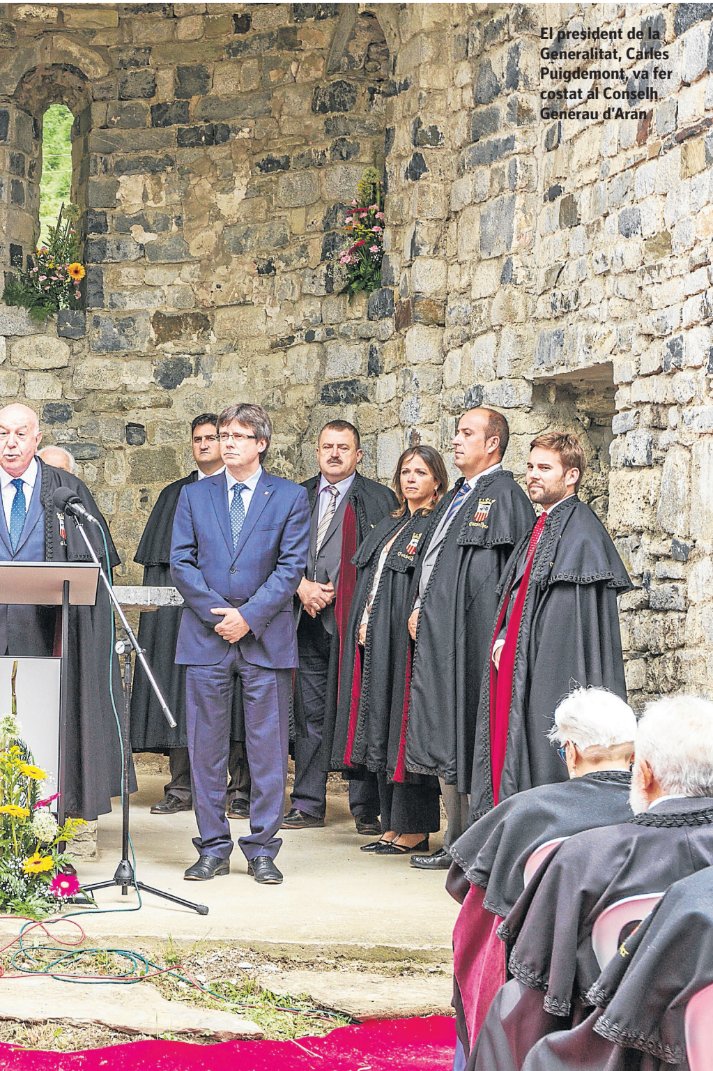
El president de la Generalitat, Carles Puigdemont, va fer costat al Conselh Generau d'Aran