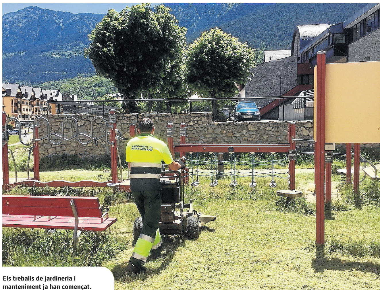
Els treballs de jardineria i manteniment ja han començat.

Pel que fa a les pedànies agregades del municipi, s'està esperant l'informe tècnic d'actuació per a l'arranjament de carrers que es preveu que finalitzi de seguida. D'aquesta manera, i juntament amb el pressupost aprovat, es podran començar les obres d'adequació i de manteniment dels carrers i dels parcs. En aquest sentit, ja han començat els treballs de jardineria i manteniment.