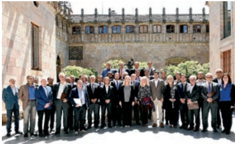
GENERALITAT DE CATALUNYA

ELS REQUERIMENTS DEL COMITÈ OLÍMPIC INTERNACIONAL HAN CANVIAT I LA DISTÀNCIA ENTRE ARAN I BARCELONA JA NO ÉS UN INCONVENIENT PER SER A LA CANDIDATURA