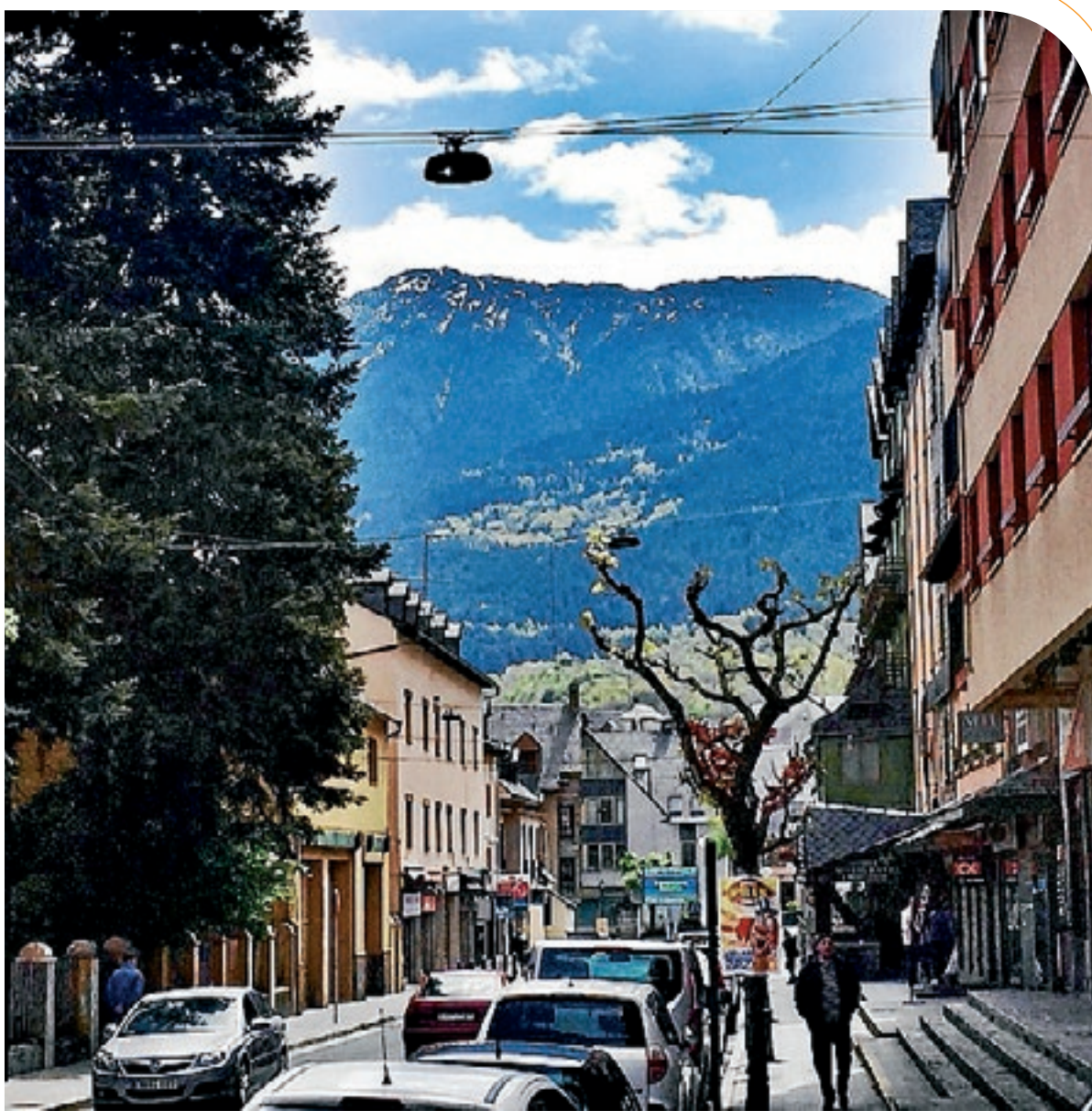
AJUNTAMENT DE VIELHA

Els treballs que s'hauran de realitzar en aquesta primera fase consisteixen a adaptar la centraleta telefònica de Vielha i crear la xarxa d'alimentació que permetrà distribuir la fibra òptica. Per poder realitzar aquesta implementació és necessari desplegar un nou cablejat, tant aeri com soterrani, per totes les vies municipals. Per a aquest treball s'aprofitaran les canalitzacions existents per passar els nous cables des de la centraleta principal, per després anar-la estenent a la resta de pobles. Aquest nou servei arriba després que l'any passat el Cosso de Noves Tecnologies de l'Ajuntament, Alberto López, es reunís amb els responsables de Telefónica a Barcelona per reclamar l'arribada de la fibra òptica al municipi. Segons López, "la implementació de la fibra es convertirà en el motor de l'emprenedoria, ja que ajudarà a posar en marxa nombrosos projectes d'innovació, així com a generar noves oportunitats laborals que fins ara no eren possibles. A més a més, és un servei que es troba estretament lligat amb el benestar econòmic, social i turístic". Els principals avantatges tècnics que la fibra òptica portarà al municipi són la gran velocitat de navegació, la millora en la capacitat i la qualitat i la màxima seguretat en la transmissió de dades. Els ciutadans passaran de navegar a 6Mb a superar els 300Mb i percebran una millora en el servei d'internet mòbil 4G, que es veurà beneficiat per la fibra.