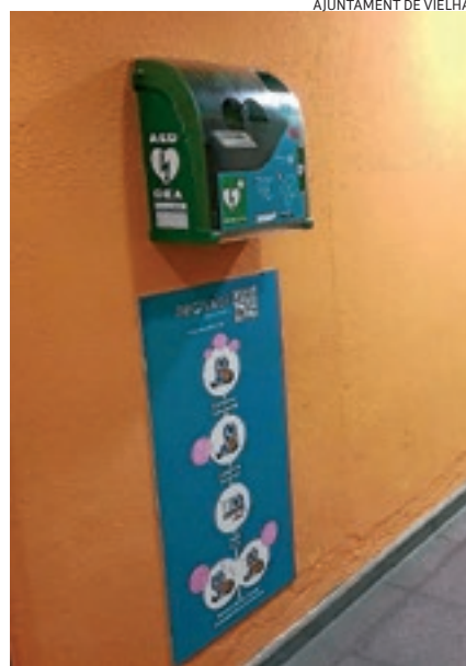
Vielha té tres desfibril·ladors.

L'Ajuntament de Vielha ha instal·lat tres desfibril·ladors DEA de fàcil accés al Palai de Gèu, al Palai d'Espòrts i al Casau del Jubilat per garantir l'assistència davant d'una urgència. Aquest instrument podrà ser utilitzat tant per personal sanitari com per personal autoritzat, en cas d'aturada cardíaca. Per això, s'han organitzat cursos de formació per a tot el personal tècnic