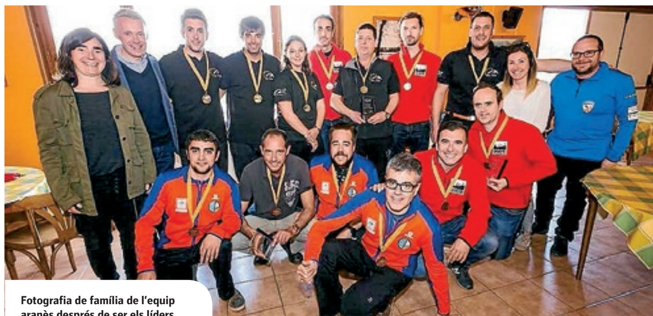
Fotografia de família de l'equip aranès després de ser els líders.

Amb aquest nou títol de la temporada, el Club Curling Val d'Aran s'ha guanyat una plaça a la Lliga Espanya.