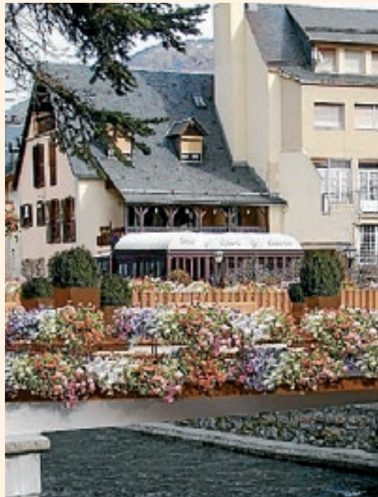
AJUNTAMENT DE LES

L'AJUNTAMENT COMENÇARÀ LES OBRES DE LA PASSAREL·LA AL 4 DE SETEMBRE PER NO AFECTAR LA CAMPANYA TURÍSTICA