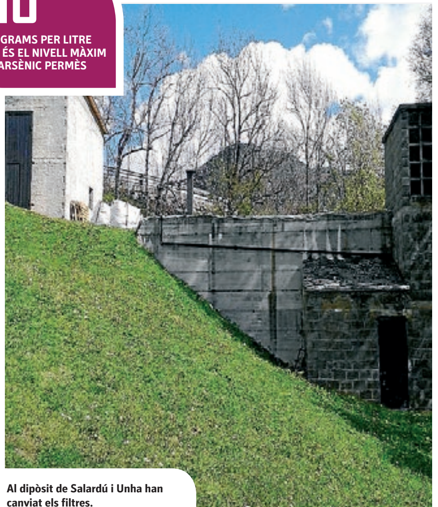
Al dipòsit de Salardú i Unha han canviat els filtres.