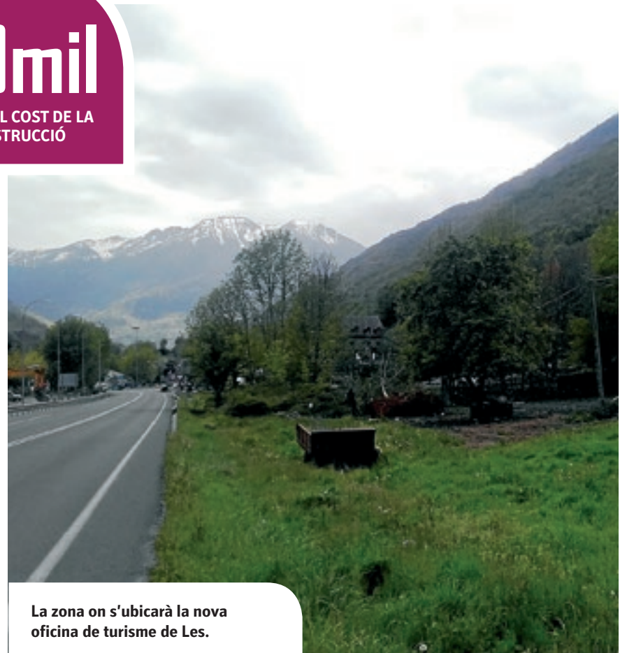
La zona on s'ubicarà la nova oficina de turisme de Les.

d'aquesta nova oficina de turisme és divulgar la cultura i la llengua aranesa. La inversió prevista en aquest nou centre és de 380.000 euros i l'empresa encarregada de la seva construcció és Transportes i Excavaciones Barba. El consistori sufragarà els treballs amb fons de la Generalitat de Catalunya, obtinguts després d'anys de litigis amb la cancel·lació anys enrere de l'antic projecte d'instal·lació d'un Centre d'Acollida Turística (CAT).