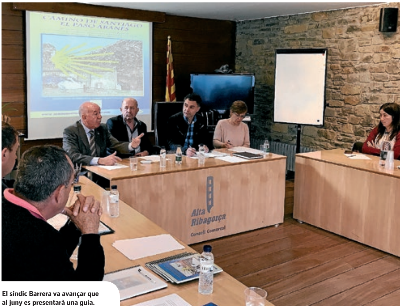
CONSELH GENERAL D'ARAN