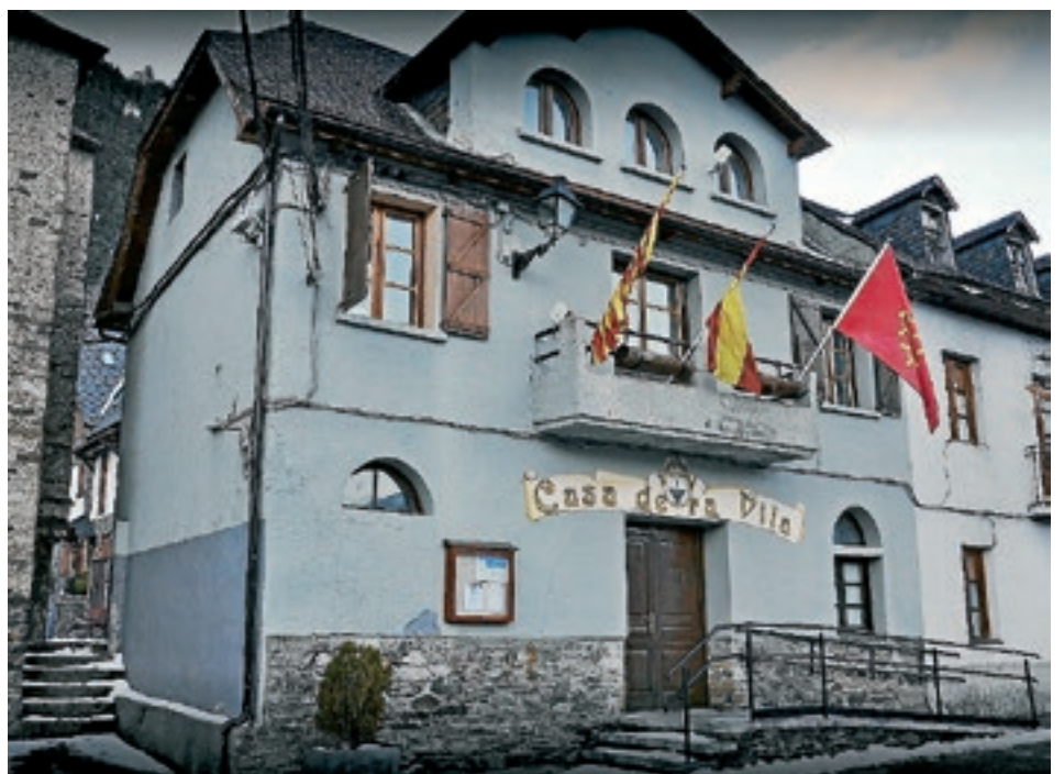
CONSELH GENERAL D'ARAN

ELS AJUNTAMENTS D'ARRES, BAUSEN I VILAMÒS, FINS AL DIA D'AVUI, NO DISPOSAVEN DELS PLANS DE PROTECCIÓ CIVIL I EL CONSELH GENERAL D'ARAN HA FIRMAT UN CONVENI AMB ELLS PER ELABORAR EL DUPROCIM