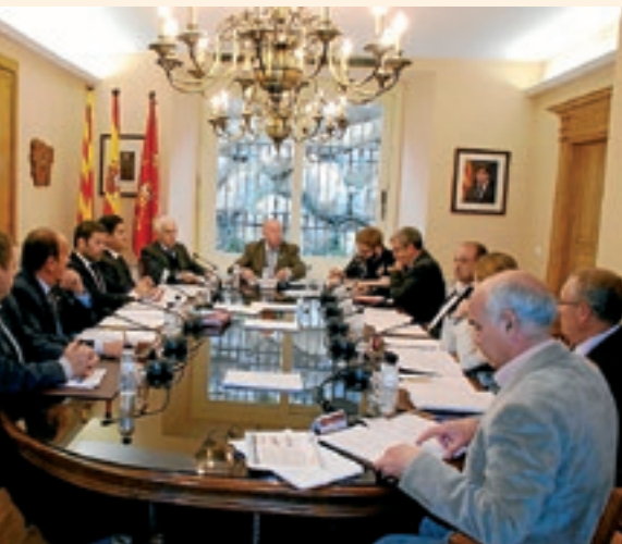
CONSELH GENERAU D'ARAN