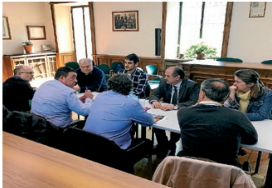
AJUNTAMENT DE VIELHA

PRIMER S'IMPLANTARÀ A LA CAPITAL ARANESA I DESPRÉS A LA RESTA DE POBLES DEL MUNICIPI