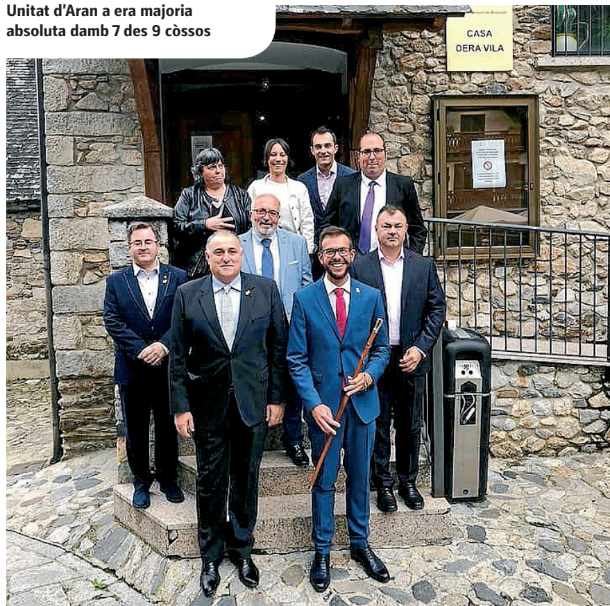
AJUNTAMENT DE BOSSÒST

Unitat d'Aran a era majoria absoluta damb 7 des 9 còssos