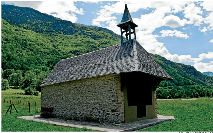
AJUNTAMENT DE LES

Dejà s'an licitat es trabalhs de manteniment dera capèla dera Lana damb un pressupòst de 17.000 èuros. Se prevé qu'en seteme s'inicien aguesti trabalhs de consolidacion dera tanben coneishuda coma Capèla dera Mair de Diu des Nhèus. Aguestes accions son finançadas damb un hons der Ajuntament de Les destinat a preservar es monuments, capèles e glèises de Les.