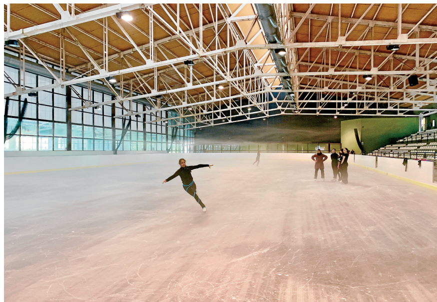
AJUNTAMENT DE VIELHA E MIJARAN

ES CLUBS ESPORTIUS ABITUAUS DEJÀ PÒDEN COMENÇAR A ENTRENAR DEMPÚS DE MÈS D'UN AN