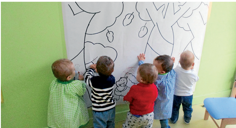
AJUNTAMENT DE VIELHA E MIJARAN

Era Hèsta de Vielha compdarà enguan damb era incorporacion d'un punt lila, qu'ei un espaci d'informacion e atencion as victimas d'agresions sexuaus (autant verbaus coma fisiques), de manèra qu'era seguretat des personas sigue garantida ath long dera Hèsta. Er Ajuntament de Vielha e Mijaran plaçarà aguest punt ena entrada dera Sala de Hèstes pendent es sessions de balh, e serà integrat per gent formada en aguest ahèr. Aquiu i aurà materiau d'informacion, sensibilizacion e prevencion, en tot assegurar era confidencialitat en cas de denúncia.