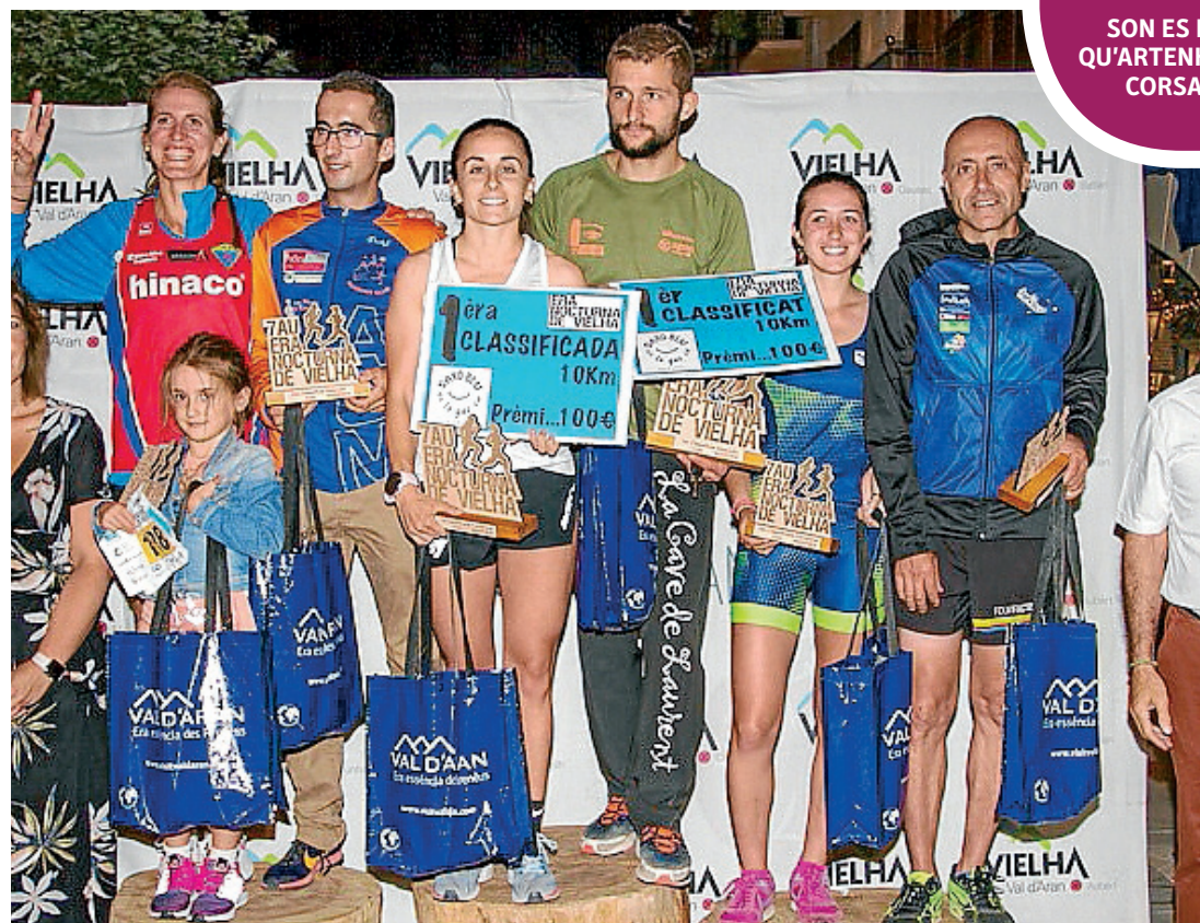
ERA NOCTURNA DE VIELHA

Autant es dues corSES coma era caminada recorren es carrèrs deth cap-lòc aranes de net en tot balhar ua experiéncia unica as esportites.