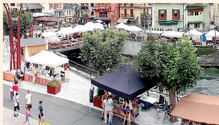
AJUNTAMENT DE LES