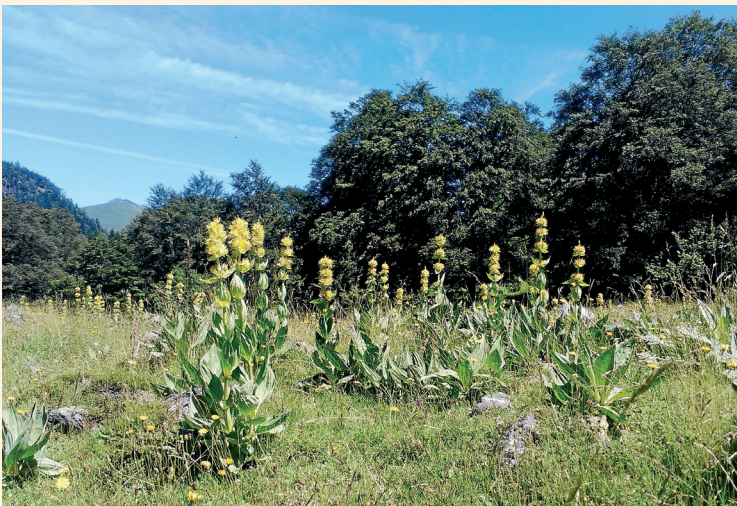
CONSELH GENERAU D'ARAN

Vielha a tornat a acuelher un an mès era Hèira de productes artesanans "Hèt a man, hèt aciù". Atau, pendent es dies 8,9, 10 e 11 d'agost lèu ua vintea d'artesans veneren en Passèg dera Libertat de Vielha es sòns productes agroalimentaris e manufacturats. Ua edicion que tornèc a demostrar era excellenta acuelhuda autat peth public locau coma torista.