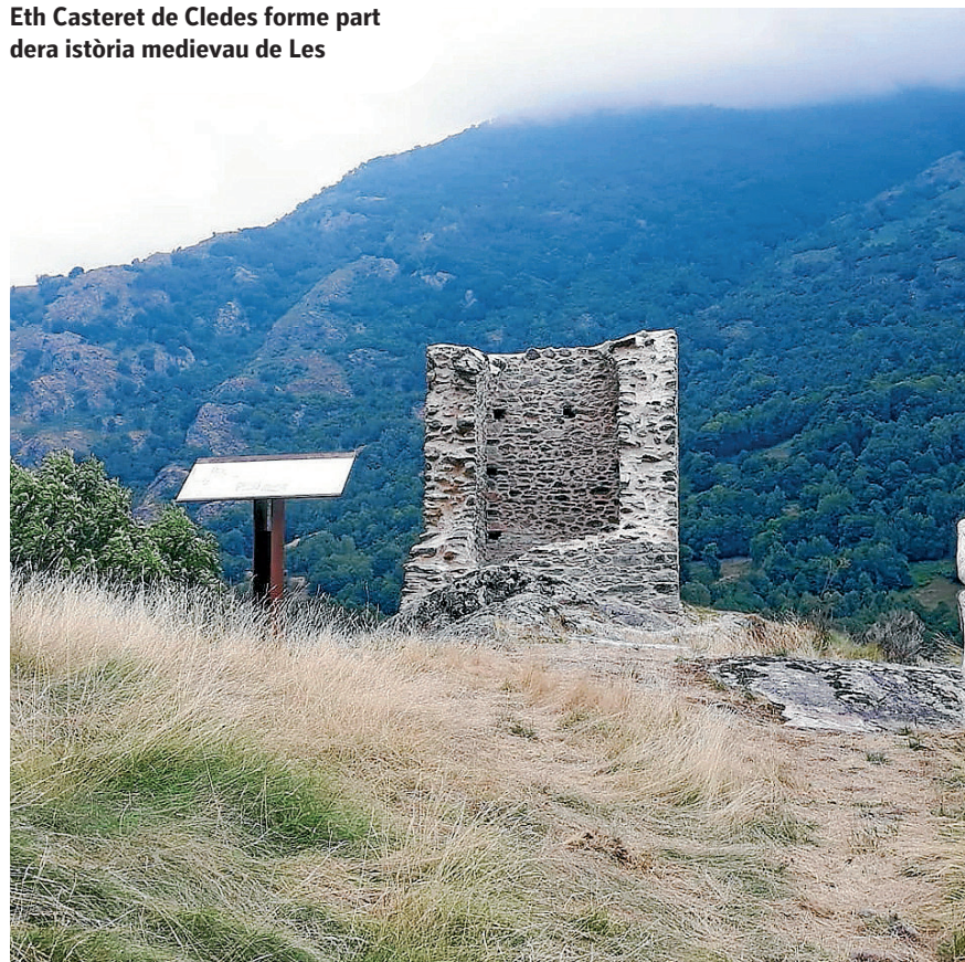
AJUNTAMENT DE LES