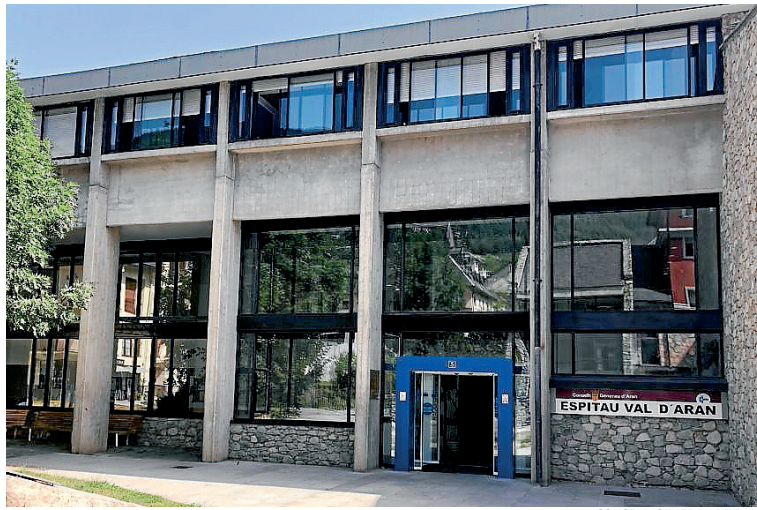
CONSELH GENERAU D'ARAN

Er espitau dera Val d'Aran compde dejà damb un nau mamograf de darrèra tecnologia. Aguest nau arribat incorporè un sistèma de Biòpsia Digitau Verticau que permet ampliar er emplec deth mamograf tà pròves de biòpsia, en tot milhorar es tempsi de realizacion deth procediment e en tot garantir ua totau fiabilitat diagnostica. Tanben compde damb ua estacion de diagnostic multimodalitat que supòrte aplicacions auançades coma era tomosintèsi. Arrebrembam qu'un mamograf ei un aparelh de Rais X que permet cercar signes de càncer de mama en etapes inicials. Eth nau substituirà ar aparelh qu'auie er Espitau des der an 2002, que siguec ua donacion deth Club Soroptimist International d'Aran.