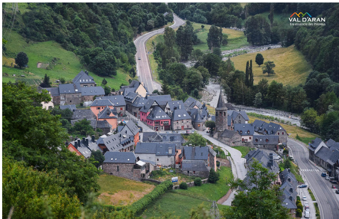
CONSELH GENERAU D'ARAN

Eth passat 15 d'octobre, er os Goiat perdec eth colharet que permetie conéisher era sua localizacion. Eth colier siguec localizat ena comarca dera Ribagorza aragonesa, en un lòc de dificil accés a on i auie eth jaç en quau auie descansat pendent eth dia.