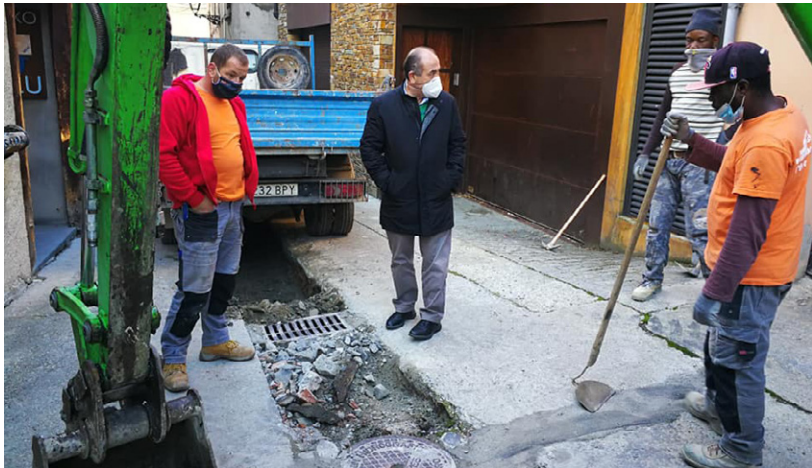
AJUNTAMENT DE VIELHA E MIJARAN

Es treballadors der Ajuntament de Vielha e Mijaran an arrecebut ua jornada de formacion virtuu en matèria de violéncia sexuau en entorns d'òci per part de tecnicos dera Generalitat de Catalonha. En aguesta session se trabalhèc enes mecanismes e procediments que s'an d'amiar a tèrme entà evitar, previer e minimizar es possibles casi de violéncia sexuau en aguest airau, en tot destacar era importància dera implantacion des punts segurs (punts liles).