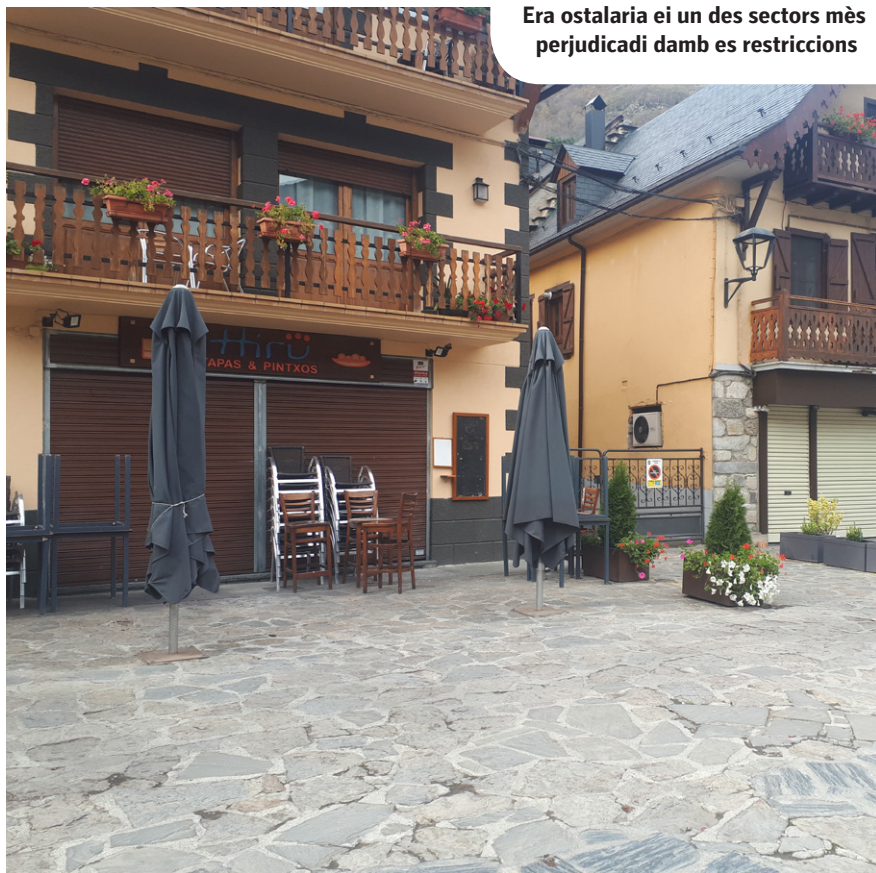
Era ostalaria ei un des sectors mès perjudicadi damb es restriccions