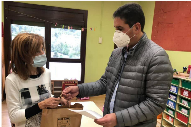
AJUNTAMENT DE NAUT ARAN

Er Ajuntament de Naut Aran a balhat as directores des escòles Ruda, Loseron e Sant Martí un totau de 260 masquetes entà repartir-les entre es 130 alumnes de primària entà que les poguen utilizar pendent aguesti mes que vien. Se tracte de masquetes deth modèl UNE 0065, que se poden lauar enquia 20 viatges e que protegissen d'ua forma eficienta as usatgèrs. Ath delà, ara rèsta de mainatges de Naut Aran qu'estudien en d'alti centres tanben se les balharà masquetes. En aguest cas, serà era pròpria brigada municipau qui les liurarà en casa sua.