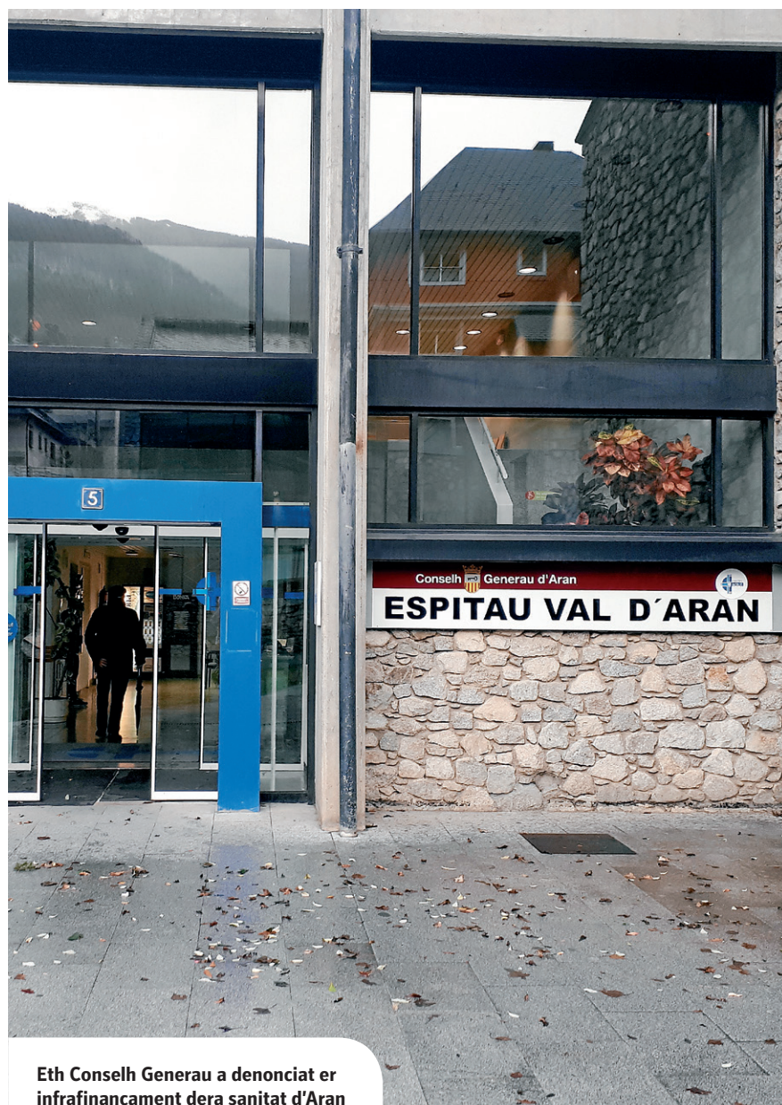
Eth Conselh Generau a denonciat er infrafinançament dera sanitat d'Aran

ETH CONSELH INVERTIRÀ 250.000 EURÒS TATH RENAIEMENT D'UN APARELH DE RADIOGRAFIES E UN AUTE D'ANESTESIOLOGIA. ATH DELÀ, ETH GOVÈRN ARANÉS A INSTALLAT EN VIELHA DUS MODULS DE TRIGATGE TÀ PERSONES DAMB SIMPTOMATOLOGIA