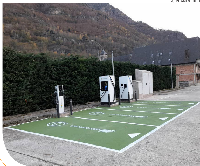
AJUNTAMENT DE LES

UA NAUA MANÈRA DE COMPRÈNER ERA INFORMACION LOCAU