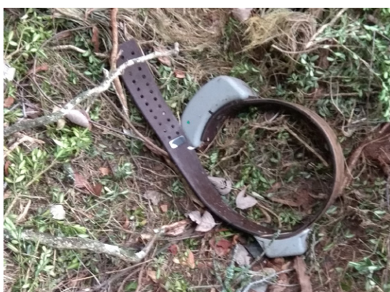
GENERALITAT DE CATALONHA

Dejà s'an iniciat es òbres d'adequacion e milhora deth refugi dera Honeria, plaçat ena Val de Toran. Un projècte deth Conselh Generau d'Aran qu'a coma objectiu potenciar e valorizar tota aguesta zòna e es sòns entorns. Aguesti trabalhs d'adequacion an un valor totau de lèu 450.000 euròs e ei previst que siguen finalizadi en mai de 2021.