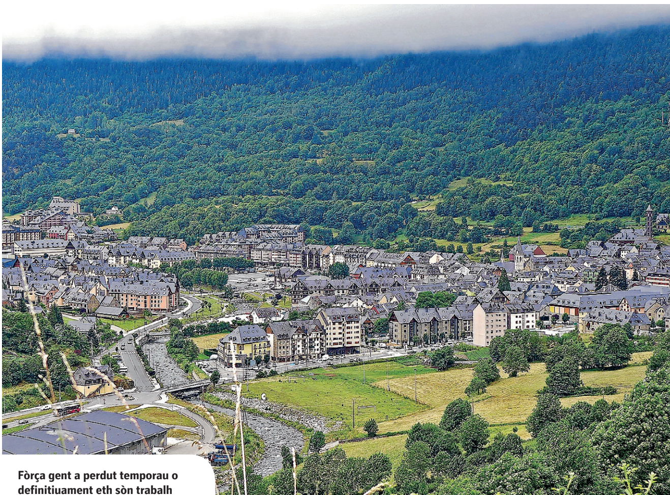
Fòrça gent a perdut temporau o definitiuament eth sòn trabalh

Er Ajuntament de Vielha e Mijaran a enregistrat mès de 800 sollicituds des desparières linhas d'ajudes e subvencions extraordinàries qu'enguan a metut en foncionament entàs vesins/es empadronadi/es en Vielha e Mijaran, entà lutar contra era crisi economica derivada dera aparicion dera pandèmia dera COVID-19. Totes aquestes ajudes e subvencions extraordinàries, a on tanben s'an d'includir era trentia de persones contractades enes plans aucupacionaus, s'amien a tèrme en un moment economic complicat, des dera declaracion der estat d'alarma, qu'a portat a fòrça familhes e negòcis a auer problèms entà poder suberviuer, pr'amor que fòrça gent a perdut temporau o definitiuament eth sòn lòc de trabalh. Era soma d'aguest plan d'ajudes extraordinàries implementades enguan per Ajuntament de Vielha e Mijaran serà de mès de 500.000€. Atau madeish, er Ajuntament, amassa damb eth Conselh Generau, se trape en tot finalizar era redaccion d'ua naua linha d'ajuda que compdarà damb ua partida de 100.000€ dirigida as personas que se trapan en risc d'exclusion social e, per tant, son fòrça vulnerables deuant dera crisi economica d'enguan e, sustot, en tot pensar de cara a 2021. "Era prioritat der Ajuntament son es nòsti/es vesins/es e es sòns negòcis e lòcs de trabalh en aguesti moments economics complicadi. Per aquerò, implementèrem tot un seguit d'ajudes extraordinàries, que sajaram de resòlver tant lèu coma sigue possible", comente eth baile de Vielha e Mijaran, Juan Antonio Serrano.