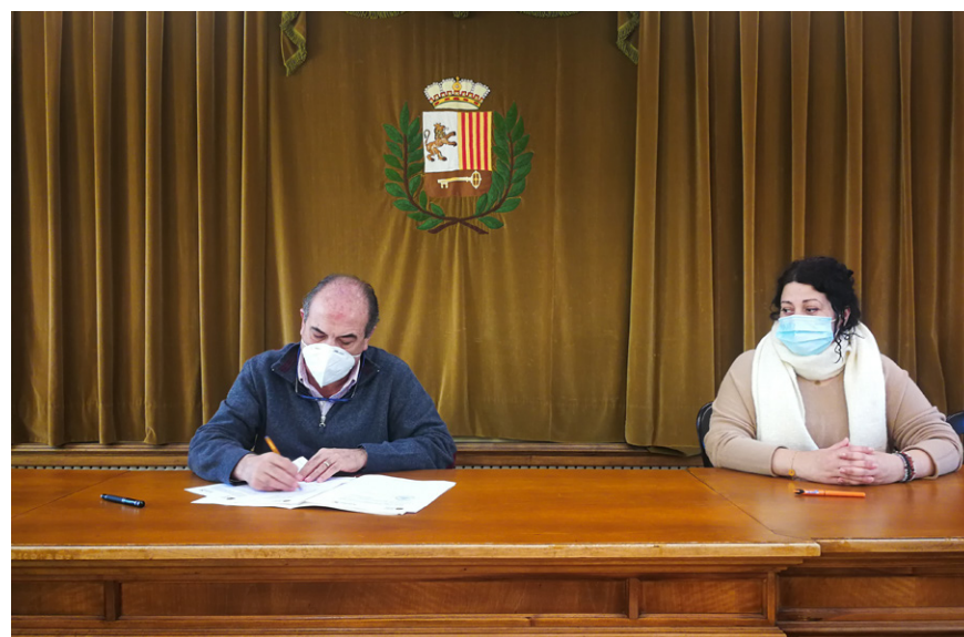
AJUNTAMENT DE VIELHA E MIJARAN

Er Ajuntament de Vielha e Mijaran e era associacion animalista 4 Pautes an tornat a renair eth convèni de colaboracion damb eth que trabalhen entà garantir era proteccion e eth benèster animau. Er Ajuntament de Vielha e Mijaran siguec eth primèr consistòri dera Val d'Aran en cooperar damb era associacion animalista, a compdar de 2017. D'aguesta manèra, en tot seguir damb era estreta colaboracion d'ans endarrèr, er Ajuntament de Vielha e Mijaran ajude en tot çò de possible entà suenhar es animaus domestics trapadi e arremassadi en municipi. En aguest sens, er objectiu principau d'enguan ei refortilhar eth trabalh des colònies de gats sauvatges.