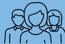
Redusís era activitat social

Se te trapes mau, truca ath 061 Salut Respon.