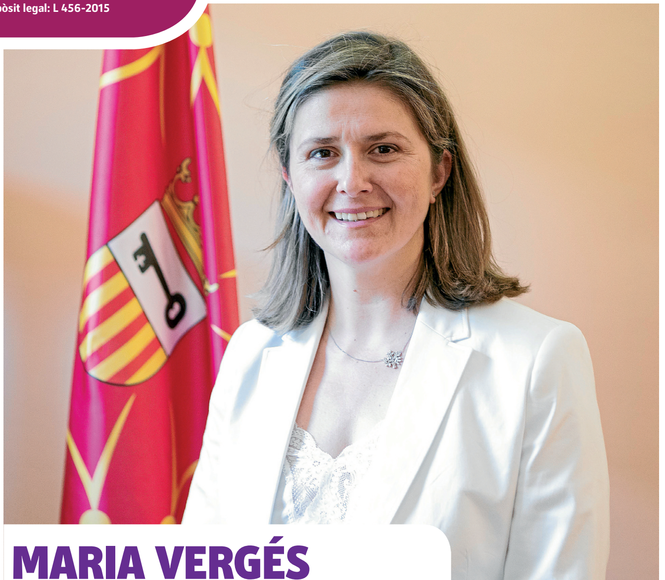
CONSELH GENERAU D'ARAN

Quin ei eth messatge qu'a destacat en discors com naua sindica? È sajat d'explicar qu'agarri aguest nau