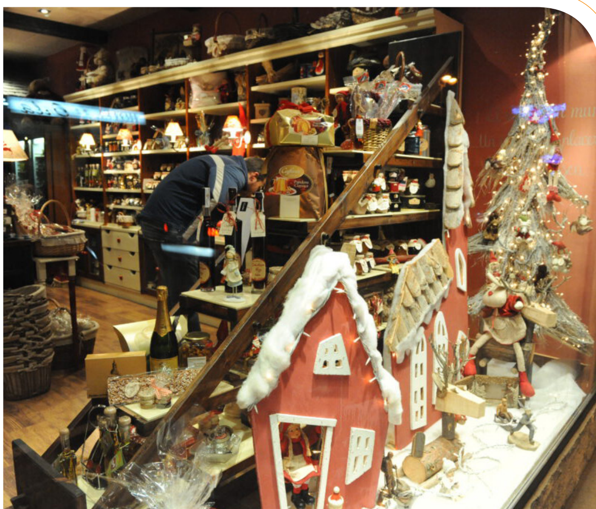
CONSELH GENERAU D'ARAN