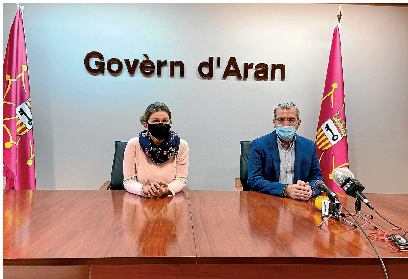
CONSELH GENERAU D'ARAN

Tal e coma establís era Lei 1/2015, deth 5 de he-reuèr, deth regim especiau d'Aran, era Sindica ei era maxima autoritat deth Govèrn e dera Administracion d'Aran. Era Sindica a era mès naua representacion deth Conselh. Tanben a era representacion ordinària dera Generalitat de Catalonha en Aran.