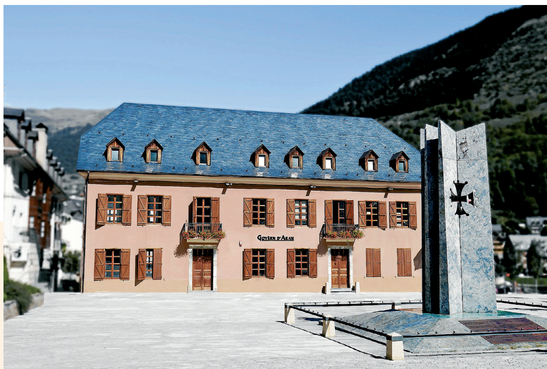
CONSELH GENERAU D'ARAN

ERA OPOSICION, CONVERGÈNCIA ARANESA, A AFIRMAT QU'ERA ACTITUD DE BOYA A ESTAT EGOÏSTA PER PREFERIR UA CAGIRA EN MADRID ABANTES QU'ÈSTER SINDIC