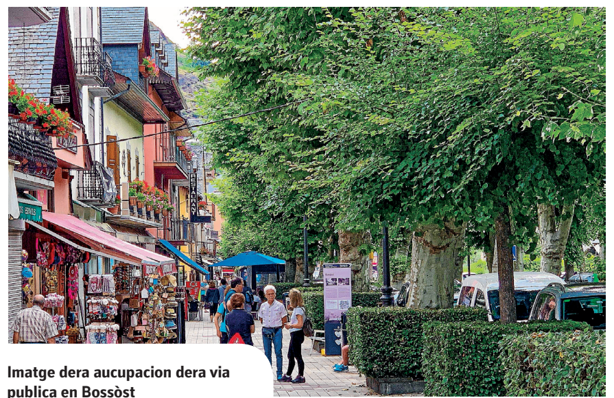
Imatge dera aucupacion dera via publica en Bossòst

Ena mesura des sues possibilitats, er Ajuntament ven d'aprovar ua naua supression dera taxa d'ocupacion dera via publica per miei des terrasses e trebalhe dejà en ua naua linha d'ajudes entàs activitats economicas deth municipi, qu'un an mès ven de patir es consequéncias dera crisi pandemica, damb eth grèuge hijut deth barrament dera frontèra deth Portilhon, via d'accès deth sòn client majoritari. Coma auem reiterat, aquesta decision deth Govern francés ei injusta e non se pòt justificar ena UE actuau, pr'amor que va en contra dera volentat des territòris transtermierèrs de compartir servicis e projèctes. D'un aute costat, dauant dera manca d'accès ara viuenda, Bossòst daurís ara ua reflexion collectiva per miei dera suspension des licéncias de lotjaments toristics e viuendes compartides tanben damb finalitat toristica entà regular-ne eth sòn usatge e condicions e favorir ara longa eth dret dera ciutadania a accedir a un abitatge digne damb er objectiu de consolidar poblacion e garantir un mielhòr pervier entath nòste municipi. Non serà facil, mès pensam que Bossòst a de besonh encarar aquest rèpte per miei dera regeneracion deth sòn centre istoric e era generacion d'oportunitats en un entorn favorable entà hè'c possible. En aquesta pensada, segur que mos i trobaram. Volem intensificar es nòstes relacions damb er aute costat dera termièra entà generar naues e milhors oportunitats entàs nòsti joeni.