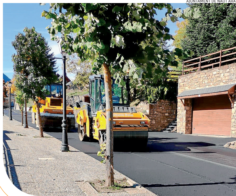
AJUNTAMENT DE NAUT ARAN

En totau s'an destinat 37.000 èuros provinents der Ajuntament de Naut Aran. Es trabalhs sigueren fòrça rapids d'executar-se pr'amor qu'es condicions climatologiques sigueren fòrça bones.