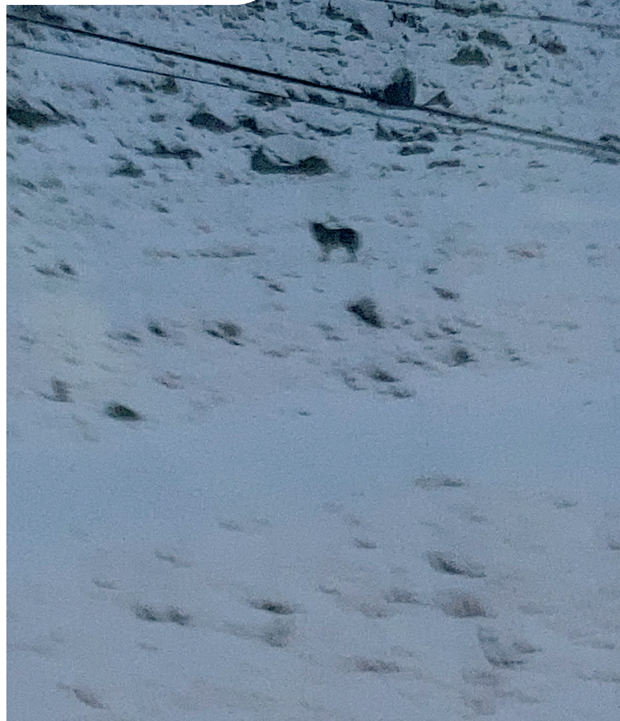
CONSELH GENERAU D'ARAN

Era imatge, pòc clara, siguec hèta ena boca sud deth Tunel de Vielha