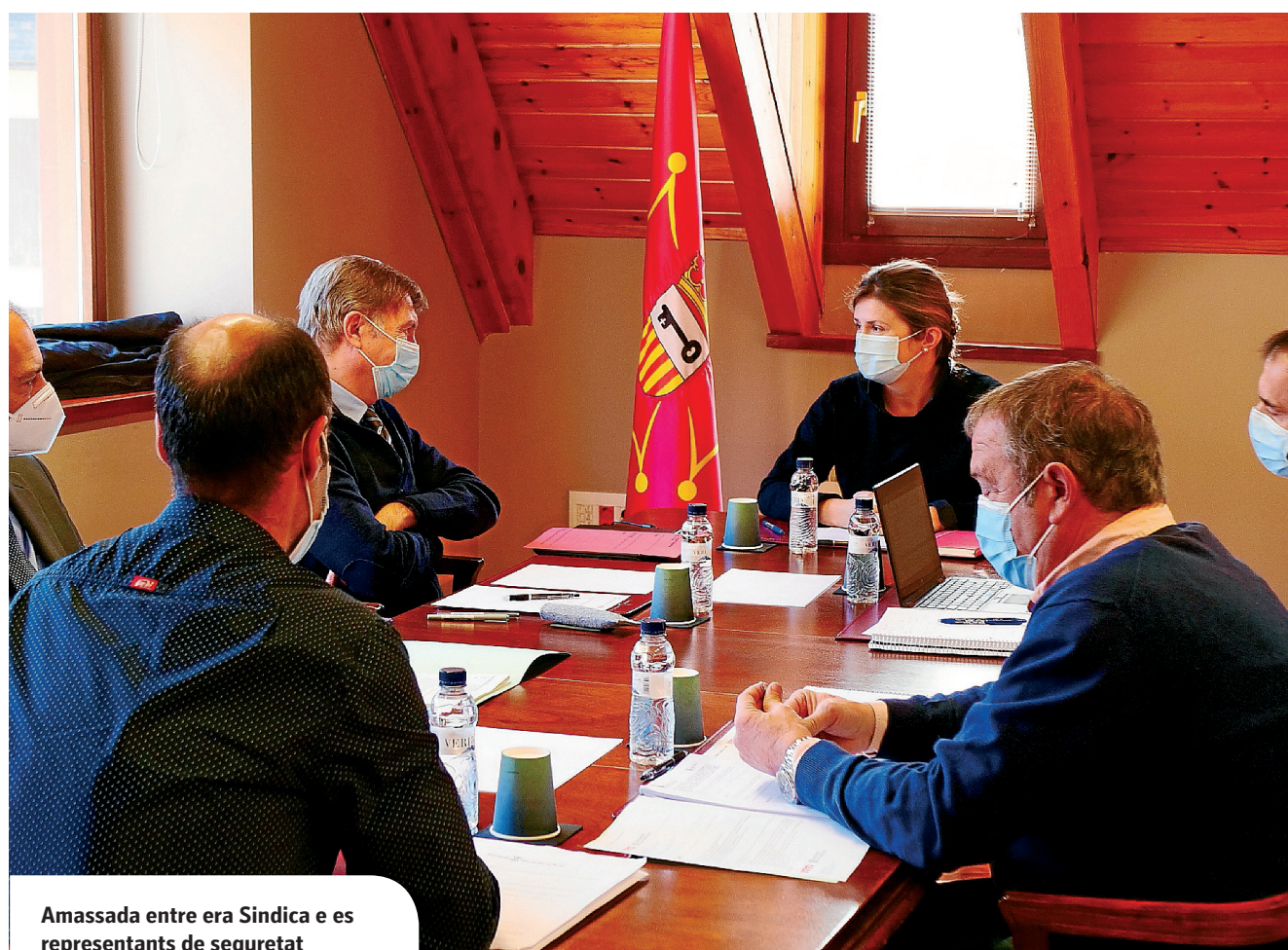
Amassada entre era Sindica e es representants de seguretat

Tanben se consensuèc era responsabilitat operativa q'auràn conjuntament Pompièrs e Bombers.