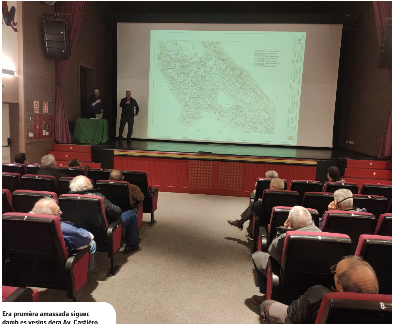
Era prumèra amassada siguec damb es vesins dera Av. Castièro

Eth projècte contemple un totau de sèt actuacions: Ena Avenguda Castièro, Avenguda dera Tuca, es carrèrs Clòses, Quate Lòcs, Pomaròla e Anglada, e eth camin de Casau. Entà qu'es vesins des carrèrs afectadi agen mès coneishement sus es òbres, er equip de govèrn realizarà un seguit d'amassades damb eri entà presentar-lis eth projècte. "Damb aguest projècte d'urbanizacion e adeqüacion des trepadèrs volem amiar a tèrme ua melhora d'aguesti espacis publics, en tot favorir ua melhora accessibilitat e circulacion entàs pedons", comente eth baile de Vielha e Mijaran, Juan Antonio Serrano.