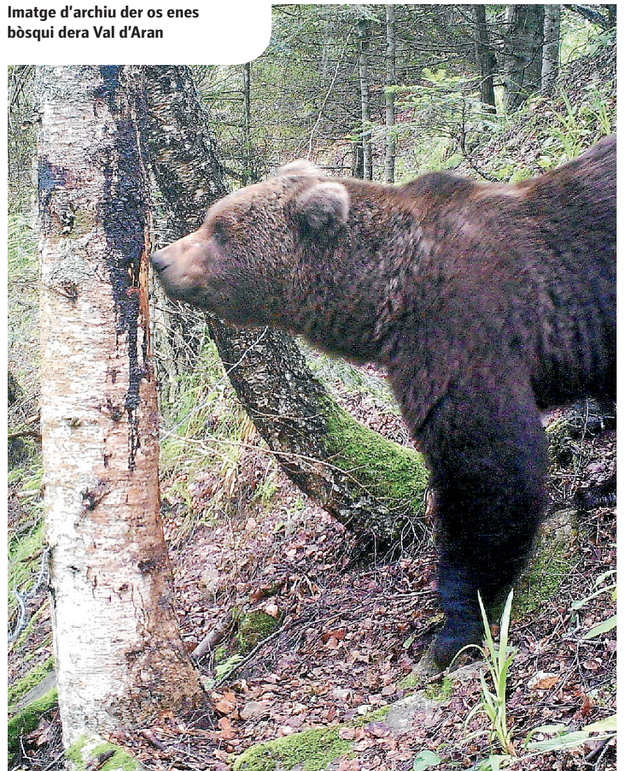
CONSELH GENERAU D'ARAN