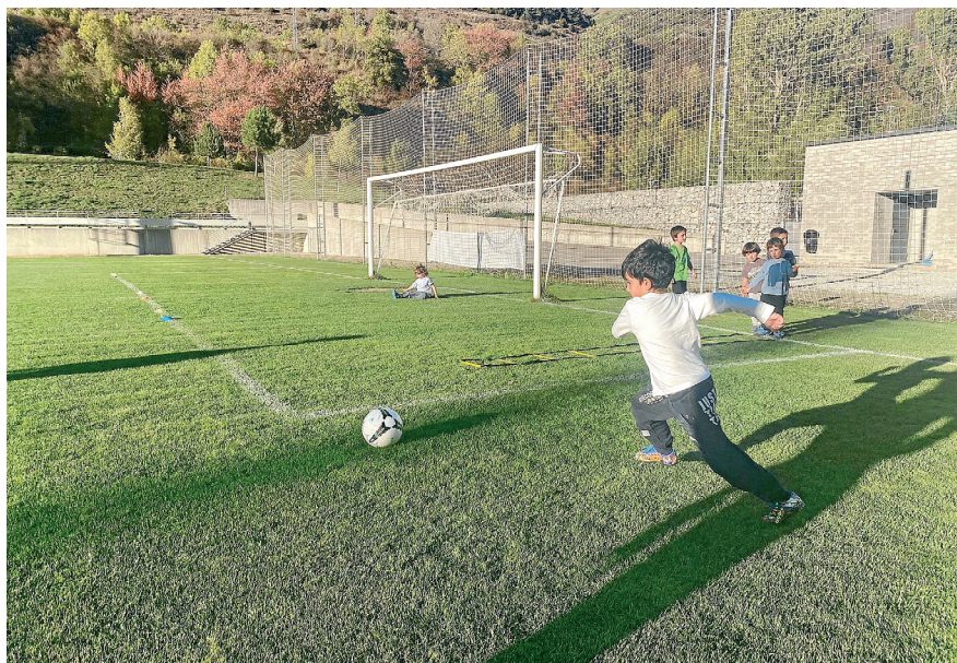
AJUNTAMENT DE NAUT ARAN

AJUDES DESTINADES AS PAIRS E MAIRS E TUTORS QUE VOLGUEN APUNTAR AS SÒNS HILHS ENTÀ ACTIVITATS EXTRAESCOLARS