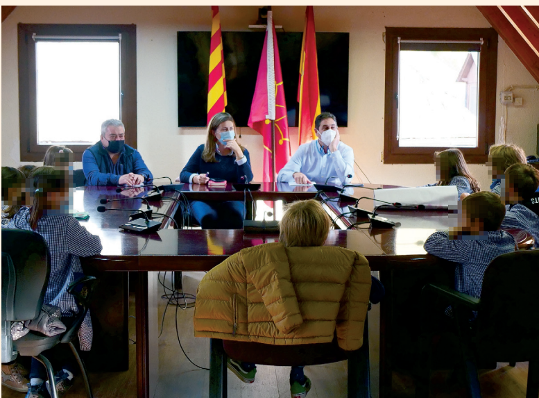
CONSELH GENERAU D'ARAN

S'AN AUTREJAT PRÈMIS ENES CATEGORIES DE POESIA, NOVÈLLA JUVENILA, NARRACION