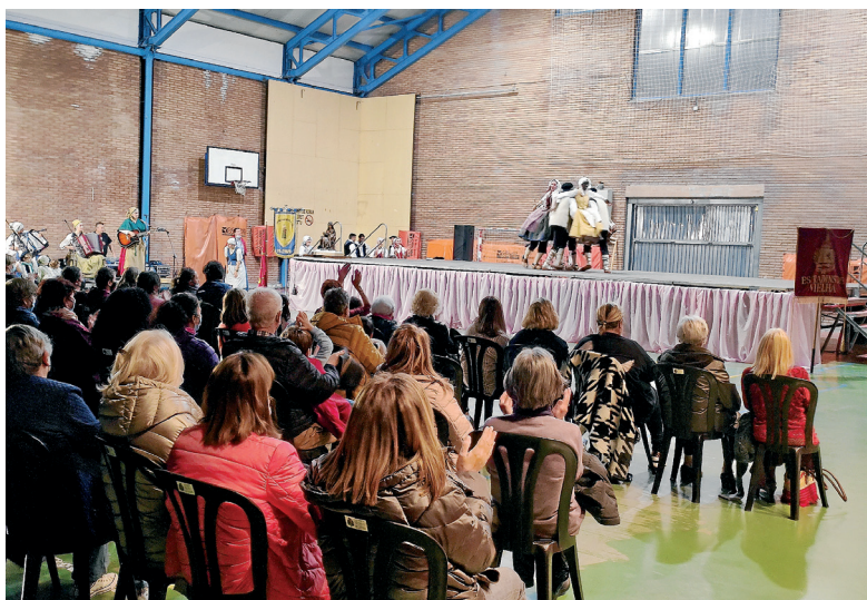
AJUNTAMENT DE VIELHA E MIJARAN

Gran ambient eth que se viueth passat 31 d'octobre ena gala solidària celebrada ena Sala Polivalenta de Vielha, en tot requectar sòs entàs afectadi peth volcàn de La Palma. Es còlhes de dances araneses de Vielha e Mijaran (Còlha Santa Maria de Mijaran e Es Fradins de Vielha) aufriren ua serada damb un espectacle format per desparièrs balhs tipics dera Val d'Aran, en tot préner part d'ua causa ena que i participèren es Volentaris d'Aran e er Ajuntament de Vielha e Mijaran. Un petit gèst de solidaritat des aranesi, que pòt ajudar a fòrça gent qu'a perdut era sua viuenda.