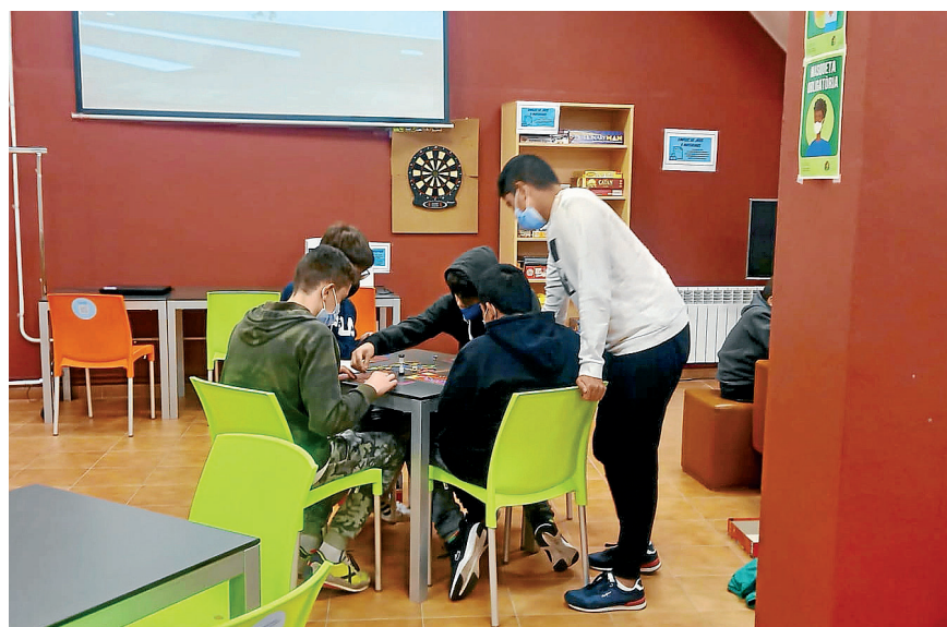
AJUNTAMENT DE VIELHA E MIJARAN

Eth Centre de Joenessa "Antara" de Vielha e Mijaran arrenh granes chifres de participaires pendent es primères setmanes de dubertura, dempús d'auer estat barrat pendent mès d'un an a conseqüéncia dera aparicion dera pandèmia dera COVID-19. Pendent aguest primères tres setmanes de dubertura, s'an enregistrat mès de 250 personas en centre, en tot auer arrenhut auer 50 personas per dia. "Antara" s'assolide, per tant, coma er espaci de referéncia de trobades des joeni deth municipi, de 12 a 18 ans, pendent es dimenjades e hestius. De cara as pròplèu setmanes se tornaràn a hèr es talhèrs tematics, que prenen qu'es joeni aprenquen valors.