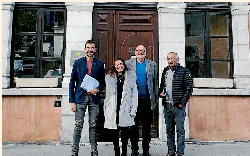
AJUNTAMENT DE BOSSÒST