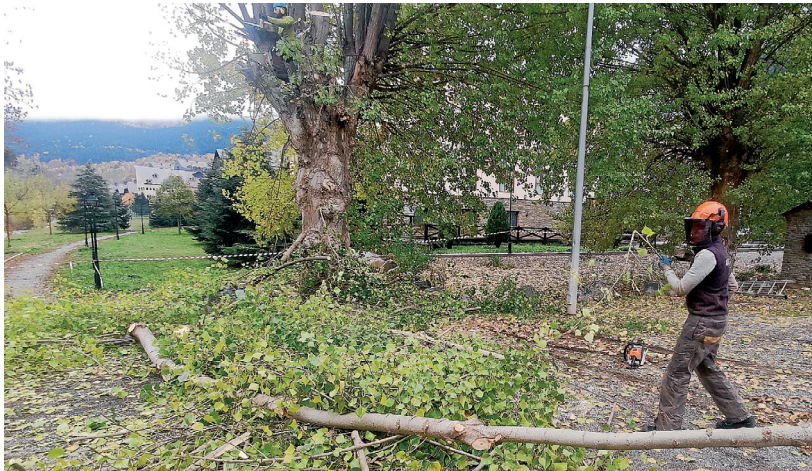
AJUNTAMENT DE VIELHA E MIJARAN

Er Ajuntament de Vielha e Mijaran participe en procès de presentacion de projèctes entà obtier ua ajuda enes hons europèus 'NextGenerationEU'. Aguesti hons son dirigidis a paliar es damatges economicos e socials immediats causadi pera pandèmia dera COVID-19. Eth consistori a presentat dus projèctes: un de melhora dera eficiéncia energetica deth Palai de Gèu e un dusau entà plaçar enluminat LED en tot eth municipi, en tot cercar ua melhora energetica enes espacis publics.